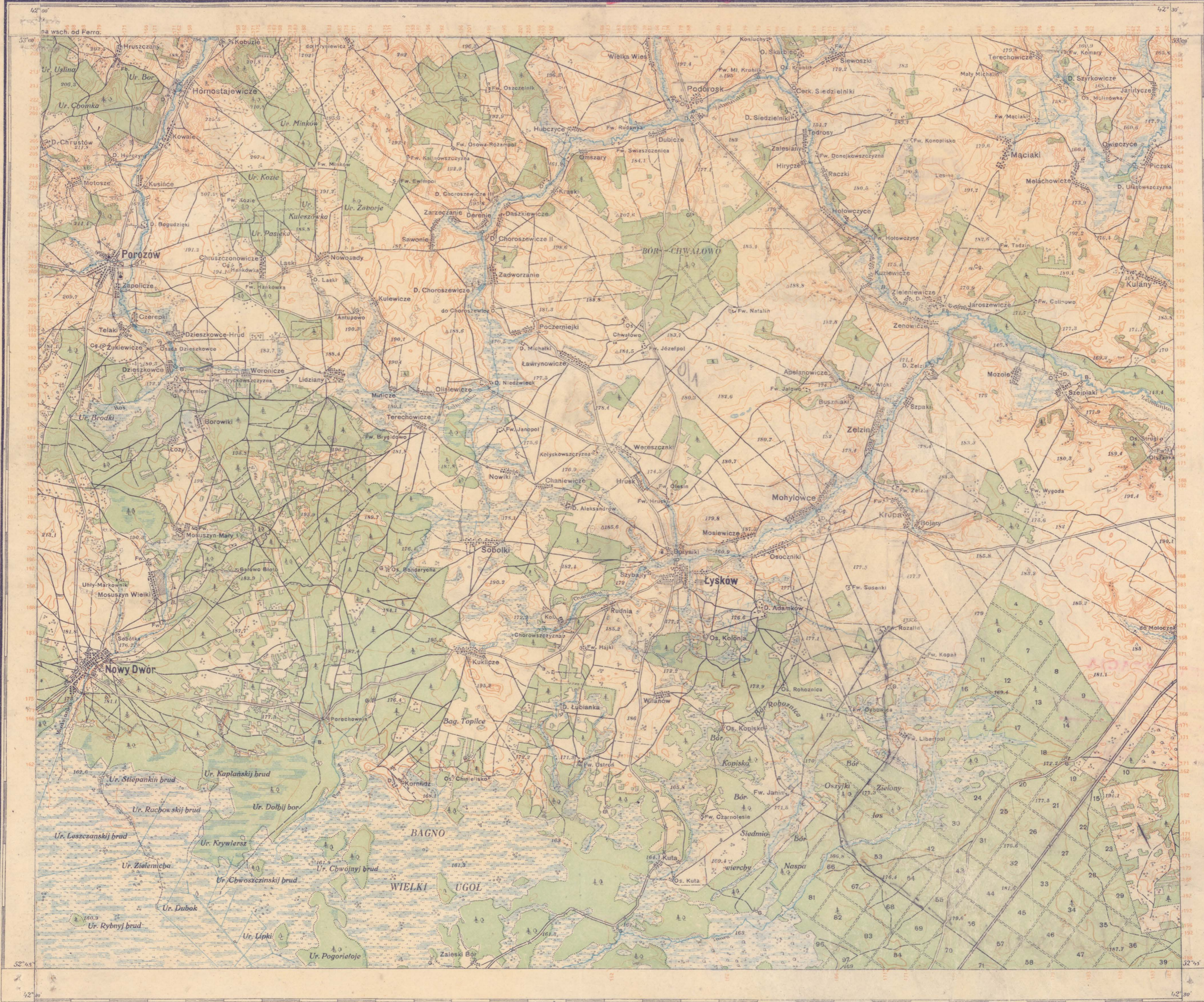
Objaśnienie odczytywania poziomu arkusza ŁYSKÓW

P. A. N. C. 626/125 Numer ewidencji 138/1