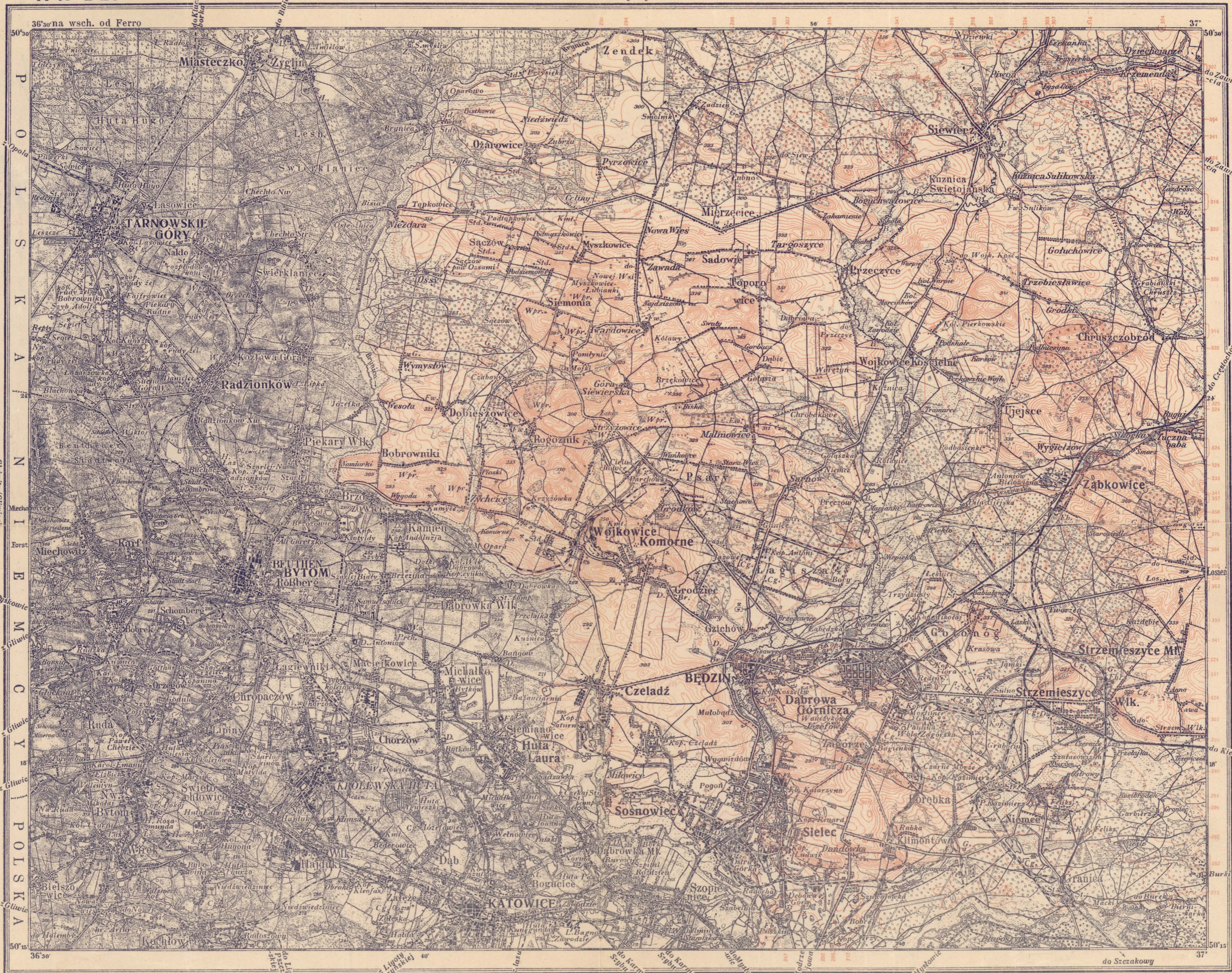
Objaśnienie odczytywania poziomu arkusza BYTOM-BĘDZIN