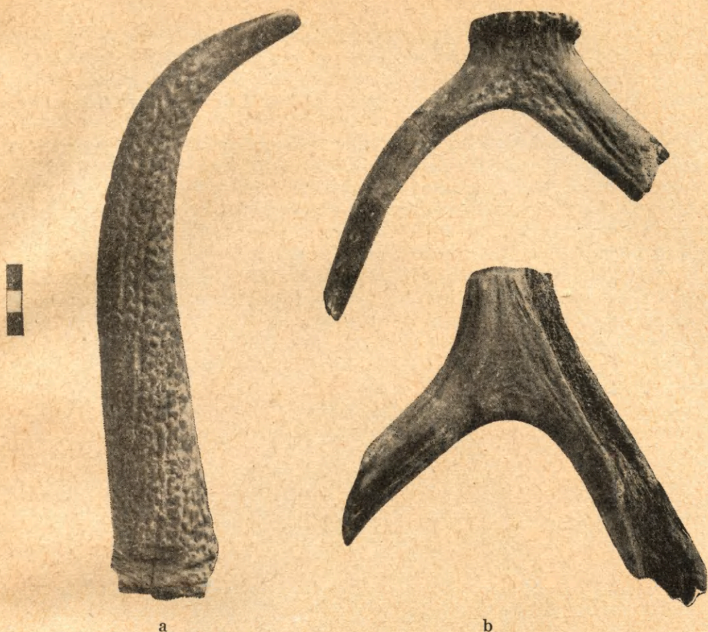
Ryc. 3. Biskupin, pow. Znin, półwysep a — rogowe narzędzie kopieniacko-zbierackie ze starszego grodu łużyckiego; b — motyki rogowe z młodszego grodu łużyckiego.

zgliszczach młodszego grodu łużyckiego. Byłaby to najprawdopodobniej nikła pozostałość po najstarszej, pierwszej fazie osadnictwa wczesnośredniowiecznego na półwyspie, datowanej na VI—VII w. Przemawiałoby za tym również znalezienie tu słupa, niewątpliwie wczesnośredniowiecznego, a nie łużyckiego, na co wskazują charakterystyczne ślady obróbki, którego górny koniec dotyka spągu rozsypiska wymienionego już wału z VIII—X w. i który skutkiem tego musi być starszy od wału. Za tym samym przemawia wreszcie jeden okaz inwentarza ruchomego, a mianowicie dość typowe dla okresu wędrówek ludów ogniwo sprzączki brązowej ze zgrubieniem służącym za oparcie dla ostrego końca kolca i z karbą do osadzenia nasady tego kolca (ryc. 1) 1 . Znaleziony w tej najstarszej warstwie wczesnośredniowiecznej pod wałem z VIII—X wieku materiał ceramiczny obejmuje przeważnie skorupy naczyń, o których trudno powiedzieć, czy były lepiące bez koła, czy na kole, i zawiera też nieco szczątków naczyń obtaczanych na krawędzi, a niekiedy nawet w większej części, zdobionych ornamentem wykonanym narzędziem kilkuzębny. Stwierdzono w tym zespole brak naczyń całkowicie obtacza-