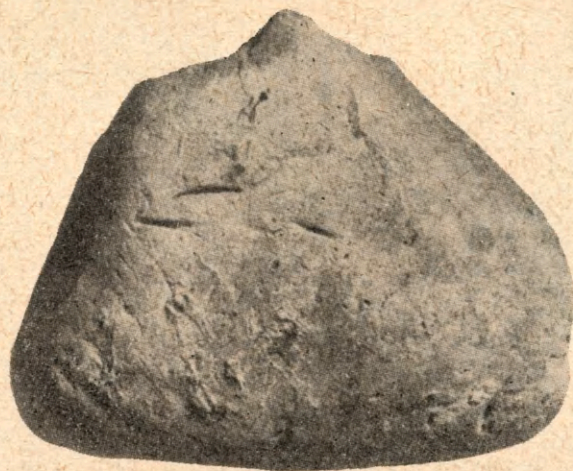
Ryc. 4. Biskupin, pow. Żnin, półwysp. Gliniany wisiorek trójkątnego kształtu z młodszego grodu łużyckiego, będący zapewne talizmanem-fetyszem. Okaz nieco powiększony.

W tej samej warstwie kulturowej, która spod rozsypiska wału wysuwa się na przedwale i tu zdaje się być częściowo także współczesna wałowi (VIII—IX w.) narastając w czasie jego trwania aż do momentu, kiedy został zniszczony (X w.), przeważa wprawdzie materiał ceramiczny, o którym trudno powiedzieć, czy wykonano go bez koła, czy też na kole. Występuje jednak także dość duży procent szczątków naczyń obtaczanych na krawędzi i pewna ilość skorup obtaczanych nawet w dużej części naczyń cienkościennych, doskonalszej produkcji, wykonanych starannie, o domieszce bardziej miękkiej i zdobionych ornamentem wykonanym patykiem. W opisanym zespole znaleziono skorupę, na której dostrzeżono ślady jak gdyby nieudolnego naśladownictwa pisma.