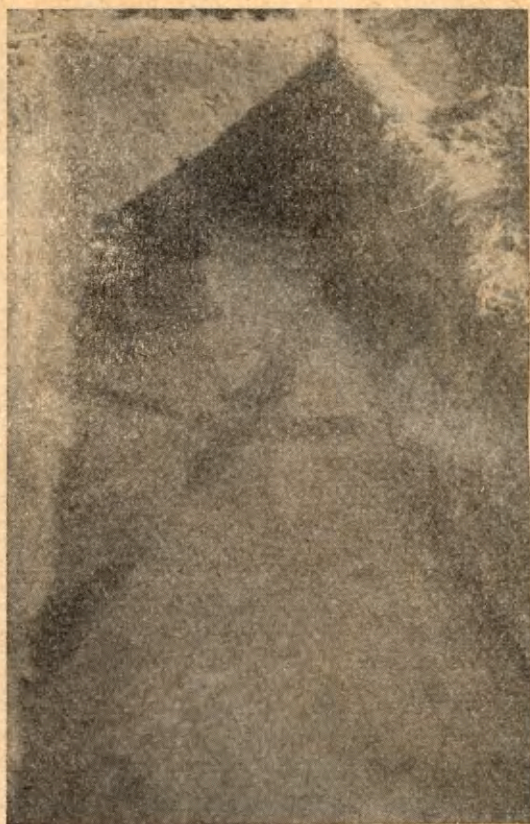
Ryc. 2. (lewa) Tum pod Łęczycą. Widok na wykop z wieży kolegiaty