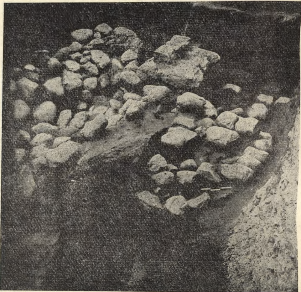
Ryc. 3. Płock. Relikty architektoniczne monumentalnej budowli kamiennej z 1 poł. XI w., odkrytej na podgrodzium na Wzgórzu Tumskim i będącej prawdopodobnie częścią opactwa benedyktyńskiego. W głębi widać fundament kolumny z fragmentem jej bazy