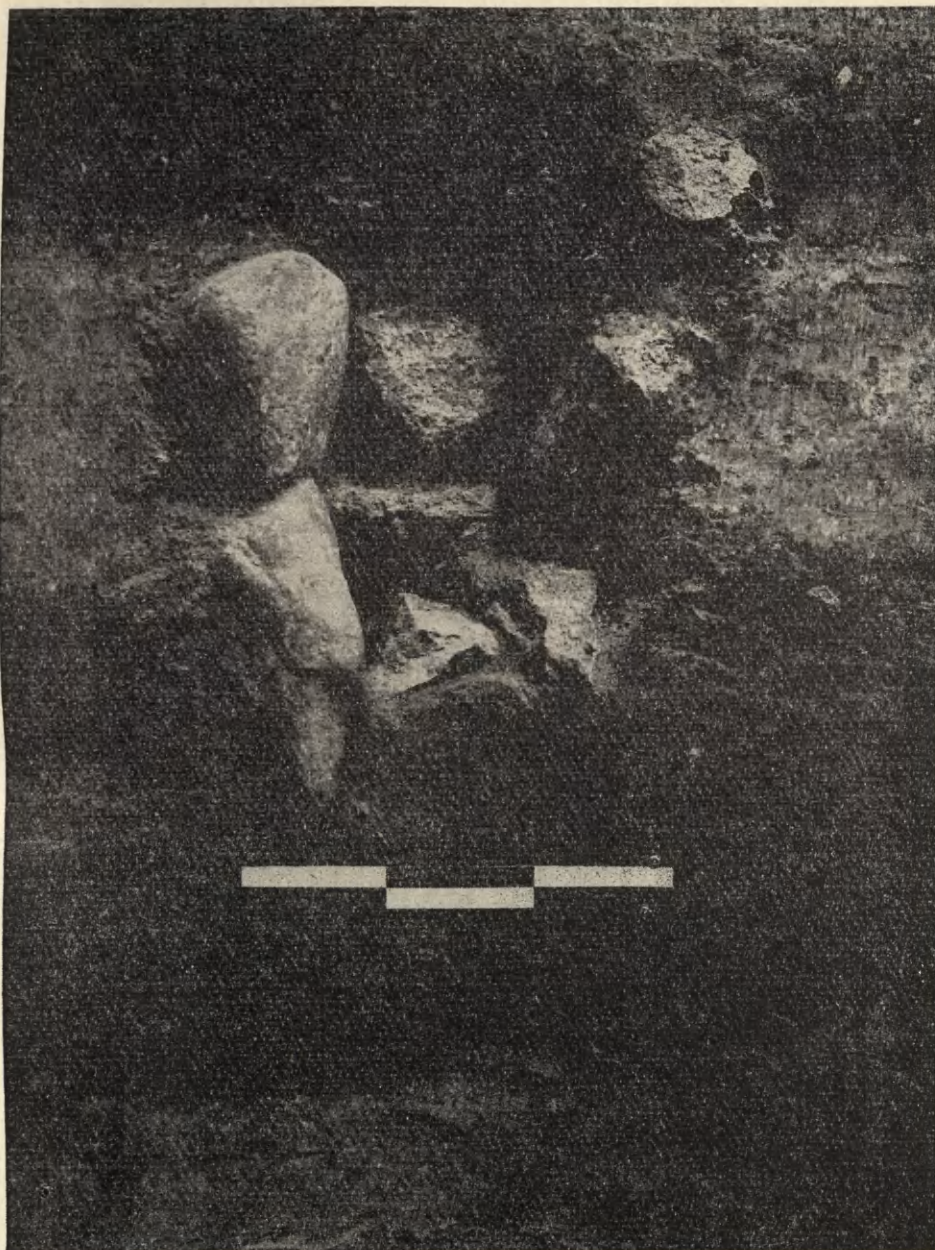
Ryc. 4. Płock. Kamienny postument prawdopodobnie krzyża misyjnego z 1 poł. XI w., odkryty na podgrodziu na Wzgórzu Tumskim na wczesnośredniowiecznym placu budowlanym (uprzednim targowisku), na którym niebawem miały stanąć zabudowania opactwa benedyktyńskiego