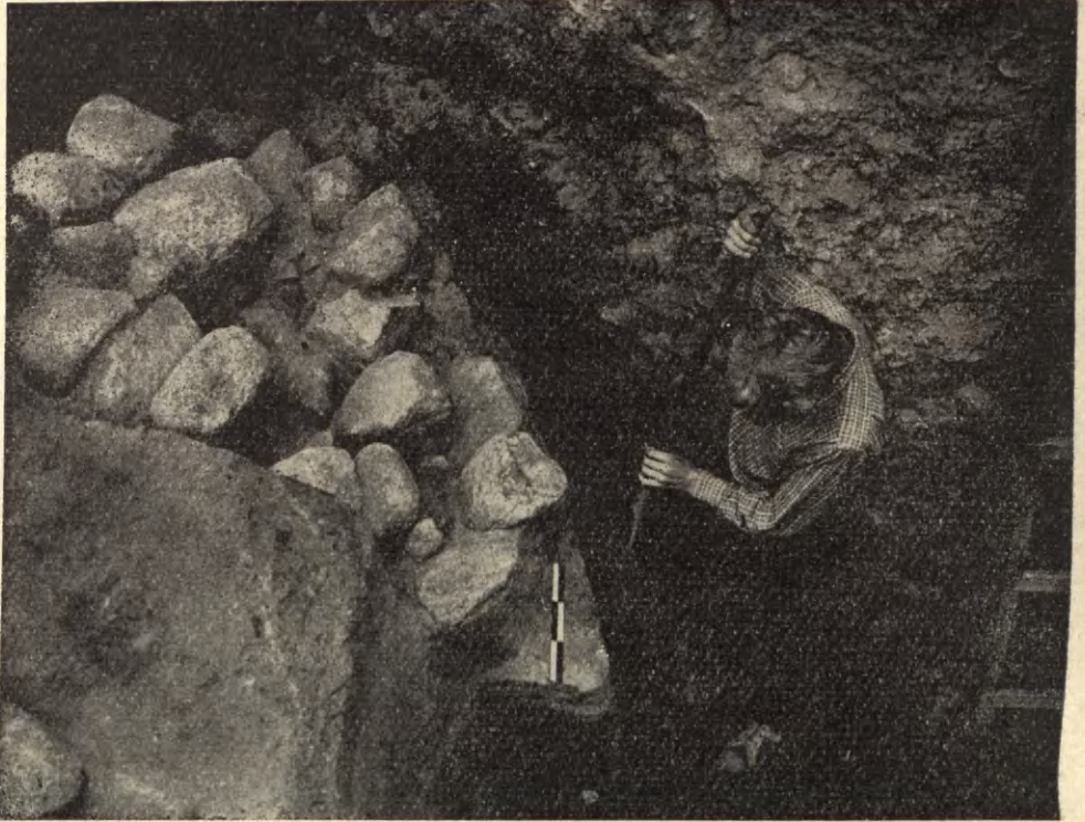
Ryc. 1. Płock. Łukowaty odcinek rowu fundamentowego XI-wiecznej budowli opactwa benedyktyńskiego na podgrodziu na Wzgórzu Tumskim