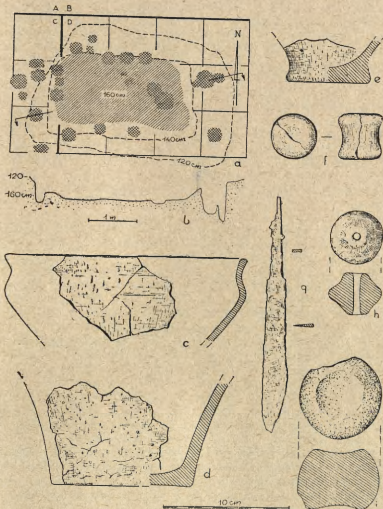
Ryc. 2. Dalewice, pow. Proszowice, stan. 1, rej. III:

a — ziemianka nr 77, rzut poziomy z zaznaczeniem poziomów na gł. 120, 140 i 160 cm b — profil ziemianki nar. 77; c—e — zabytki z ziemianki nr 77; f—j — zabytki z rejonu III, pochodzące z warstwy ziemi ornej