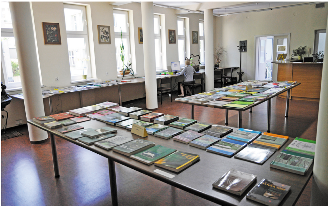
Ryc. 2. Sala wypożyczalni i czytelnicy Biblioteki IB PAN/UJ. Wystawa nowości wydawniczych (Fot. K. Rojmejko-Hurko).

Obok regularnie odbywających się wystaw nowości organizowano także wystawy okolicznościowe, będące uzupełnieniem wydarzeń o charakterze historycznym lub naukowym (Ryc. 2, 3). Współczesne prezentacje zbiorów specjalnych organizowane są dla uczestników