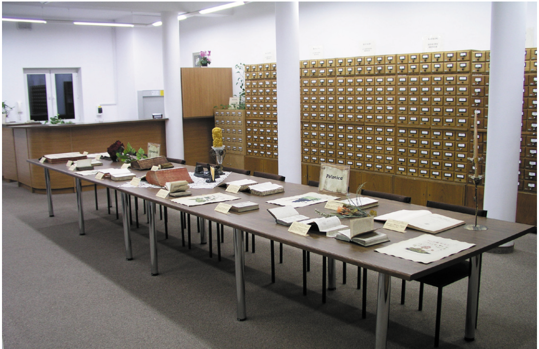
Ryc. 3. Sala wypożyczalni i czytelní Biblioteki IB PAN/UJ. Wystawa starodruków (Fot. K. Romejko-Hurko).

Międzynarodowego Studium Doktoranckiego działającego przy IB PAN, dla słuchaczy studiów bibliotekoznawczych odbywających praktykę w Bibliotece, zorganizowanych grup szkolnych oraz użytkowników indywidualnych.