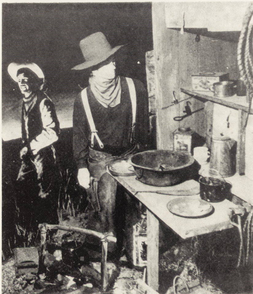
Ryc. 2. Wóz z kuchnią pasterzy bydła, tamże, s. 12