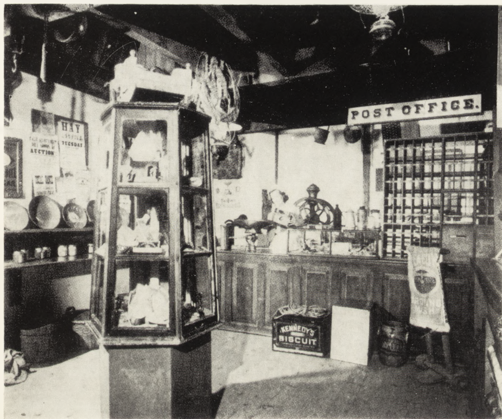
Ryc. 3. Poczta z XIX wieku, tamże, s. 20