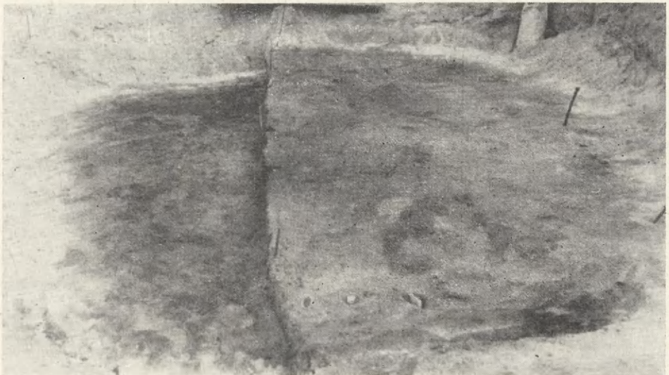
Ryc. 2. Groszowice, pow. Opole. Górna płaszczyzna jamy domu nr 8