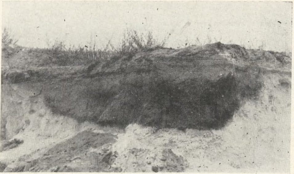
Ryc. 1. Groszowice, pow. Opole. Krawędź piaskowni z widoczną jamą domu nr 1 przed rozpoczęciem badań