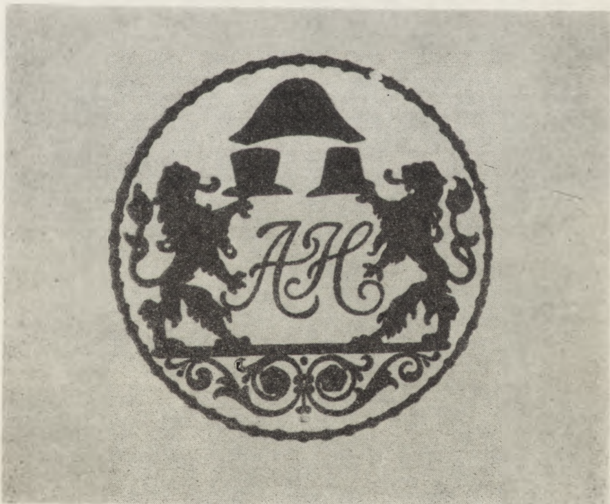
Ryc. 2. Oznaka fabryczna zakładu Augustina Hückela sprzed 1848 r.