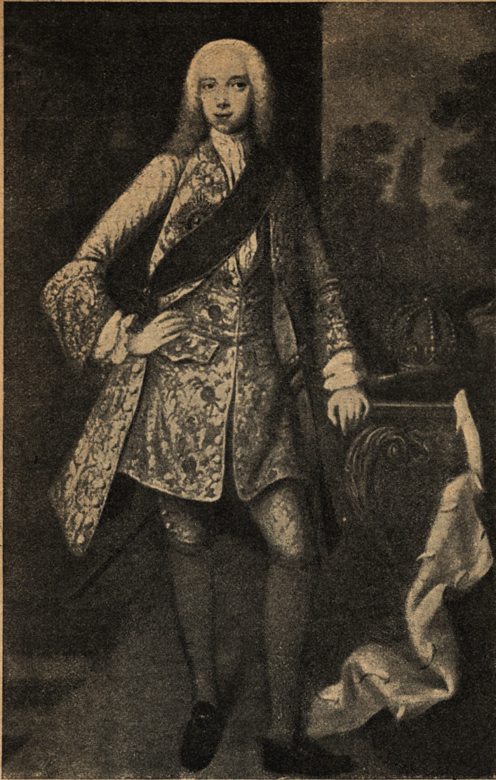
ИМПЕРАТОРЪ ПЕТРЪ III ВЪ ЮНОСТИ.