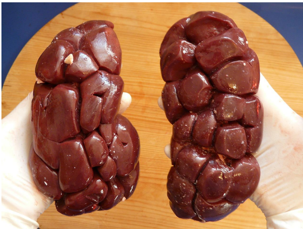
Rycina 6. Nerki wołowe o budowie płatowatej 35 .