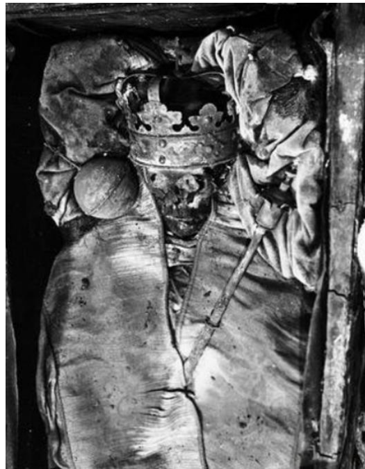
Rycina 3. Zdjęcie szczątków króla Stefana Batorego wykonane podczas drugiej ekshumacji w 1930 r. 12 .