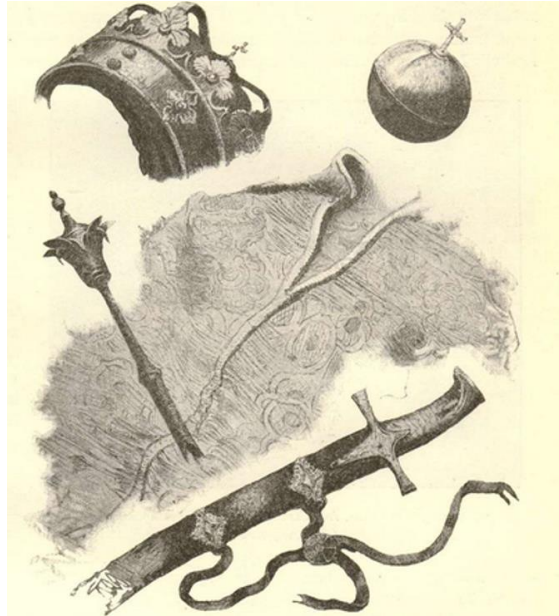
Rycina 2. Regalia Stefana Batorego odrysowane przy otwarciu jego trumny podczas pierwszej ekshumacji w 1877 r., zamieszczone w Encyklopedii Glogera 11 .