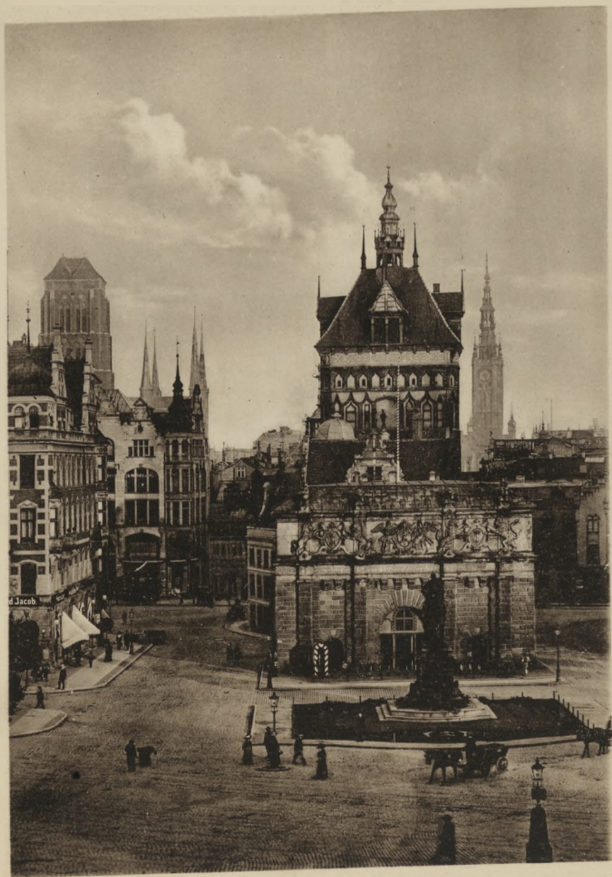
DANZIG — Hohes Tor und Stockturm.