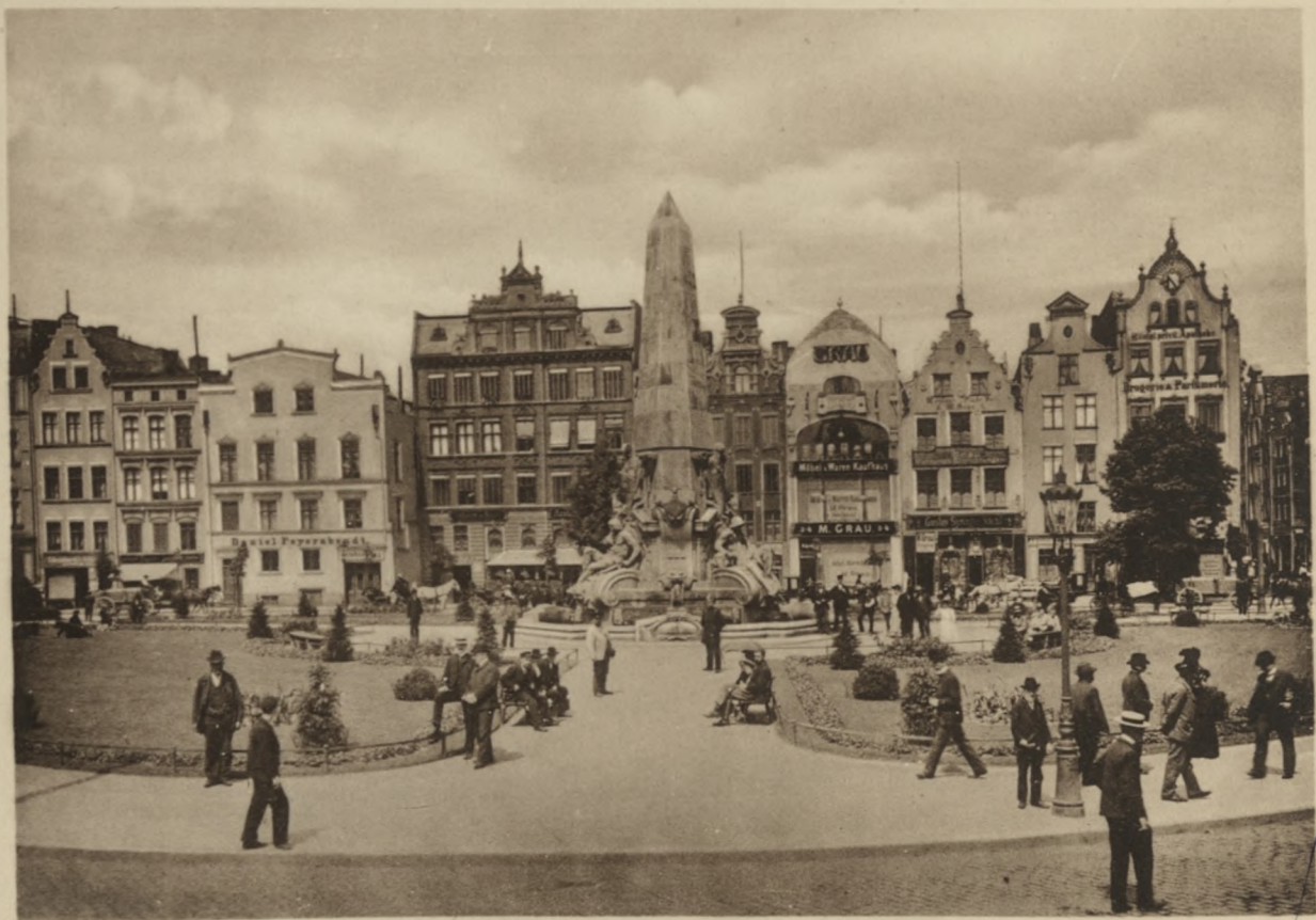
DANZIG — Holzmarkt.