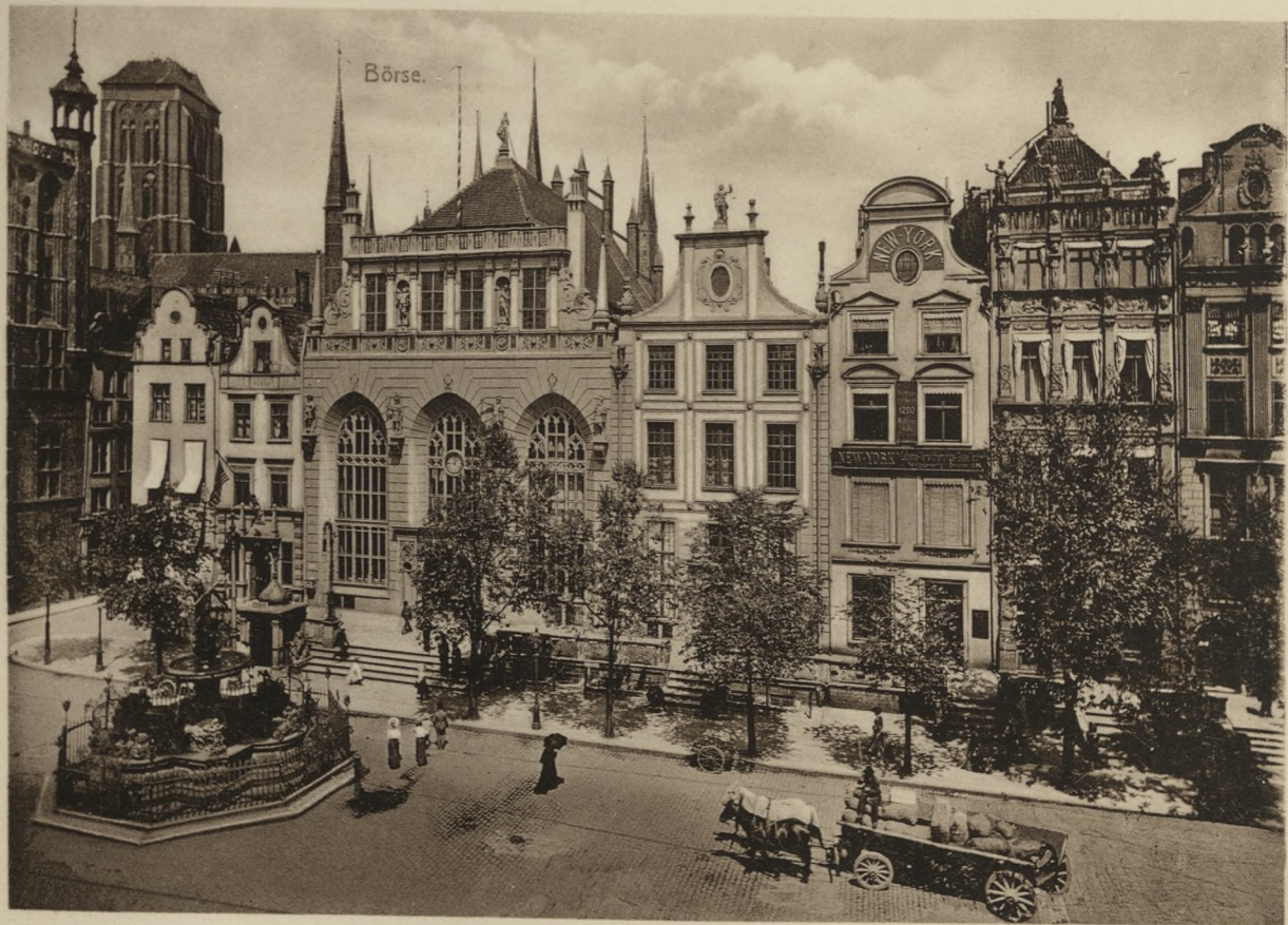
DANZIG — Langemarkt.