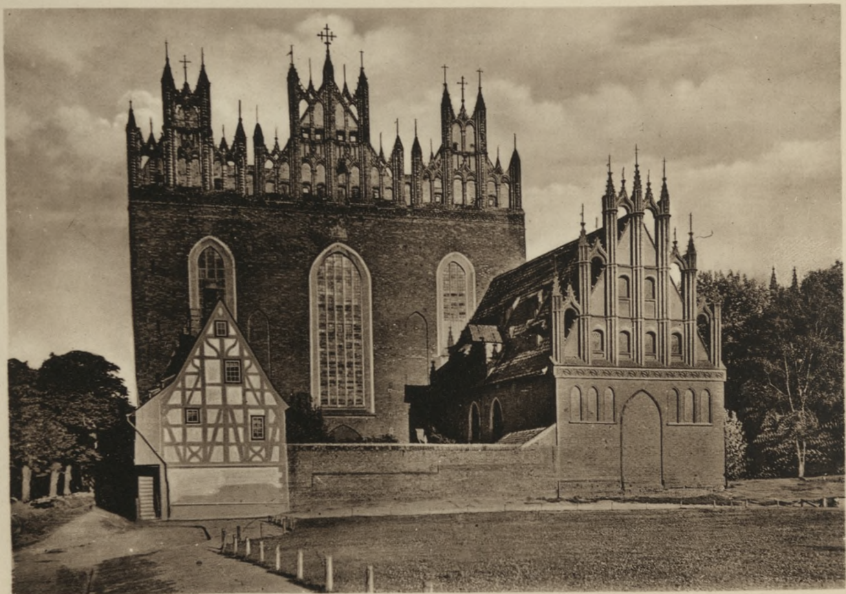
DANZIG — St. Trinitatiskirche mit Kanzelhaus.