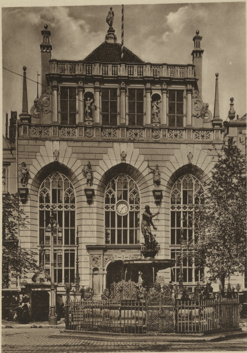
DANZIG — Börse.