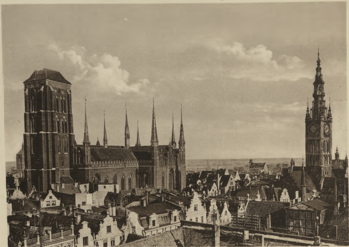
DANZIG — Marienkirche und Rathausurm.