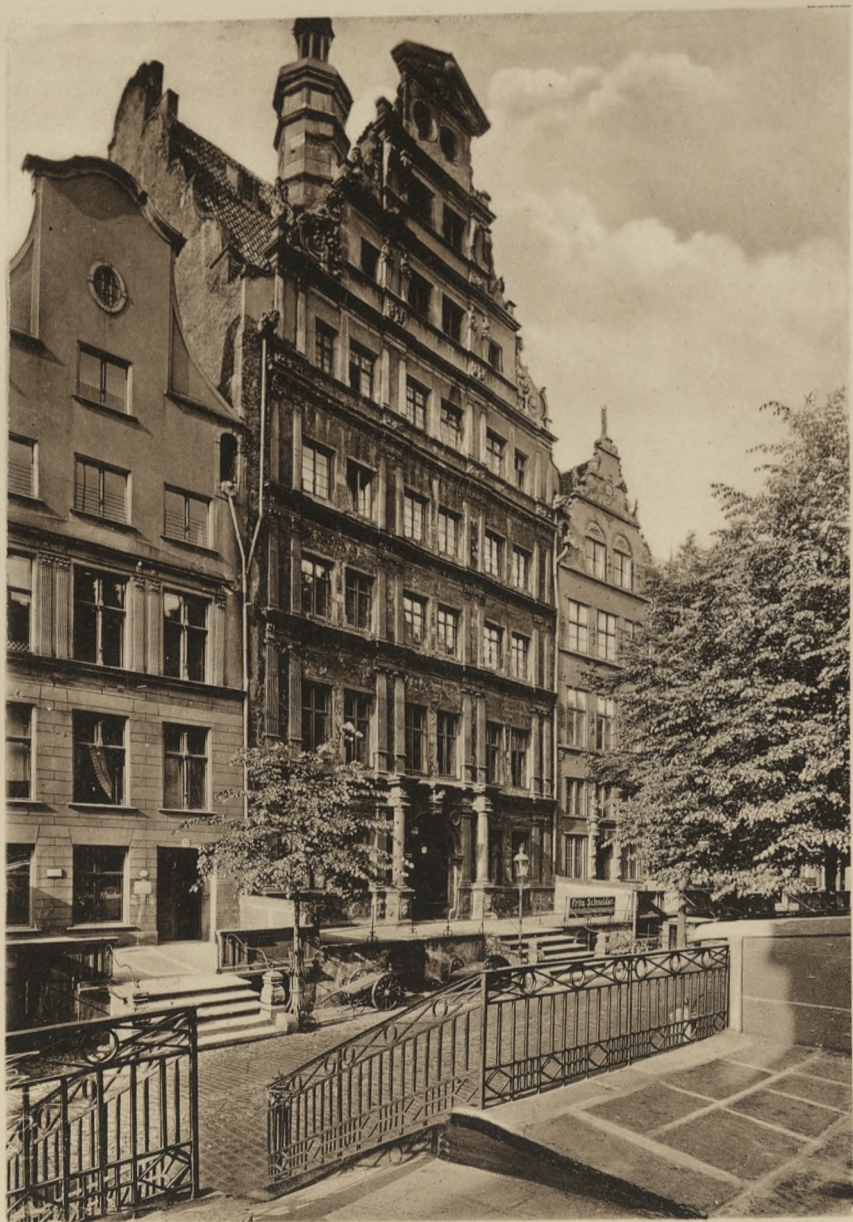
DANZIG -- Englisches Haus.