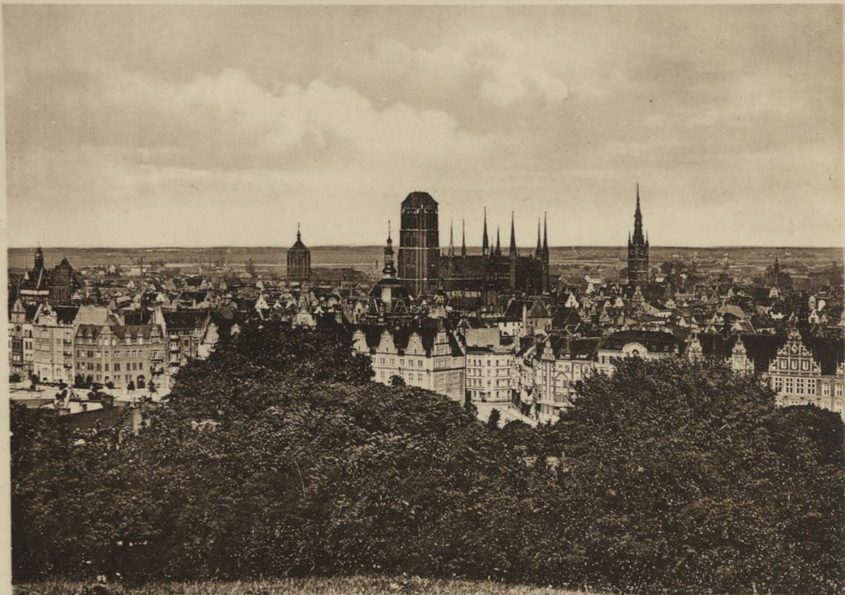
DANZIG. Wistok ogólny