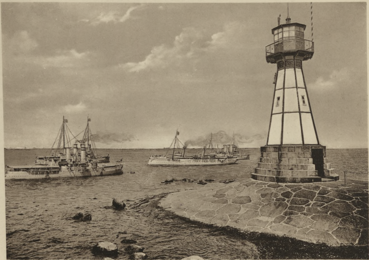
DANZIG — Neufahrwasser. Leuchtturm.