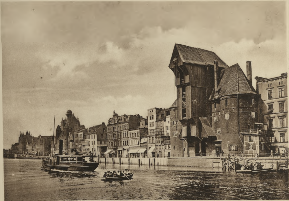
DANZIG — Langebrücke mit Krahnentor.