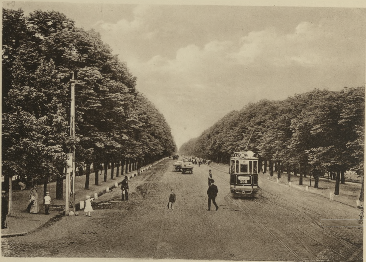
DANZIG — Große Allee.