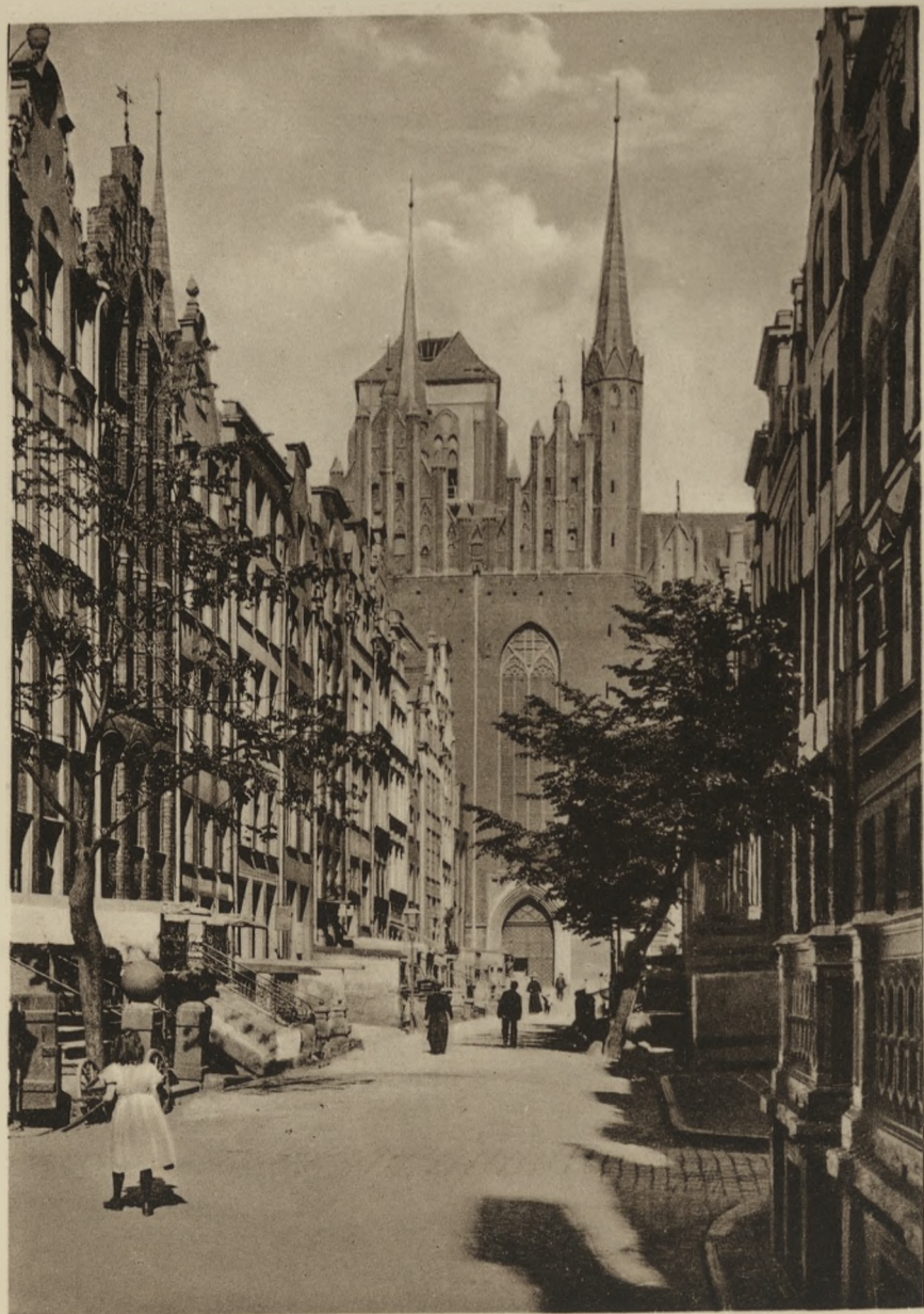
DANZIG — Frauengasse und Marienkirche.