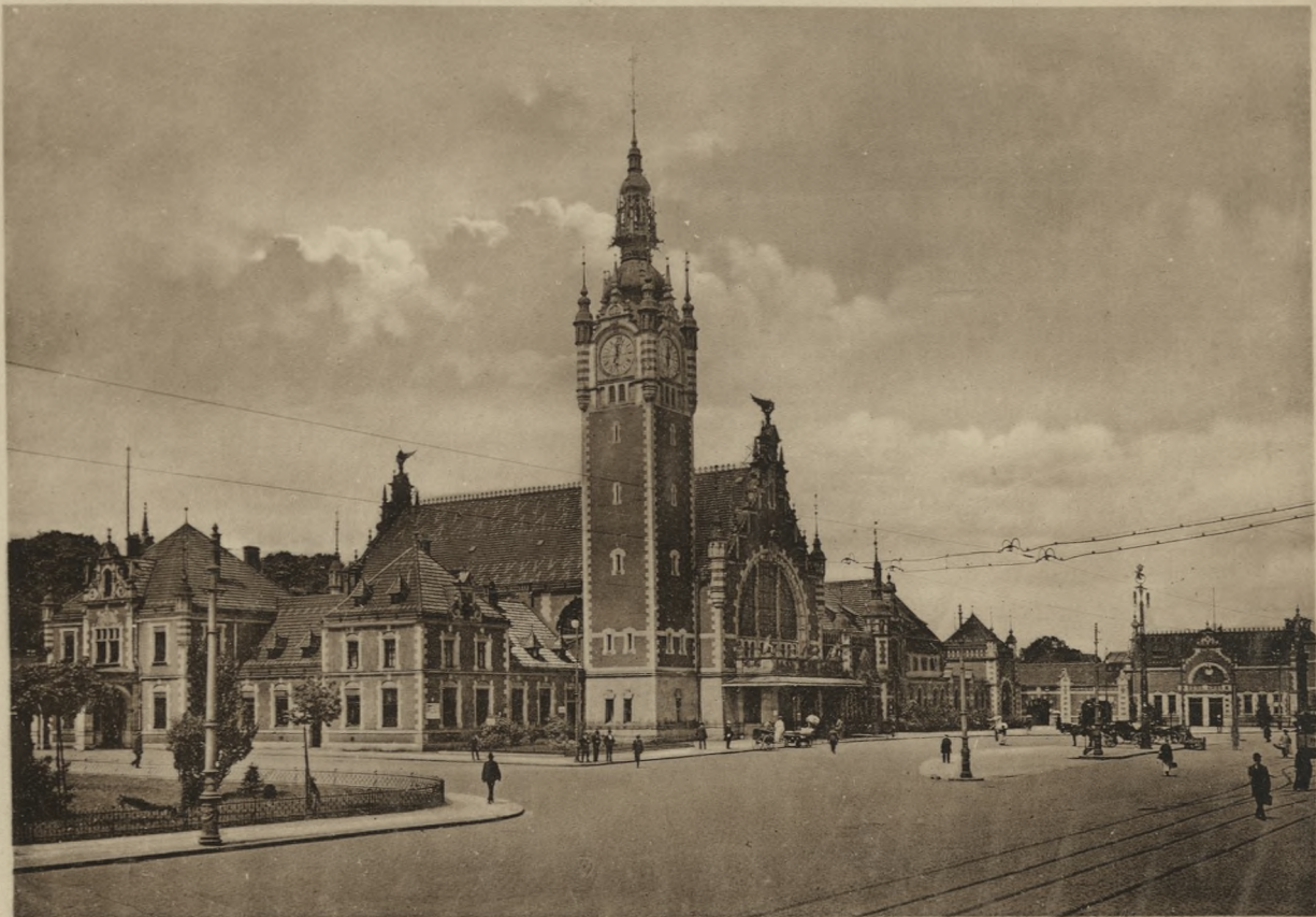
DANZIG — Bahnhof.