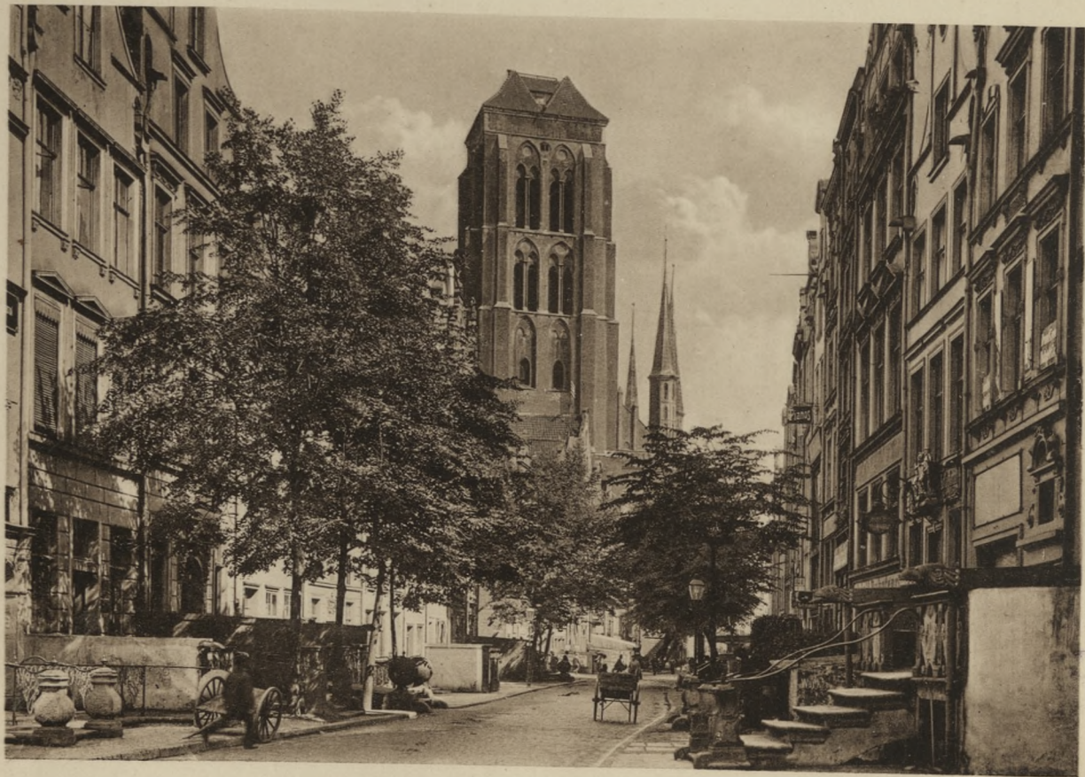
DANZIG — Jopengasse und Marienkirche.