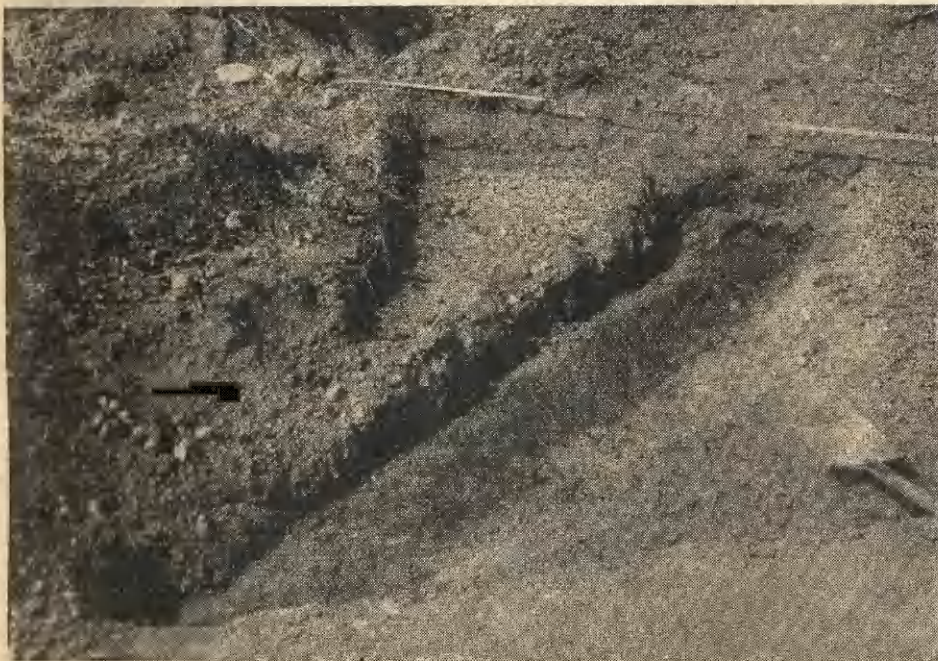
Ryc. 3. Siciny, pow. Góra. Rzut poziomy uchwyconego odcinka rowka (fundamentowego ?) nr 1