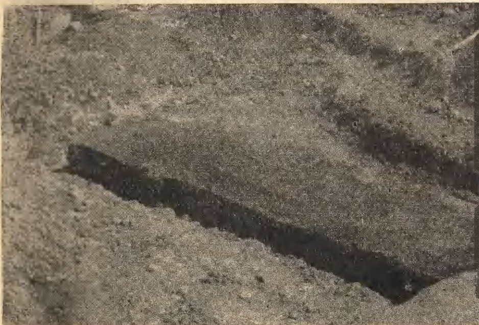
Ryc. 2. Siciny, pow. Góra. Zarys wschodniej części jamy nr 5 (jama 5b), na głębokości 0,20m od poziomu odsłonięcia obiektu