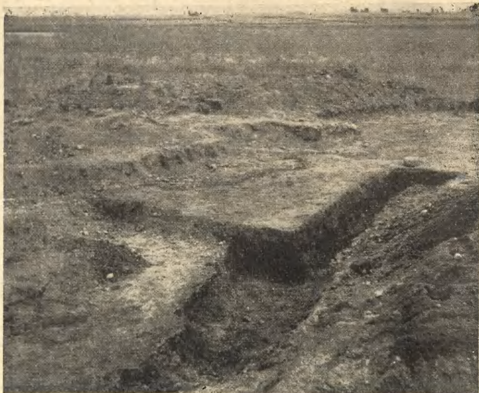
Ryc. 1. Siciny, pow. Góra. Profile centralnej partii jamy nr 5