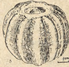
Ryc. 2. Wietrzychowice, pow. Koło. Stan. 1. Kamienna głowica maczugi

wschodniej kultury pucharów lejkowatych, z fazy pośredniej między sarnowską a wiórecką. Były to w ogromnej większości niecharakterystyczne fragmenty brzuśców oraz kilkanaście fragmentów brzegów zdobionych z reguły przykrawędnym ornamentem dużych regularnych dołków i czasami słupków. Na uwagę zasługuje fragment pucharu na pustej nóżce (ryc. 3: 5) kultury lendzielskiej, z ornamentem kłutym, znaleziony tuż na zewnątrz obstawy z głazów, na pierwotnym poziomie gruntu. Usytuowanie tego fragmentu zdaje się nie wykluczać możliwości współczesnego współwystępowania zabytków obu kultur.