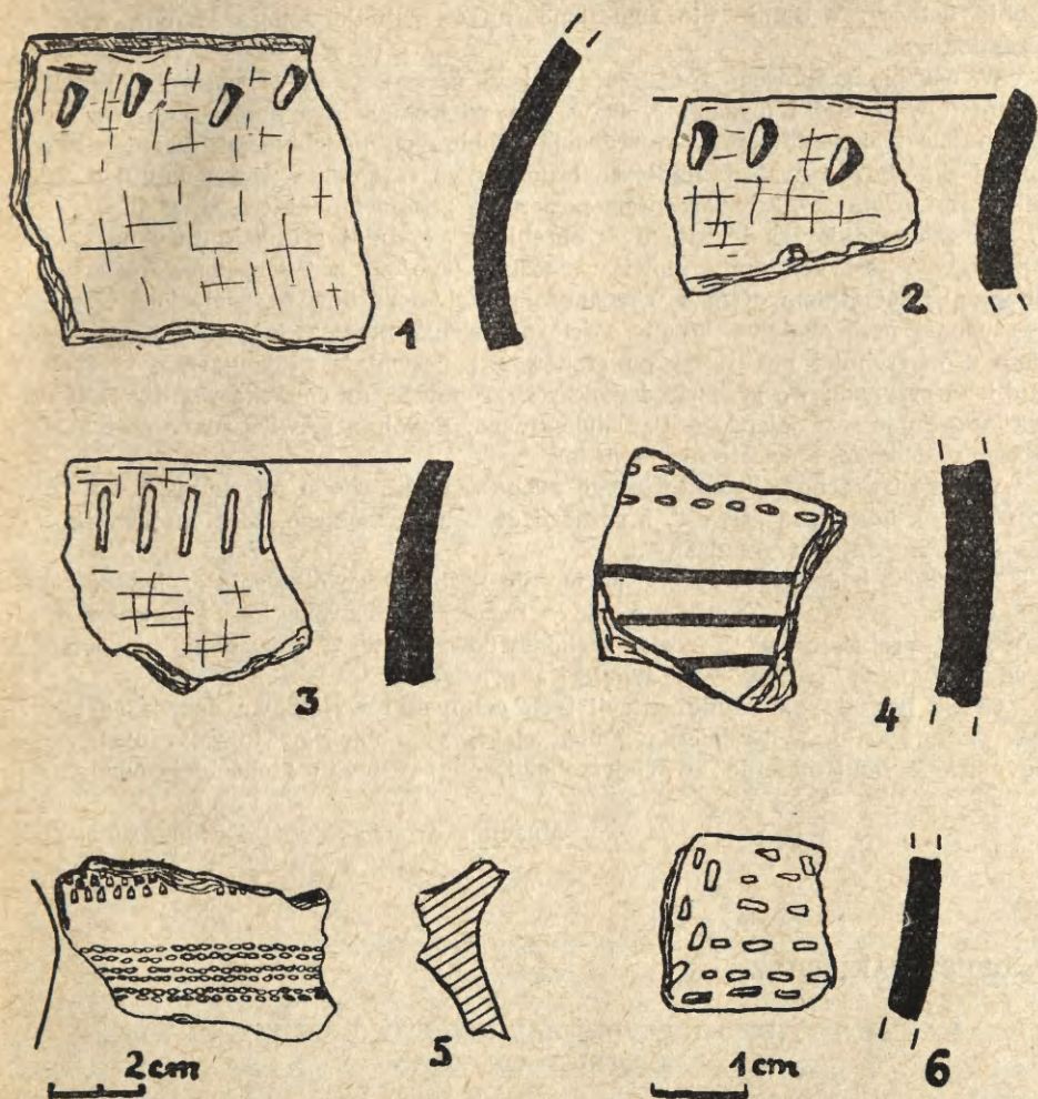
Ryc. 3. Wietrzychowice, pow. Koło. Stan. 1:

1, 2 — fragmenty ceramiki kultury pucharów lejkowatych z grobowca nr 1; 3, 4 — fragmenty ceramiki kultury pucharów lejkowatych z grobowca nr 5; 5 — fragment pucharu na pustej nóżce kultury lendzielskiej; 6 — fragment naczynia kultury ceramiki kreskowo-klutej (1—4, 6 — w.n.; 5 — 1/2 w.n.)