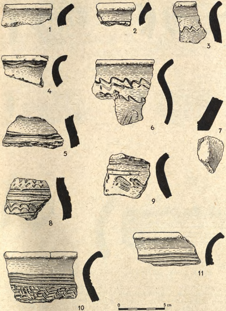
Ryc. 2. Rękoraj, pow. Piotrków Trybunalski. Stan. 1. Ułamki ceramiki