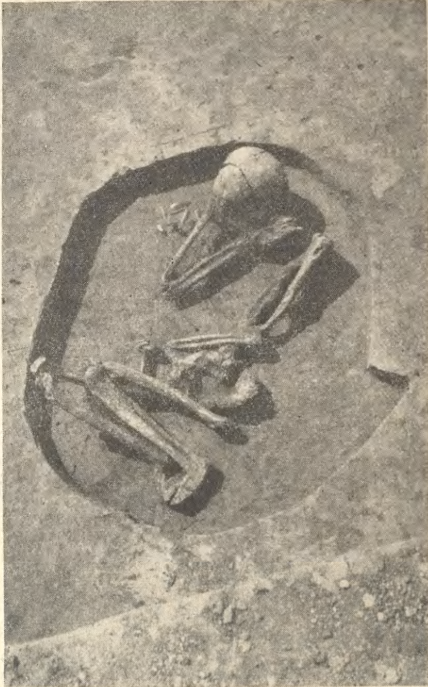
Ryc. 2. Michałowice, pow. Kraków. Grób szkieletowy

wadzonych w dorzeczu Dłubni wiosną 1967 roku 1 , natrafiono tu między innymi na dużą osadę, którą na podstawie materiału powierzchniowego określono jako należąca do kultur ceramiki wstęgowej rytej, lendzielskiej i trzcienieckiej.