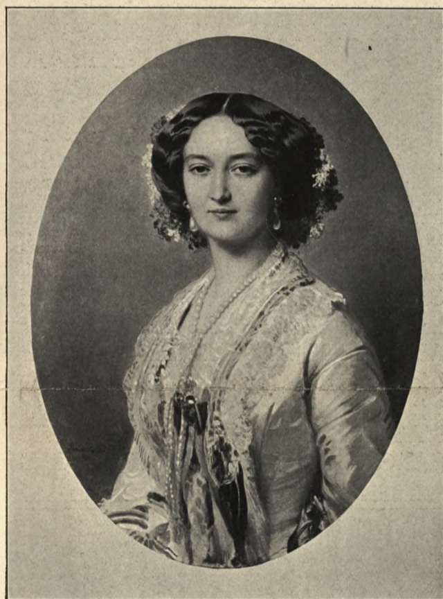
Fr. Winterhalter pinx.

SKŁADY GŁÓWNE: KSIĘGARNIA H. ALTENBERGA WE LWOWIE, E. WENDE I SP. W WARSZAWIE.