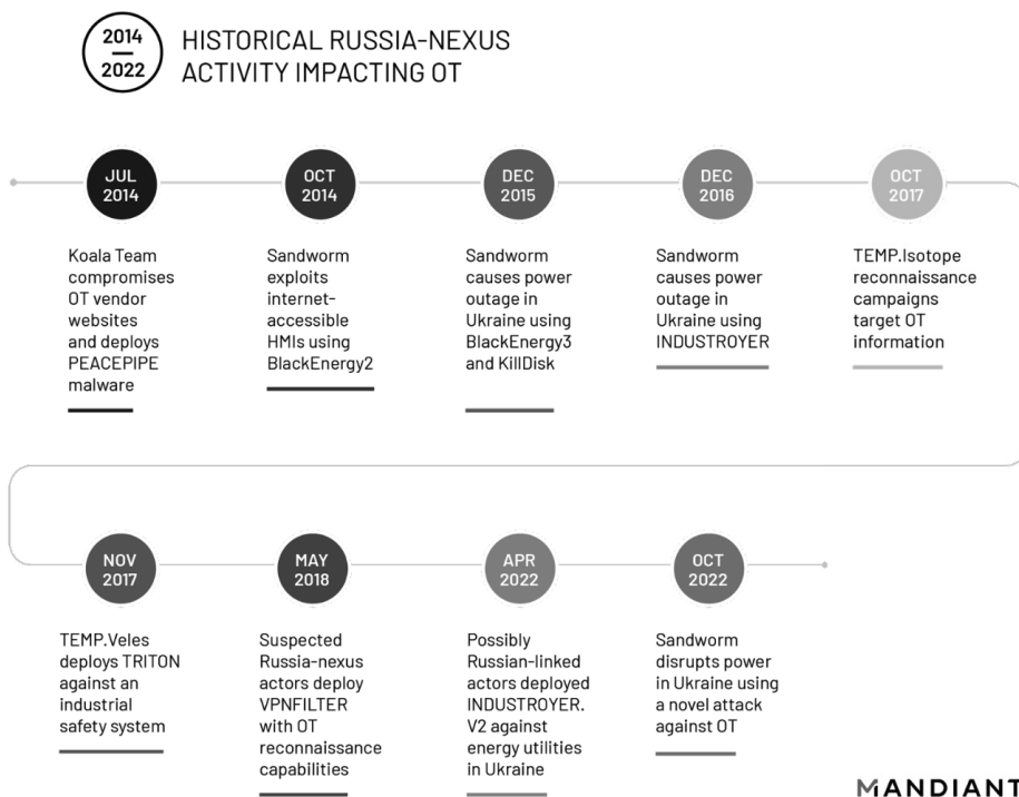
Rysunek 3. Rozwój narzędzi aktora Sandworm/Seashell Blizzard/Nexus na przestrzeni lat