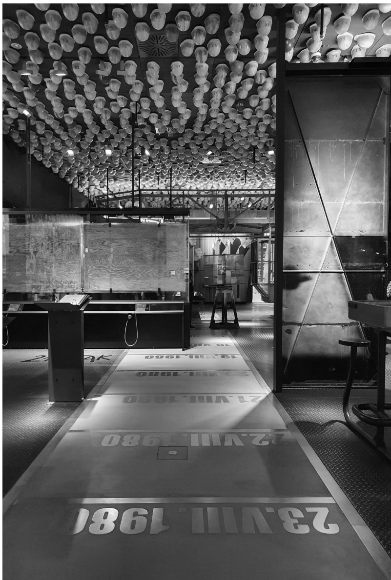
Fot. 3. Sekcja „Narodziny Solidarności” w ECS, wrzesień 2021