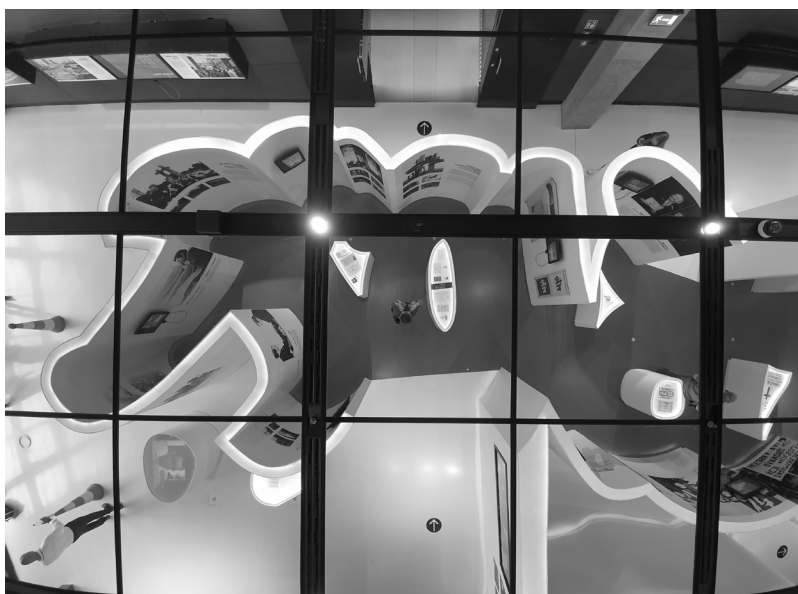
Fot. 1. Sekcja „Solidarność i nadzieja” na wystawie ECS, wrzesień 2021

łatwej ścieżki afirmacji polskiej pamięci i tożsamości: „przypisywanie [polskiej] [...] wspólnocie wyjątkowej identyfikacji przez podkreślanie pewnych (pozytywnych) znaczeń i mitów oraz ignorowanie innych” na potrzeby ostatecznego efektu wykreowania „narodowej marki” 12 . W tym kontekście warto jednak odnotować, że wystawa prezentuje historię Solidarności jako realistyczną i szczegółową opowieść o kolektywnym, konkretnym, codziennym wysiłku i osiągniętym dzięki niemu sukcesie; jej rejestrem jest raczej „zwyczajność” niż patos i generalizacja. W ten sposób przynajmniej częściowo odchodzi od rozpowszechnionych upraszczających pamięciowych klisz.