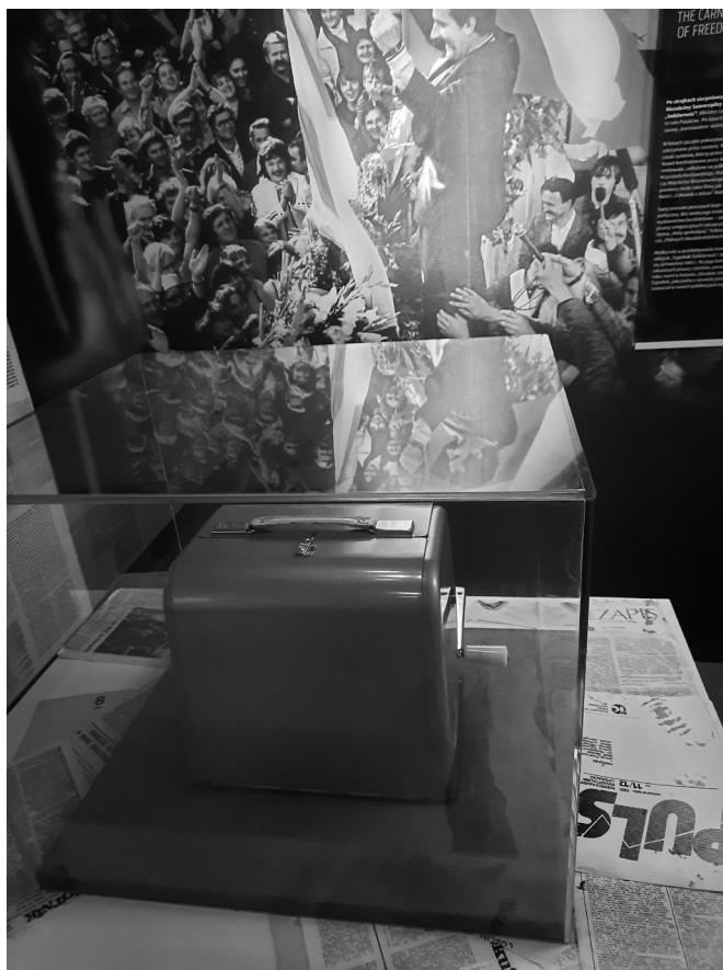
Fot. 4. Powielacz na wystawie Muzeum Emigracji

Solidarności. Charakterystyczny jest też sposób wyeksponowania powielacza w podłużnej sali poświęconej Solidarności. Na jej końcu wisi wielkie zdjęcie Wałęsy w wiwatującym tłumie, nad nim umieszczono wiele logotypów Solidarności. Pośrodku stoi powielacz. Jest szczelnie przykryty gablotą, jak prawie żaden inny obiekt w muzeum. Z powodu ustawienia i podniosłej atmosfery sali gablota z powielaczem wygląda trochę jak ołtarz. Na ścianach wokół zwiedzający znajdą informacje o cenzurze, karnawale Solidarności, stanie wojennym i emigracji lat osiemdziesiątych. W ramach solidarnościowej fototapy pojawia się też zdjęcie księdza Henryka Jankowskiego.