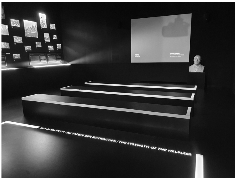
Fot. 2. „Sala kinowa” w sekcji „Narodziny nadziei” w CDP (widoczny napis na podłodze „Siła beznisłnych”), sierpień 2022

z dokumentami i przedmiotami, bazy danych z ekranami dotykowymi, światła audio w słuchawkach, kompozycje zdjęć, wreszcie instalacje artystyczne (obecność dzieł sztuki, w tym stworzonych specjalnie na potrzeby wystawy, jako szczególnie ważnych elementów budujących jej znaczenia, wyróżnia CDP spośród polskich muzeów historycznych). Dla przykładu artyści Grzegorz Hańderek i Michał Libera zaaranżowali tu przestrzeń, która poprzez niepokojącą ścieżkę dźwiękową ma ewokować opresyjny charakter socjalistycznego blokowiska (instalacje Blok i Grand Ensemble ). W ogólności prezentacja tego okresu została oparta na zestawieniu entuzjazmu dla działań Solidarności i niedoborów występujących na rynku, niepokojów i napięć społeczno-politycznych, typowych dla początku lat osiemdziesiątych. W rezultacie cała sekcja, stosunkowo oszczędna, a na pewno nieprzeładowana informacjami, w zrównoważony sposób oddaje zarówno pełen nadziei karnawał Solidarności, jak i ówczesne problemy polskiego społeczeństwa; nadzieja okazuje się więc „nadzieją mimo trudności”, jeśli nie mimo wszystko. To, w jaki sposób ta część wystawy jest pomyślana, wytwarza szczególną temporalność nadziei: zwiedzający są świadkami „narodzin nadziei” (strajki