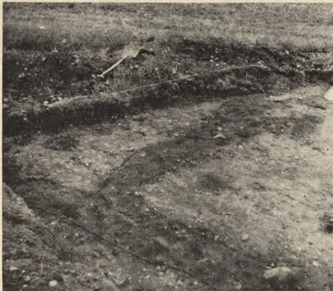
Ryc. 2. Siciny, pow. Góra. Rzut poziomy systemu rowów na działce nr XIII