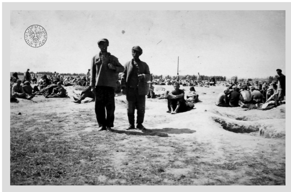
2. „Zwei Zivilisten” („Dwaj cywile”); AIPN, BU 2972/65, Album SA-Oberscharführera A. Popoffa, s. 40