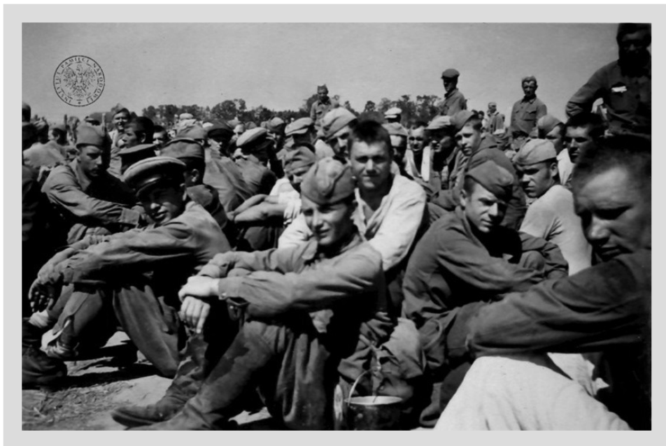
1. Prostken 1941, Erholungspause bei d. Kgf. (Prostki 1941, Przerwa na odpoczynek jeńców); AIPN, BU 2972/65, Album SA-Oberscharführera A. Popoffa, s. 26

W głębi Rzeszy aż 12 obozów dla Rosjan (Russenlager) ulokowano na poligonach, aby ograniczyć możliwości obserwacji jeńców przez ludność cywilną 23 . Pole o wielkości 30 ha ogrodzono dwoma pasami drutów kolczastych 24 , a następnie podzielono na cztery części i 24 sektory. Obóz szybko się zapełnił, gdyż początkowo był usytuowany stosunkowo blisko frontu. Posiadał też dogodne połączenia kolejowe i drogowe. W czerwcu w obozie przebywało kilkuset jeńców, ale w lipcu pojmاني byli już liczeni w tysiącach. Latem i jesienią 1941 r. w obozie mogło przebywać ok. 15 tys. więźniów. Zdaniem lekarza obozowego apogeum miało nastąpić w sierpniu, gdy liczba jeńców dochodziła do 30 tys. 25