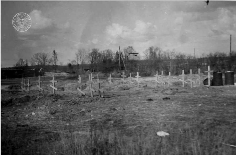
7. „Kgf. «Friedhof»” („Cmentarz jeniecki”) (1941); AIPN, BU 2972/65, Album SA-Oberscharführera A. Popoffa, s. 83