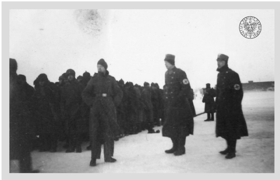
6. „Februar 1942. Der Rest der Kgf. Wird abtransportiert!” („Luty 1942. Reszta jeńców zostaje odesłana!”)

numerami 17000–18349 49 . Oflag 63 był mniejszym obozem, więc można przypuszczać, że większość stanowili jeńcy Oflagu 56. Jeńcy zostali zarejestrowani, otrzymując tamtejsze numery obozowe. Istnienie tego transportu jeńców potwierdza specjalna pieczętka na kartach obozowych: „23.9.41, an M-St-L.304(1VH) vom Oflag 56” [„23 września 1941 do obozu dla szeregowców i podoficerów 304 (1VH) z obozu dla oficerów 56”].