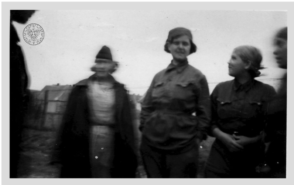
8. „Die Heldinen d. Sowjets.” („Bohaterki sowjetów”), czerwoarmistki w Oflagu 56; AIPN, BU 2972/65, Album SA-Oberscharführera A. Popoffa, s. 62

Dwa zdjęcia wartownika ukazują niewielką grupę czerwoarmistek, inne „Żyda”, jeszcze inne „komisarza” 56 . Grupy te nie są obecne w próbie. Nie ma też więźnych do niewoli Polaków czerwoarmistów, których zeznania można odnaleźć w archiwum Głównej Komisji Badania Zbrodni Hitlerowskich w Polsce (dziewięć osób) 57 . Niemieccy autorzy wskazują na rozproszenie źródeł pozostałych w rosyjskich archiwach.