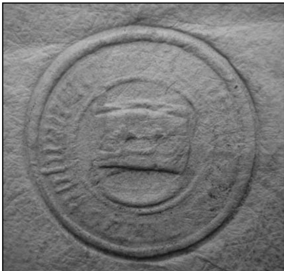
1. Pieczęć na pozwie Kazimierza Jagiellończyka z 1469 r.