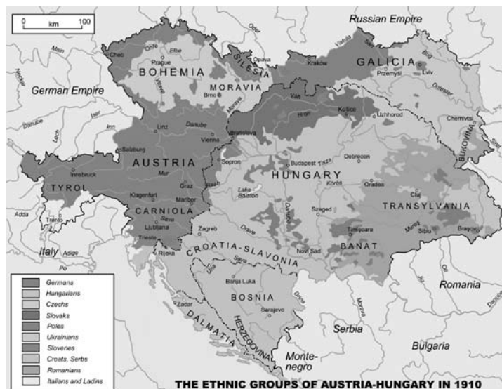
Mapa 1. Austro-Węgry 1910 r.

Źródło: plik: Austria-Hungary ethnic.svg., autor: Andrei Nacu (własność publiczna), upload. wikimedia.org/wikipedia/commons . Based on „Distribution of Races in Austria-Hungary” from the Historical Atlas by William R. Shepherd, 1911.