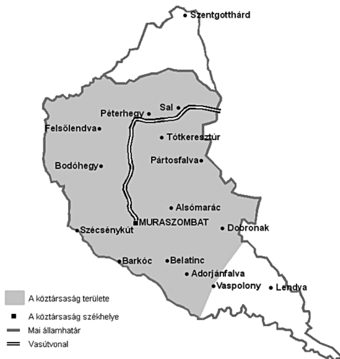
Mapa 4. Porabje (powiat Szentgotthárd) i Prekmurje, z zaznaczonym terenem Republiki Murckiej