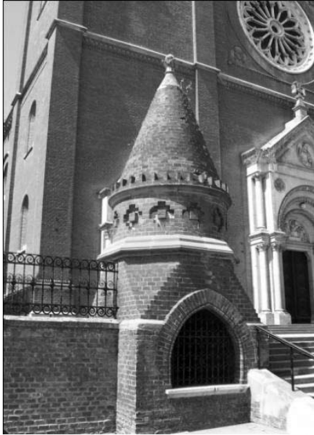
Fot. 1, 2. Katolicka Katedra Św. Piotra w Đakovie: wejście główne i ołtarz z posągami Świętych Cyryla i Metodego