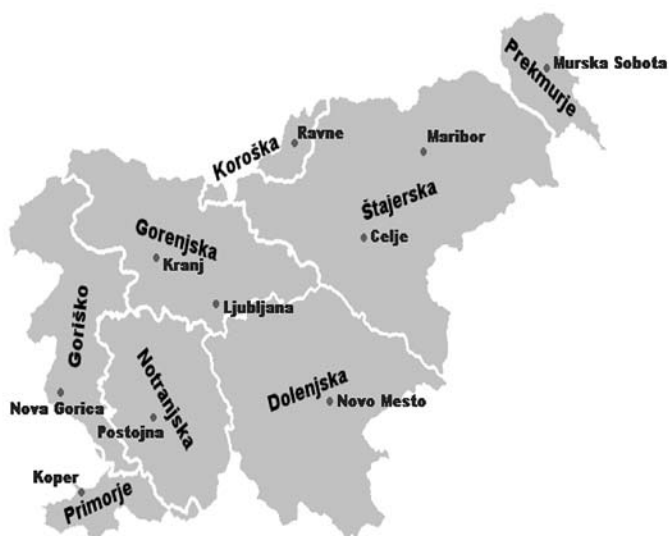
Mapa 2. Krainy historyczno-geograficzne Słowenii

Źródło: Anketa: Kakšno razdelitev na pokrajine si Slovenci želimo? , „Večer” 18.05.2008.