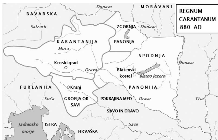
Mapa 3. Księstwa słowiańskie tworzące Królestwo Karantanii (ok. 880 r.) 15