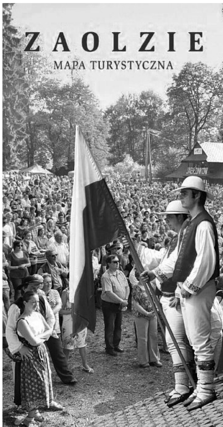
Okładka polskojęzycznej mapy Zaolzia wydanej w ramach projektu „Zaolzie teraz – Zaolződnes” realizowanego przez Książnicę Cieszyńską i Kongres Polaków w Republice Czeskiej