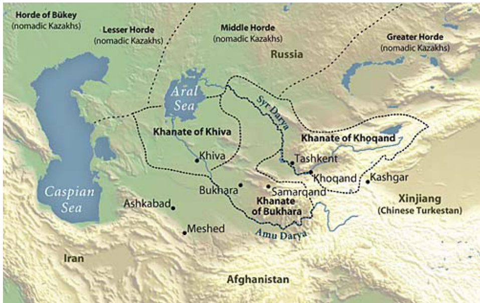
Mapa 1. Azja Centralna około 1815 roku