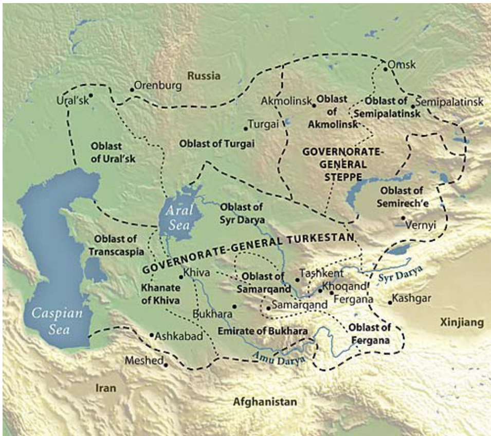
Mapa 3. Azja Centralna w czasach Imperium Rosyjskiego