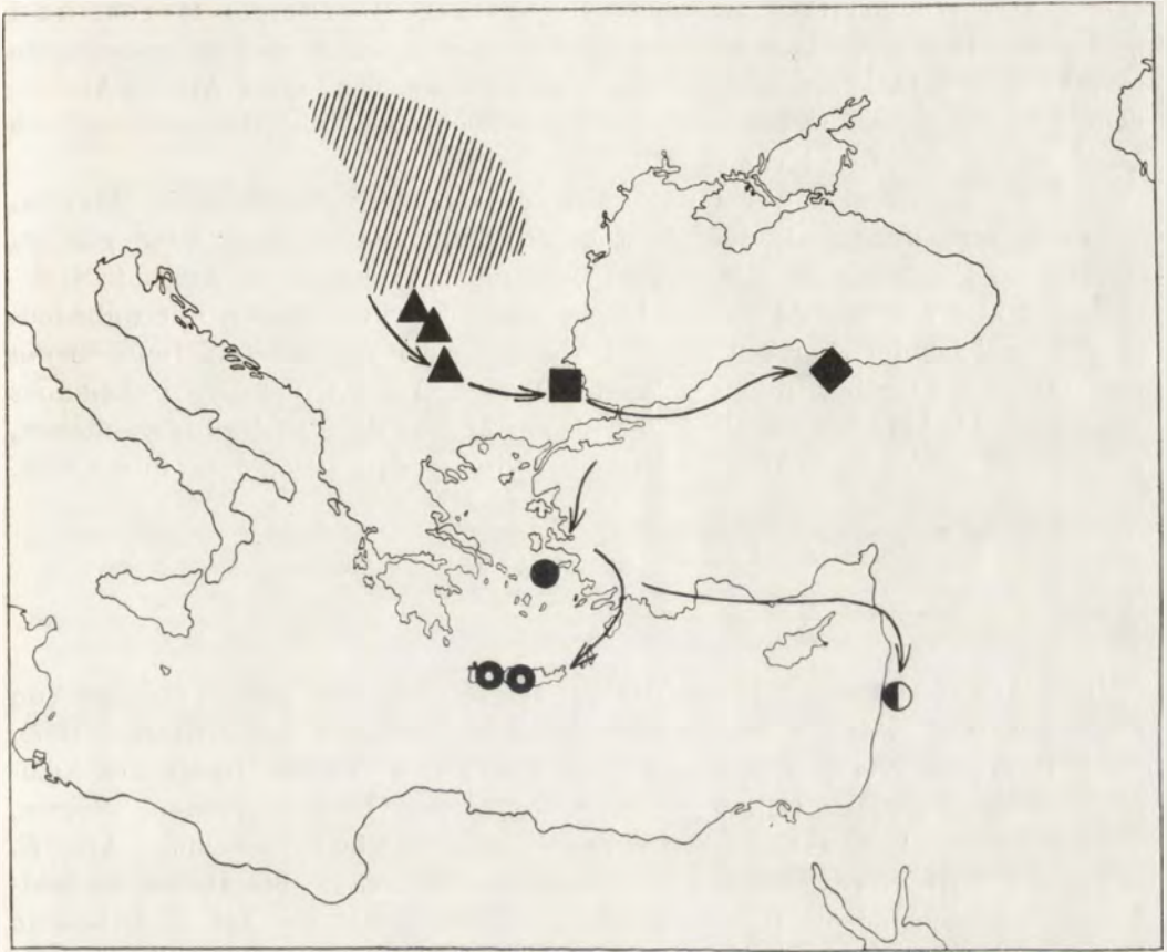
Karte 5. Entwicklungszentrum (in Karpaten) der Gattung Carpathica A. J. WAGNER (gestreiftes Gebiet) und die Richtungen ihrer südöstlichen Expansion: ▲ – südliche Fundorte von C. stussineri (A. J. WAGNER), ■ – C. bielawskii RIEDEL, ◆ – C. amisena (FORCART), ● – Libania aff. sauleyi (BOURG.), ◐ – L. sauleyi (BOURG.), ◑ – L. cretica (FORCART).

miozän-pliozäne Halbinsel des südwestlichen Kleinasien ankam. In Zukunft finden wir in der Ägäisregion gewiss noch andere Aufenthaltsstellen der Schnecken aus der Gattung Libania BOURG.