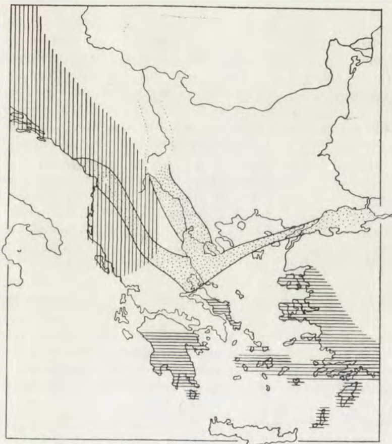
Karte 2. Die Areale der Gattungen Aegopis FITZ. (senkrecht gestreift) und Zonites MONTF. (waagrecht gestreift). Der annähernde Verlauf des transägäischen Tertiärgrabens und des Vardar-Grabens (nach FURON) wurde durch Punktierung angedeutet.

Die Scheidung der Areale von Aegopis FITZ. und Zonites MONTF. scheint darauf hinzuweisen, dass diese konchyologisch so nahen und sich in den Biozönosen gegenseitig gewiss vertretenden Gruppen sich während des Bestehens