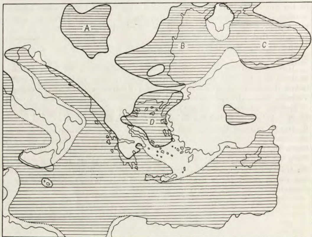
Karte 4. Ägäischer Raum im Pontien (nach FURON, 1950, Abb. 4 – ein vergrößerter Ausschnitt). A – Pannonisches Becken, B – Dazisches Becken, C – Euxinisches Becken, D – Ägäisches Becken.

den mit dem festländischen Griechenland, das seinerseits Anschluss an die Dinaridenkette bekam. Zwischen diesen Armen befindlicher Teil des alten transägäischen Grabens wurde abgeschnitten und in ein geschlossenes, ziemlich ausgedehntes ägäisches Becken verwandelt; im Westen blieben kleinere Seen in Epirus erhalten. Vom Ostteil der über die Kykladen und Sporaden führenden Landbrücke ab lief eine nach Südwest vorgeschobene Halbinsel, welche über Rhodos, Karpathos und Kasos bis nach Ostkreta reichte. Westkreta ruhte noch im Meer (FURON, 1950: 144–145, Karte 4; FURON, 1953; RIEDEL, 1968).