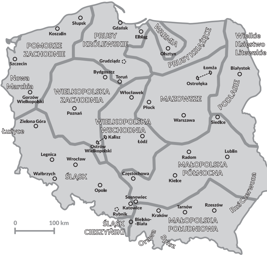
Ryc. 1. Uproszczony podział Polski na kraje historyczne Simplified division of Poland into historical provinces

Opracowanie własne na podstawie / Author's elaboration based on: Piskozub (1987); Kostarczyk (1997); Zaborowski (2013).