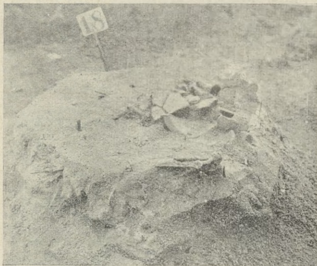
Ryc. 1. Okołowice, pow. łaski Grób jamowy nr. 18a. — Fig 1. Okołowice, arrondt. de Łask. Tombeau à fosse Nr. 18a.

Inwentarz grobu 18a uzupełnia znaleziona w nim żelazna zapinka z zawiniętą nóżką, wyko-