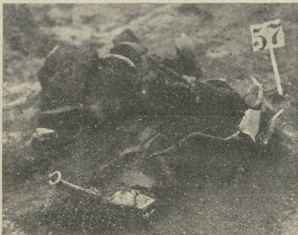
Ryc. 3. Okołowice, pow. łaski. Grób jamowy nr. 57. — Fig. 3. Okołowice, arrondt. de Łask. Tombeau à fosse no 57.

1. Duża asymetryczna waza, o silnie wyдутym brzuścu, łagodnie zaokrąglonym, przechodzącym ku dołowi w stożkową silnie zwężającą się część dolną naczynia. Szyjka niska cylin-