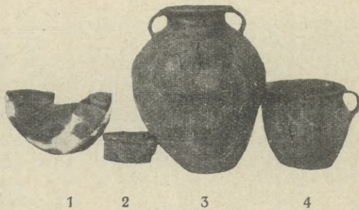
Ryc. 4. Okołowice, pow. łaski. Naczynia z grobu jamowego nr. 57. — Fig. 4. Okołowice, arrondt. de Łask. Vases du tombeau à fosse no 57.

Ściany boczne rozchylają się lekko od dna ku górze. Krawędź zgrubiała jest wygięta, i od dołu ukośnie ścięta. Na szerszej, a krótszej, bocznej ścianie naczynia, poniżej krawędzi, przy-mocowane jest małe taśmowe ucho, zwężone