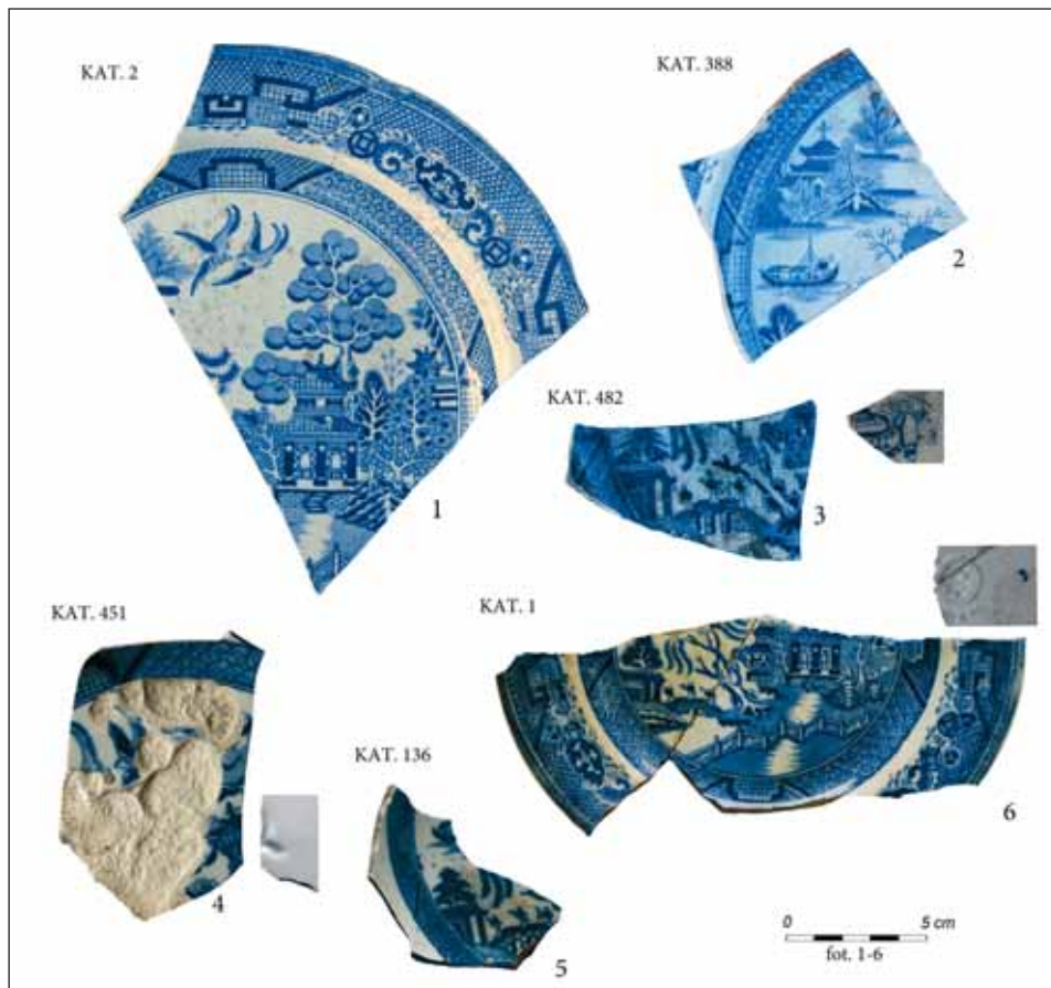
Ryc. 2. Angielskie talerze z dekoracją Willow , naczynia z badań archeologicznych w Gdańsku: 1, 6 — przy ul. Górka/Rogaczewskiego; 2-4 — przy ul. Sadowej; 5 — przy Pl. Stoczniovym.