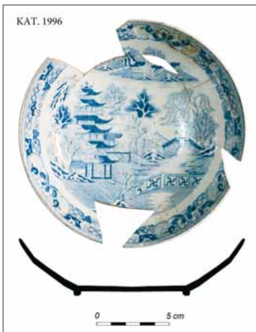
Ryc. 7. Angielski spodek z dekoracją Two Temples II , z pierwszej połowy XIX w., z badań archeologicznych przy ul. Wałowej w Gdańsku.

Na mapie miast południowego Bałtyku Gdańsk był jednym z większych odbiorców fajansów angielskich 34 oraz ich głównym reeksporterem w głąb kraju. Niemniej jednak liczba wyrobów z nadrukiem w formie Willow lub z wariantami tego zdobienia jest w skali Gdańska marginalna i na pewno nie stanowiły one głównego nurtu importu fajansów angielskich. Głównym kierunkiem eksportu z Anglii tak dekorowanych naczyń była Ameryka Północna 35 . Świadczą o tym liczne egzemplarze znajdujące podczas badań archeologicznych, a także całe zasta-