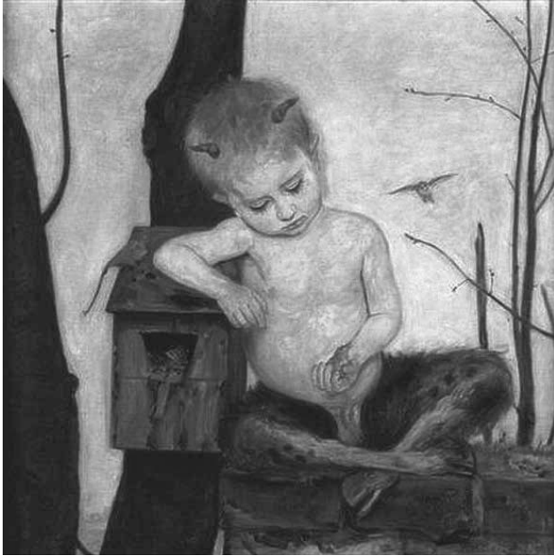
Wlastimil Hofman, Wiosna (1918), Muzeum Narodowe w Krakowie