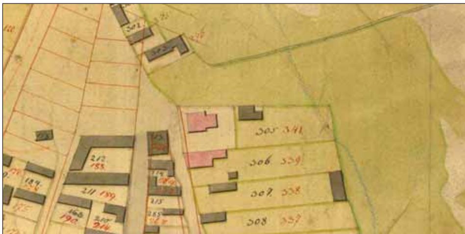
Ryc. 2. Fragment planu J. Bernharda z 1823 r. z posesją szpitala-przytułku św. Barbary (z nienaniesionym) nr 304. Oryginał w Archiwum Państwowym w Łodzi, zesp. 609, sygn. 184