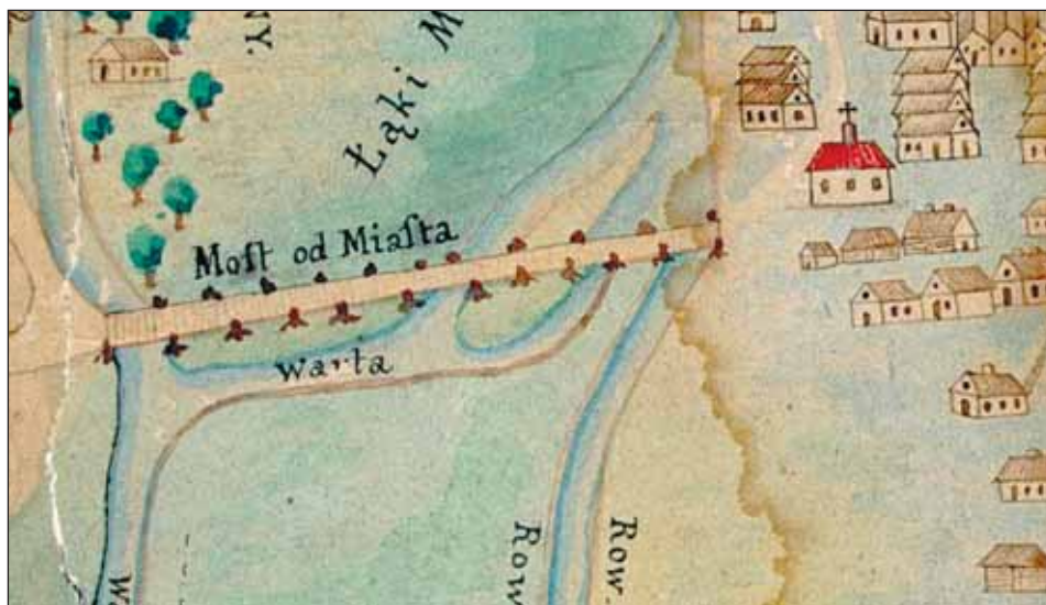
Ryc. 5. Fragment planu m. Częstochowy M. Germana z 1748 r. (wg wierzytelnej kopii S. Krajewskiego z 1889 r.), z przyszpitalnym kościołem św. Barbary oraz mostami na Warcie, widzianymi od północy. Oryginał w Archiwum klasztoru Jasna Góra, brak sygn.

Fig. 5. A fragment of M. German's street plan of Częstochowa from 1748 (after an authenticated copy made by S. Krajewski in 1889), showing St Barbara's church and the bridges over the Warta (viewed from the north). The original in AJG (the Archive of the Jasna Góra Monastery), no catalogue no.