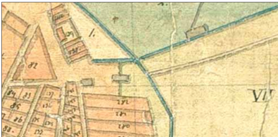
Ryc. 6. Fragment mapy F. Chądzyńskiego z 1819 r. z posesją szpitala-przytułku św. Barbary oraz rzeczką uchodzącą od północy do Warty. Oryginał w AGAD, zesp. 402, sygn. 340-27

Fig. 6. A fragment of F. Chądzyński's map from 1819, showing the plot of St Barbara's hospital poorhouse and a stream flowing into the Warta from the north. The original in AGAD (the Central Archives of Historical Records), set 402, catalogue no. 340-27