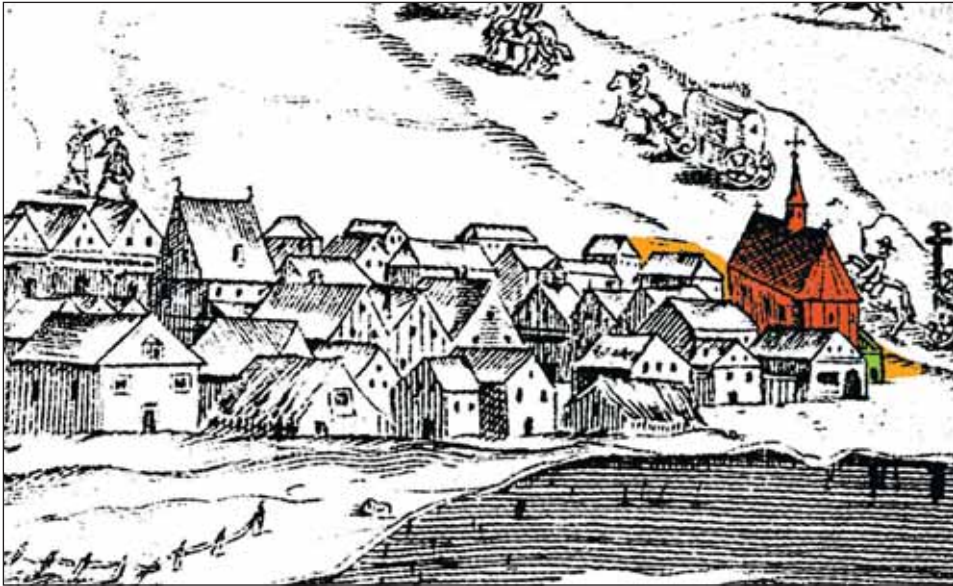
Ryc. 3. Szpital-przytułek św. Barbary (kolor zielony), kościół (kolor czerwony) oraz teren przykościelnego cmentarza (kolor pomarańczowy), oznaczone na fragmencie sztychu J.A. Gorczyńa z 1655 r. Oryginał w Muzeum Narodowym w Krakowie

Fig. 3. St Barbara's hospital-poorhouse (green), church (red) and cemetery (orange), marked in a fragment of J.A. Gorczyń's etching from 1655. The original in the National Museum in Cracow