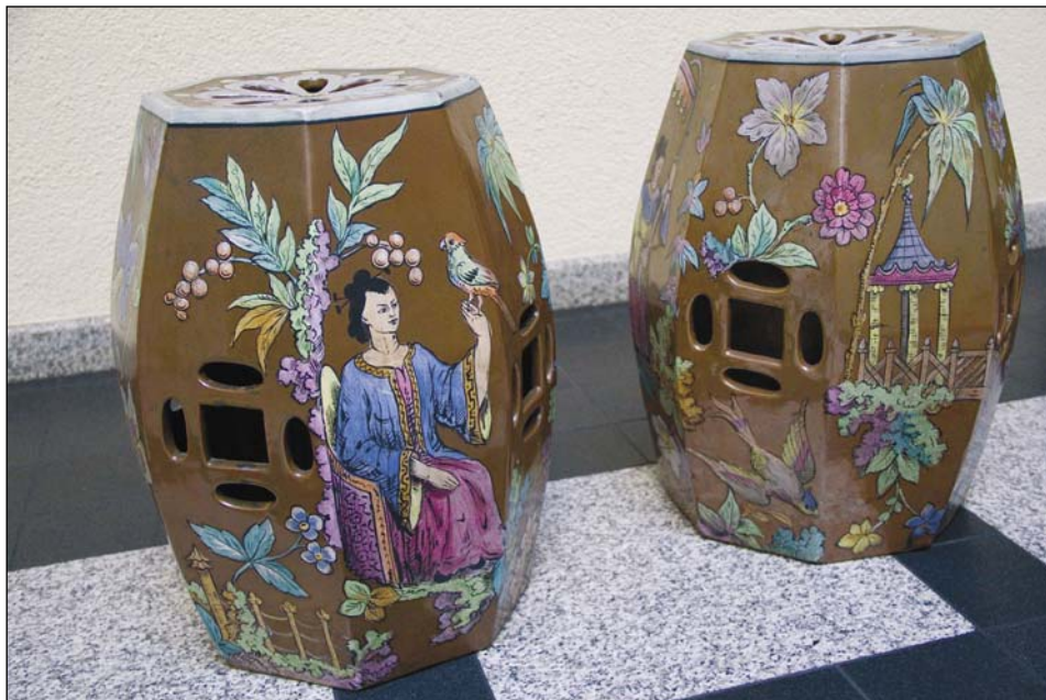
Ryc. 5. Taborety kamionkowe z Ćmielowa, w zbiorach Muzeum Mazowieckiego w Płocku