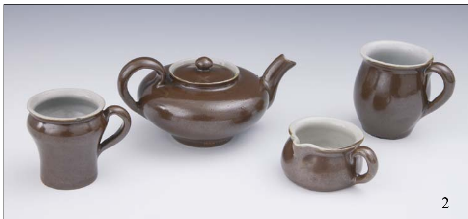
Ryc. 1, 2. Przykłady wyrobów kamionkowych z Ćmielowa, w zbiorach Muzeum Narodowego w Krakowie