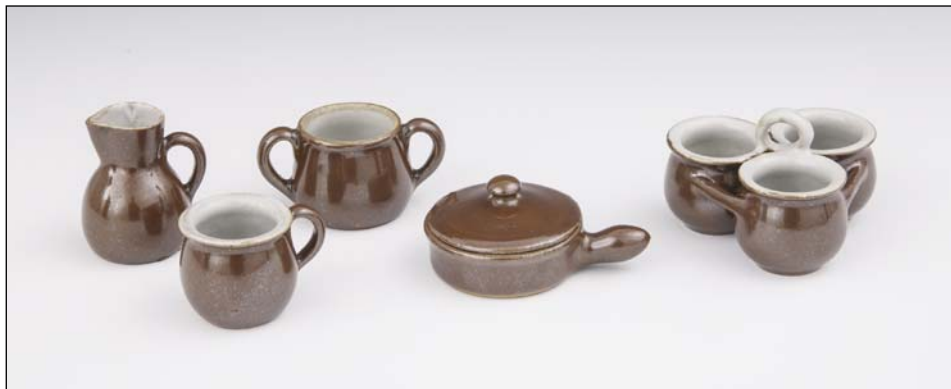
Ryc. 3. Naczynka do zabawy z Ćmielowa, w zbiorach Muzeum Narodowego w Krakowie