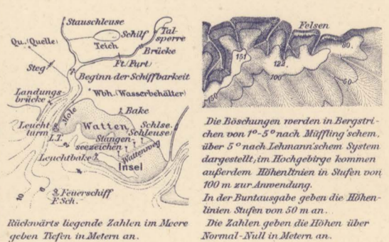
Die Böschungen werden in Bergstrichen von 1°-5° nach Mülling schem. über 5° nach Lehmannschem System dargestellt, im Hochgebirge kommen außerdem Eibenstrichen in Stufen von 100 m zur Anwendung. In der Punktangabe geben die Eibenlinien Stufen von 50 m an. Die Zahlen geben die Höhen über Normal Null in Metern an.