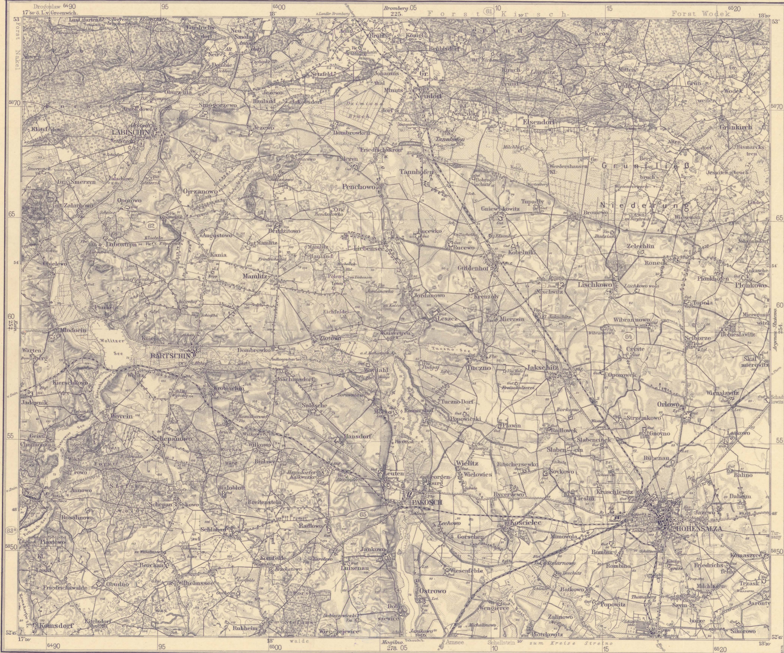
Karte des Deutschen Reiches. (1 cm Karte).