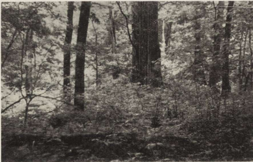
Рис. 1. Первичный ильмово-широколиственный долинный лес.