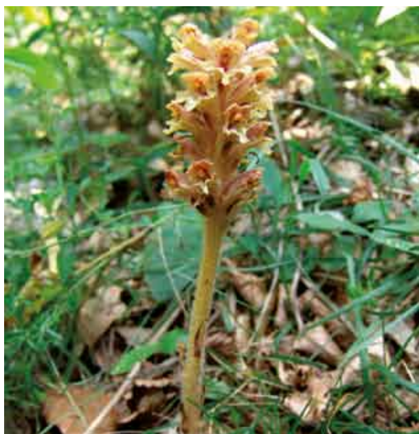
Fot. 202. Orobanche mayeri na Trzech Koronach w Pieninach (2009)

Bylina o wysokości (20)35–45(60) cm. Łodyga jasno-żółta, jasnobrązowa lub rzadko czerwonawa, pokryta dołem licznymi trójkątnymi łuskami, wyżej rzadkimi i lancetowatymi. Kwiatostan pojedynczy, kłosowaty, licznokwiatowy, górą gęsty, dołem rozluźniony. Kielich złożony z dwóch 2-zębnych działek, najczęściej niezrosniętych z przodu. Kwiaty siedzące w kątach przysadek podobnych do górnych łusek łodygowych. Korona (15)16–17(19) mm długa, żółtawa, jasnobrązowa, różowa, rzadko czerwonawa lub czerwono żyłkowana, na linii grzbietowej równomiernie łukowato zgięta. Pręciki przyrośnięte (2)3–5 mm powyżej nasady rurki korony, nagie lub rzadko gruczołowato owłosione. Szyjka słup-