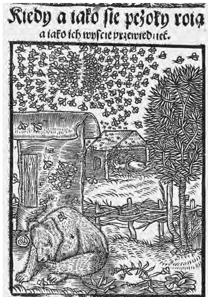
Il. 15. H. Spiczyński, O ziołach tutecznych i zamorskich , 1556, k. 146r; BN, SD XVI.F.32

naturalnemu zużyciu, co pokazuje drzeworyt przedstawiający grupę bydła, który w Ogrodzie zdrowia z 1542 r. jest ujęty kompletną ramką, a w Księgach o gospodarstwie ma poważny ubytek w górnej listwie 47 . Jednak niektóre klocki musiały pojawić się w Krakowie już z bardzo niekompletnymi ramkami, czego przykładem jest wizerunek osła 48 . Analogicznym przypadkiem wydaje się klocek z lwem, przy czym jego obecność w serii sugeruje, że cała ta grupa nie była pomyślana jako zestaw ilustracji Ksiąg o gospodarstwie .