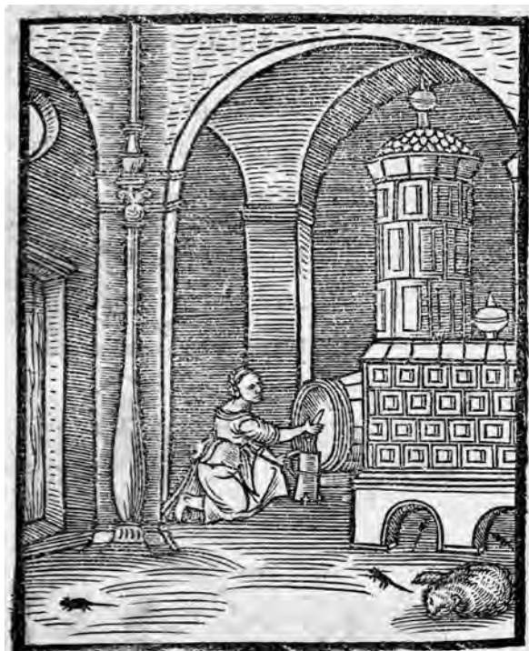
Il. 3. P. de' Crescenzi, Księgi o gospodarstwie , szp. 361; BN, SD XVI.F.10, fot. POLONA