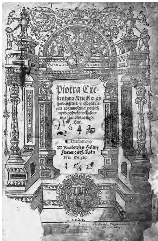
Il. 11. P. de' Crescenzi, Księgi o gospodarstwie, k. A;r; BJ, Cim. F 8143