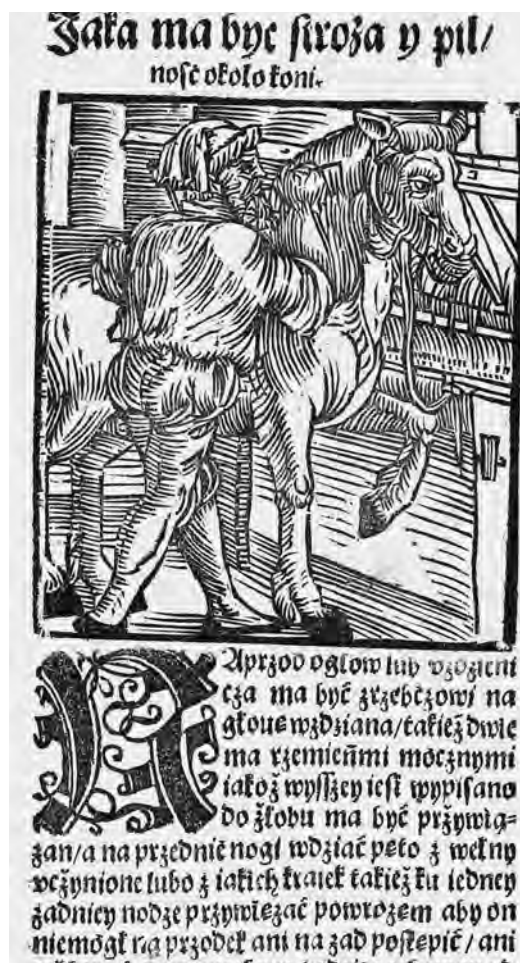
Il. 16b. P. de' Crescenzi, Księgi o gospodarstwie , szp. 516; BN, SD XVI.F.10, fot. POLONA

murem. Z kolei rozdziały Jako się pszczoły rodzą (szp. 594), Jako pszczoły dobre poznać na kupienie, a jako ich szukać (szp. 594/595) i Kiedy a jako się pszczoły roją, a jako ich wyście przewidzieć zostały zilustrowane przedstawieniem niedźwiedzia oblizującego łapę – zapewne z miodu, o czym świadczy widoczna w tle pasieka, nad którą unosi się rój pszczół (il. 15).