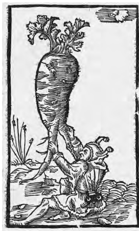
Il. 5b. P. de' Crescenzi, Księgi o gospodarstwie , szp. 251; BN, SD XVI.F.10, fot. POLONA