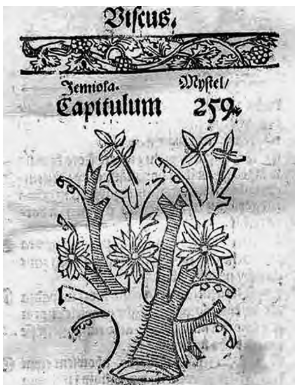
Il. 9a. H. Spiczyński, O ziołach tuteicznych i zamorskich , 1542, k. 96r; BJ, Cim. F 8268, fot. Jagiellońska Biblioteka Cyfrowa