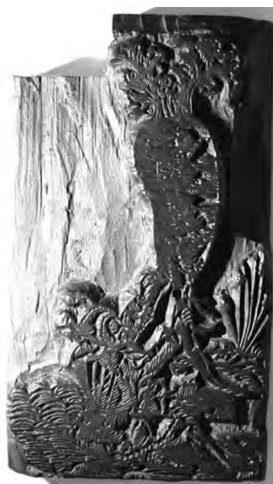
Il. 5d. Klocek w Muzeum Uniwersytetu Jagiellońskiego Collegium Maius w Krakowie, M 1994