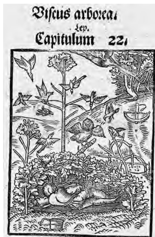
Il. 9b. H. Spiczyński, O ziołach tuteicznych i zamorskich , 1542, k. 115v; BJ, Cim. F 8268, fot. Jagiellońska Biblioteka Cyfrowa