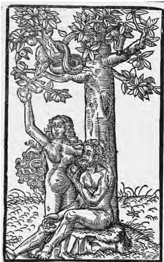
Il. 6. P. de' Crescenzi, Księgi o gospodarstwie , szp. 381; BN, SD XVI.F.10