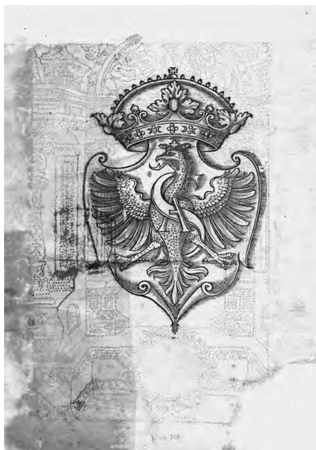
Il. 13. P. de' Crescenzi, Księgi o gospodarstwie , k. A 1 v; BJ, Cim. F 8143, fot. Jagiellońska Biblioteka Cyfrowa