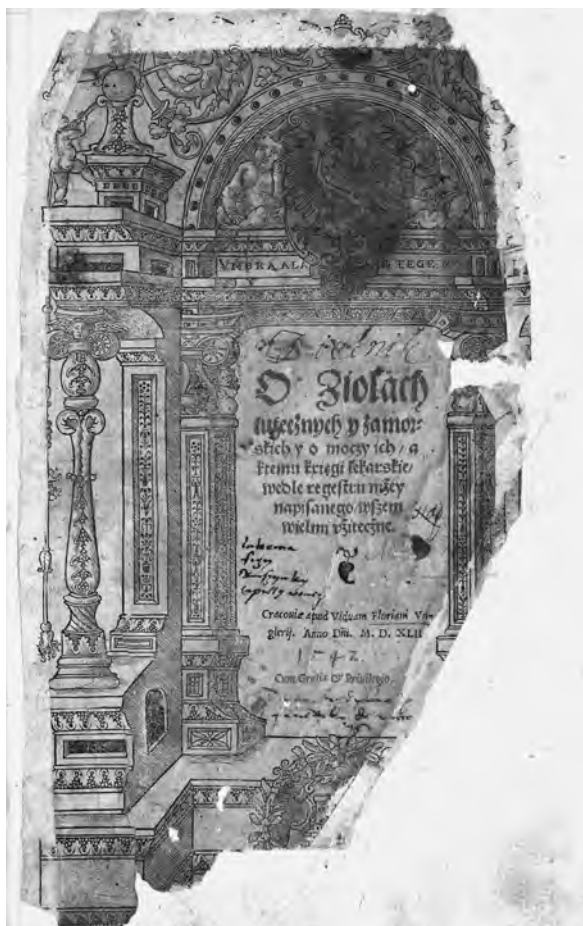
Il. 10. H. Spiczyński, O ziołach tutecznych i zamorskich , 1542, k. A;r; BCzart., III 1717, fot. Cyfrowe Muzeum Narodowe w Krakowie