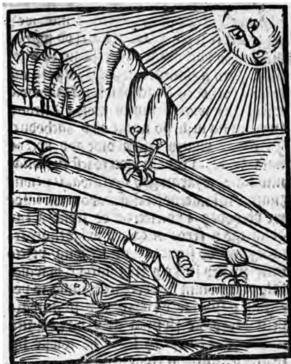
Il. 1. P. de' Crescenzi, Księgi o gospodarstwie , szp. 6; BN, SD XVI.F.10