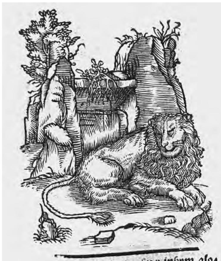
Il. 14. H. Spiczyński, O ziołach tutecznych i zamorskich , 1556, k. 146r; BN, SD XVI.F.32

rozmiarów i stylu ze scenami znanymi ze składek A–Q Krescentyna, co zdaje się potwierdzać domniemanie, że wszystkie te matryce pochodzą z jednego źródła, a Unglerowa pozyskała je równocześnie, przy czym tylko część zdążyła wykorzystać w 1537 r., gdy druk utknął w księdze szóstej Krescentyna, części zaś po raz pierwszy użyła dopiero w 1542 r., w Ogrodzie zdrowia . Jest zrozumiałe, że klocki z motywami zoologicznymi nie zostały użyte w składek A–Q Krescentyna, skoro zwierzęta są omawiane dopiero poczynając od księgi ósmej.