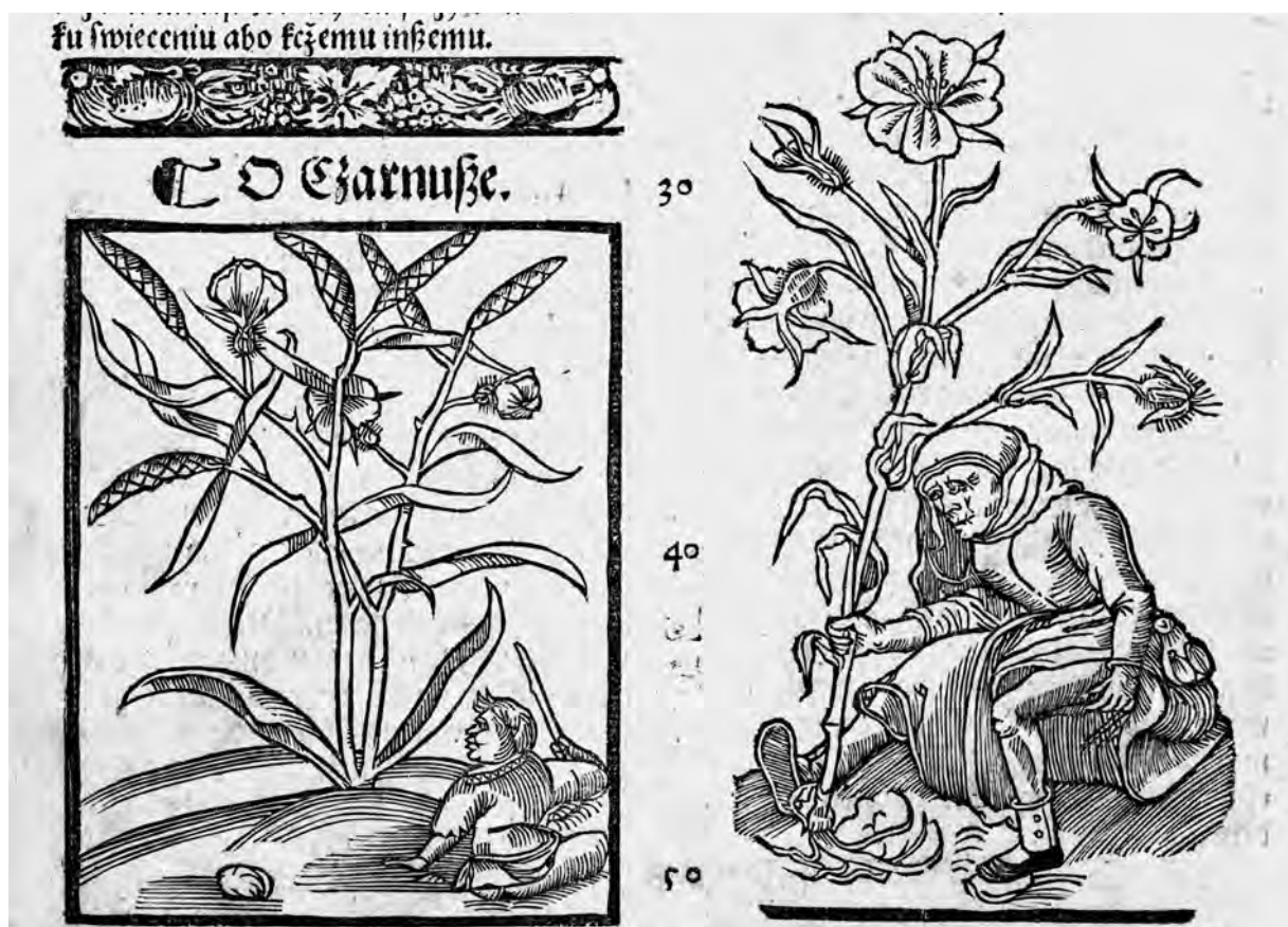
Il. 4. P. de' Crescenzi, Księgi o gospodarstwie , szp. 191–192; BN, SD XVI.F.10

praktyka umieszczania identycznej ryciny jako wizerunku różnych gatunków roślin była, jak wspomniano na wstępie, powszechna w latach 30. XVI w. Na szczególną uwagę zasługuje jednak przypadek, w którym przed powtórny użyciem klocek poddano modyfikacji: przedstawienie błazna siedzącego na ziemi i trzymającego oburącz rozdwarzający się korzeń. W pierwszym wydaniu dzieła Krescentyna rycina ta towarzyszy najpierw opisowi rzodkwi, gdzie kompozycja jest ujęta w ramkę, w prawym górnym rogu widnieje obłok, a za postacią błazna – nakryty stół (il. 5a) 26 . Ten ostatni motyw jest jednak nieobecny w ilustracji, która pojawia się kilka stron dalej, przy rozdziale na temat rzepaku (il. 5b) 27 . Efektem usunięcia stołu jest mocniejsze wyeksponowanie sylwetki błazna, pierwotnie mało czytelnego na tle szrafowań obrusa. Trudno orzec, czy taką właśnie intencją kierowano się, decydując o korekcie klocka, ewidentnie jednak celem tego zabiegu nie było rozróżnienie dwóch gatunków roślin, bo akurat kształt korzenia pozostał niezmienny.