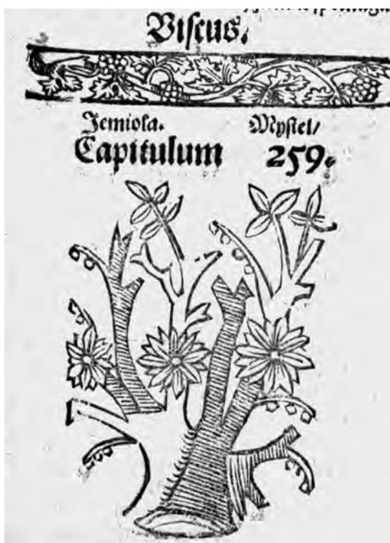
Il. 9c. H. Spiczyński, O ziołach tuteicznych i zamorskich , 1542, k. 96r; Biblioteka Diecezjalna w Sandomierzu, 41162