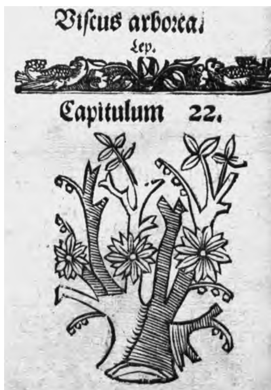
Il. 9d. H. Spiczyński, O ziołach tuteicznych i zamorskich , 1542, k. 115v; Biblioteka Diecezjalna w Sandomierzu, 41162, fot. Anna Suhecka