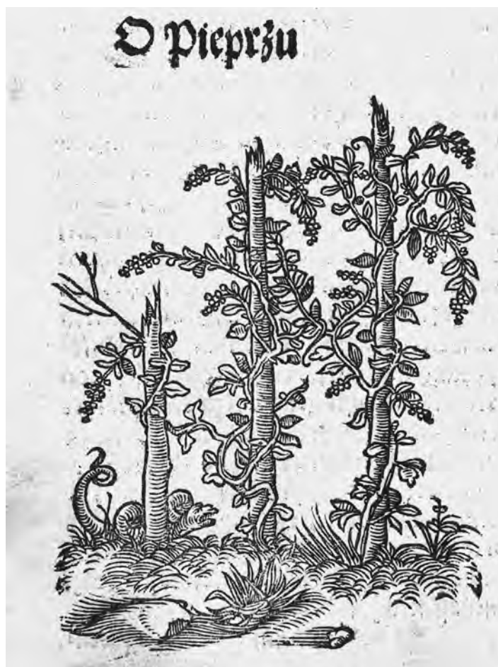
Il. 18. P. de' Crescenzi, Księgi o gospodarstwie , szp. 444; BN, SD XVI.F.10

Wydaje się osobliwe, że Unglerowa – dysponując mniejszymi matrycami, które pozwoliłyby zachować skład dwuszpaltowy – wykorzystała szersze matryce Unglera, co wprowadziło do publikacji kolejną niespójność, tym razem dotyczącą nie tylko repertuaru ilustracji, lecz całej ramy wydawniczej. Wytlumaczeniem użycia tylko jednej sceny o mniejszych rozmiarach nie jest przy tym stan zachowania serii, bo przetrwała ona w komplecie co najmniej do XVII w. 53