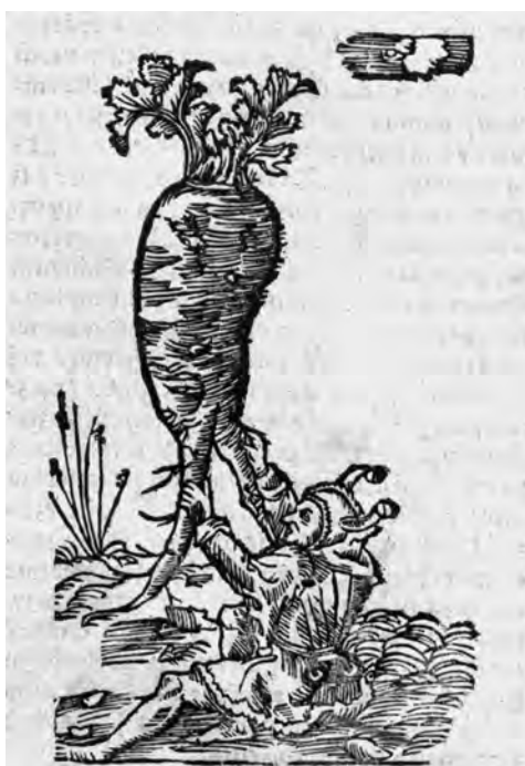
Il. 5c. P. de' Crescenzi, O pomnożeniu i rozkrzewieniu wszelakich pożytków , szp. 240; BN, SD XVI.F.172, fot. POLONA