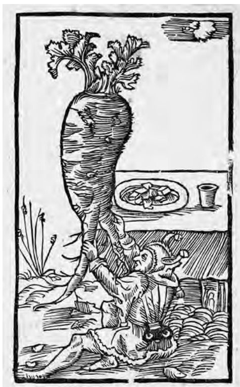
Il. 5a. P. de' Crescenzi, Księgi o gospodarstwie , szp. 230 [240]; BN, SD XVI.F.10