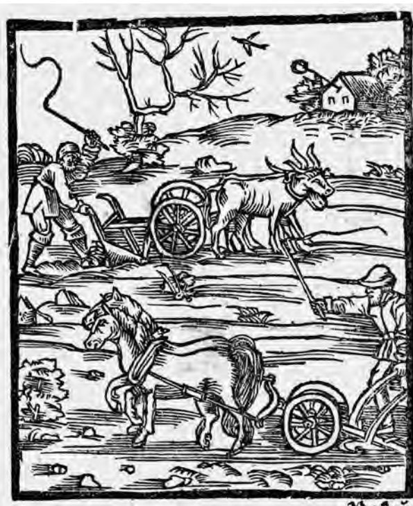
Il. 2. P. de' Crescenzi, Księgi o gospodarstwie , szp. 140; BN, SD XVI.F.10, fot. POLONA