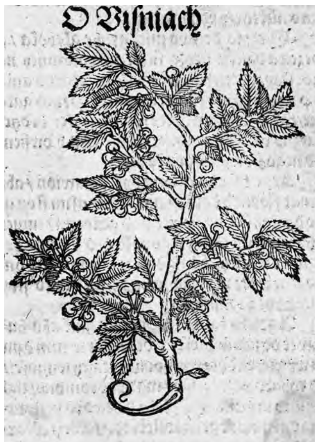
Il. 7. P. de' Crescenzi, Księgi o gospodarstwie , szp. 403; BN, SD XVI.F.10

scena pojawiała się także jako przedstawienie rzodkwi w kolejnych edycjach Ogrodów zdrowia 29 . Taki kształt matryca zachowała co najmniej do połowy XIX w., o czym świadczy odbitka w katalogu Józefa Muczkowskiego 30 . Później jednak utraciła narożnik, w którym znajdował się motyw obłoku, i w takim stanie – czwartym – przetrwała do dziś (il. 5d) 31 .