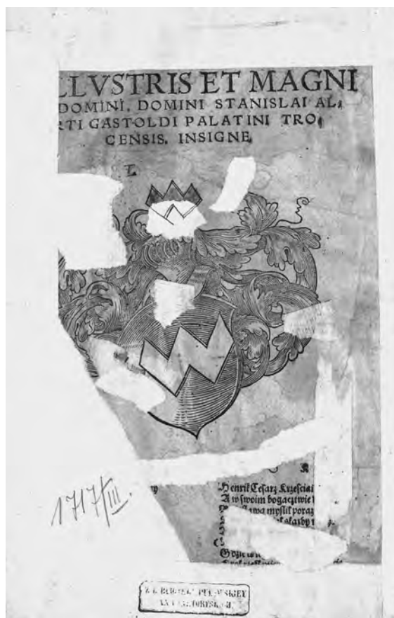
Il. 12. H. Spiczyński, O ziołach tutecznych i zamorskich , 1542, k. A 1 v; BCzart., III 1717, fot. Cyfrowe Muzeum Narodowe w Krakowie