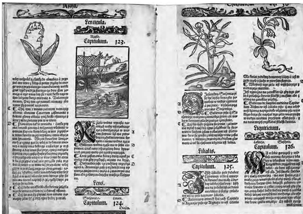
Il. 8. H. Spiczyński, O ziołach tutecznych i zamorskich , 1542, k. 49v–50r; BN, SD XVI.F.625

więcej niż raz, niekiedy wcale przemyślnie (np. scena sianokosów ilustruje rozdział na temat trawy, a wizerunek żdźbła owsa z dodatkowym motywem zajęcia powtarza się w dwóch rozdziałach: o owsie i o zajacu 38 ). Co ważniejsze, liczne nowo pozyskane klocki zostały poddane modyfikacjom, czego błazen z rzdokwią jest tylko jednym z wielu przykładów. W większości przypadków ingerencje ograniczały się głównie do eliminacji górnej i bocznych ramek. Niekiedy dochodziła do tego zmiana identyfikacji gatunku, jak w przypadku przedstawienia strączkowej rośliny, która u Krescentyna ilustrowała rozdział O czarnusze (il. 4), a u Spiczyńskiego powróciła bez górnej i bocznych ramek jako soczewica (il. 8).