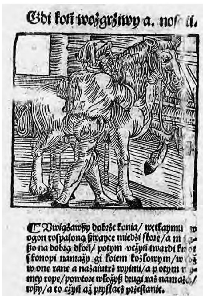
Il. 16a. Sprawa a lekarstwa końskie , k. B 1 v; Muzeum Narodowe w Krakowie, Muzeum im. Emeryka Hutten-Czapskiego; MNK VIII-XVI.1041, fot. Małopolska Biblioteka Cyfrowa