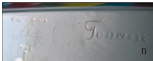
Ryc. 2 A–B. Lampa Tańczące kobiety , jedna z figur o najwyższej klasie artystycznej, projekt Wilhelm Thomasch. Brak na wystawie i w dokumentującym ją albumie. A — figura, fajans, wys. 62 cm, zbiory prywatne; B — sygnatury: z boku podstawy mały wycisk: Made in Poland , niżej wycisk z literą P w trójkącie, niżej słabo czytelny niewielki wycisk numeru 896 8 7. Obok wycisk owalnej pieczęci ze stylizowaną literą P i herbem Rogala i duży napis Tomasz .