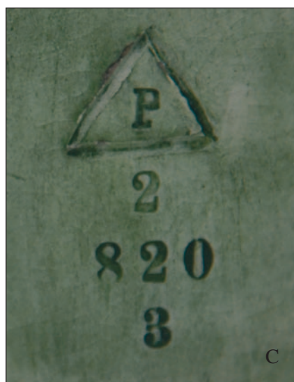
Fig. 3 A–C. A Woman with a Tambourine , one of the best figures made in Pacyków, reproduced on the title page of the Pacyków catalogue from 1928, absent from the current exhibition and catalogue. Title page of the cover of the Pacyków catalogue, in a private collection (A); the figure, faïence, h. 88 cm, in a private collection (B). Signature: on the back of the outer side of the base an impressed letter P in a triangle, below impressed small numbers: 2, below: 820, the lowest: 3 (C).

wystawy i dlatego powstała ona zbyt szybko, przy czym jej twórcom zabrakło doświadczenia w przygotowaniu prezentacji ceramiki. Wiele zabytków było uszkodzonych, a nawet nieprofesjonalnie naprawionych. Przykładem jest jedna z figur psa o niezbyt wysokiej jakości arty-