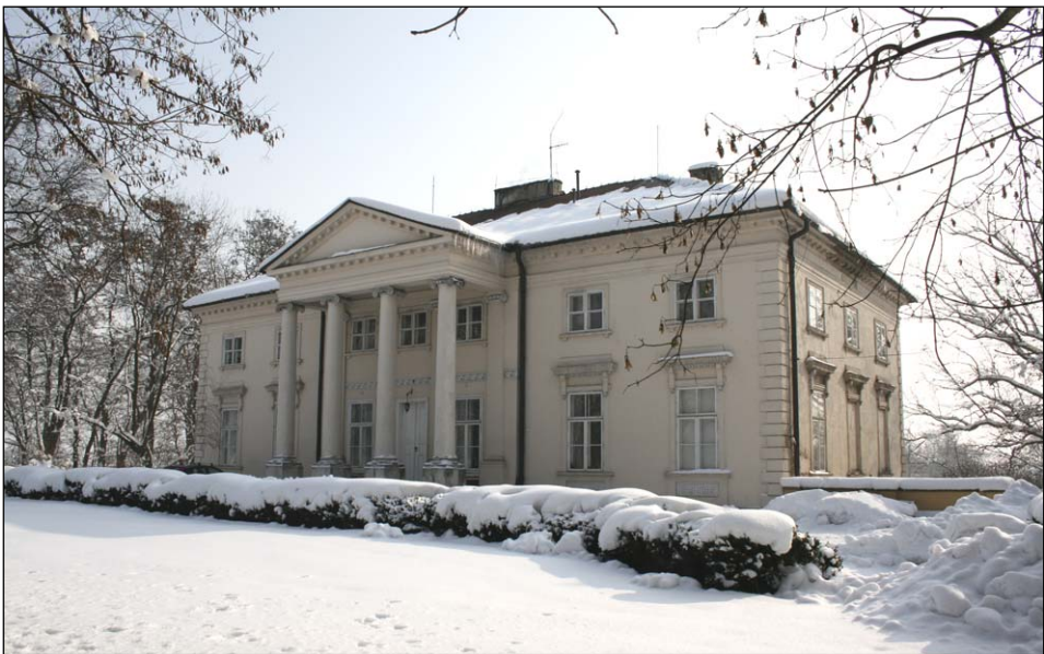
Ryc. 2. Pałac w Igołomi — widok od strony podjazdu.

okresie jej posiadania trudności w bywaniu w owej części swoich dóbr, która po Kongresie Wiedeńskim znalazła się w granicach zaboru rosyjskiego (przemieszkiwała wówczas najwięcej w Siedliszowicach w zaborze austriackim) 6 . Jeśli zatem igołomska rezydencja wzniesiona została przed końcem epoki napoleońskiej (raczej bowiem nie później), spośród domniemyanych