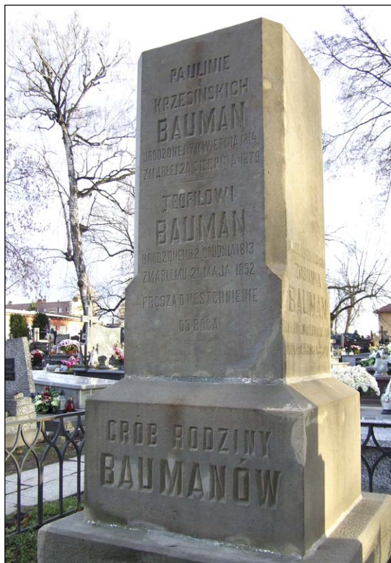
Ryc. 3. Grób rodziny Baumanów na Starym Cmentarzu w Przeworsku.