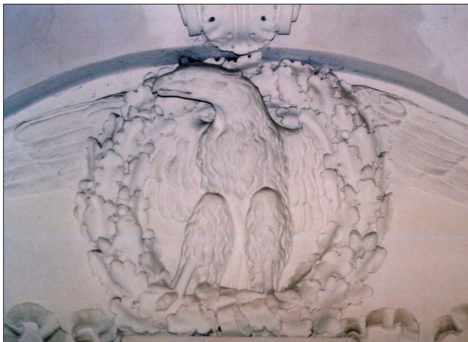
Ryc. 8. Napoleński orzeł nad kominkiem w Sali Balowej igołomskiego pałacu.