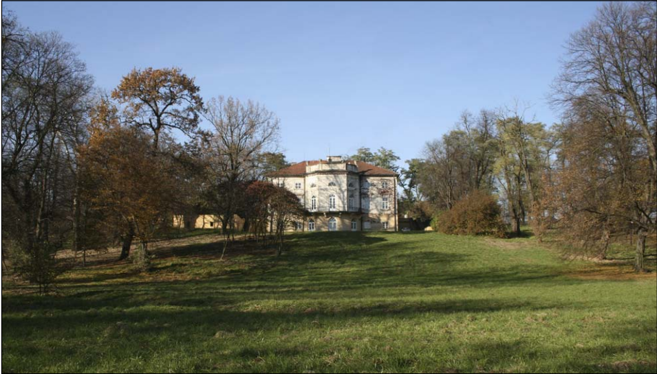
Ryc. 1. Pałac w Igołomi — widok od strony parku.