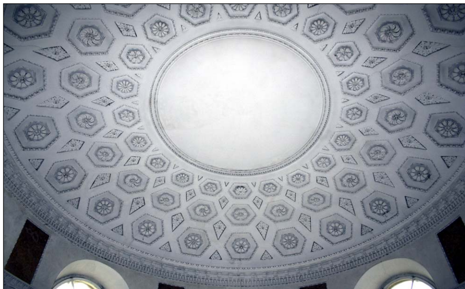
Ryc. 7. Plafon w Sali Balowej igołomskiego pałacu autorstwa F. Baumana.