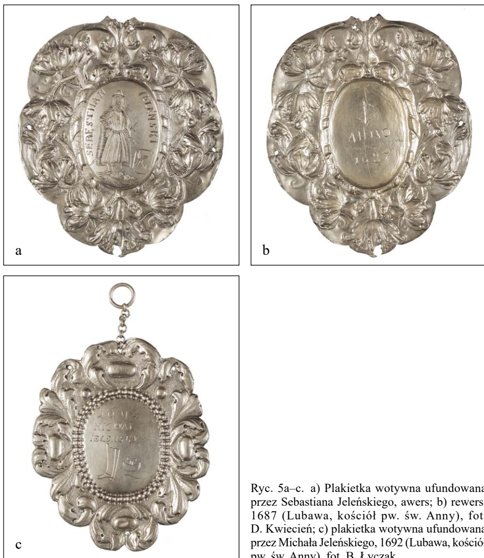
Ryc. 5a–c. a) Plakietka wotywna ufundowana przez Sebastiana Jeleńskiego, awers; b) rewers, 1687 (Lubawa, kościół pw. św. Anny), fot. D. Kwiecień; c) plakietka wotywna ufundowana przez Michała Jeleńskiego, 1692 (Lubawa, kościół pw. św. Anny), fot. B. Łyczak

Inne przedstawienie zawiera okrągła blacha z 1698 r. W jej centrum ukazano Franciscusa Freiwalta wraz ze znakami jego korporacji: dwoma butami i znanymi z wcześniejszych zabytków nożami szewskimi (ryc. 4b) 49 . Fundator dzieła wyobrażony został z gorejącym sercem w prawej dłoni, które przypuszczalnie oznaczać miało złożone przezeń wotum w takim