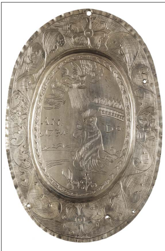
Ryc. 8. Plakietka wotywna ufundowana przez anonimowego krawca, 1731 (Lubawa, kościół pw. św. Anny)

tego rzemiosła. Z kolei na owalnej blasze, ofiarowanej przez anonimowego mistrza krawieckiego w 1731 r., ukazano scenę „Modlitwy w Ogrójcu” oraz charakterystyczny dla krawców motyw rozwartych nożyc z kwiatem (ryc. 8) 68 .