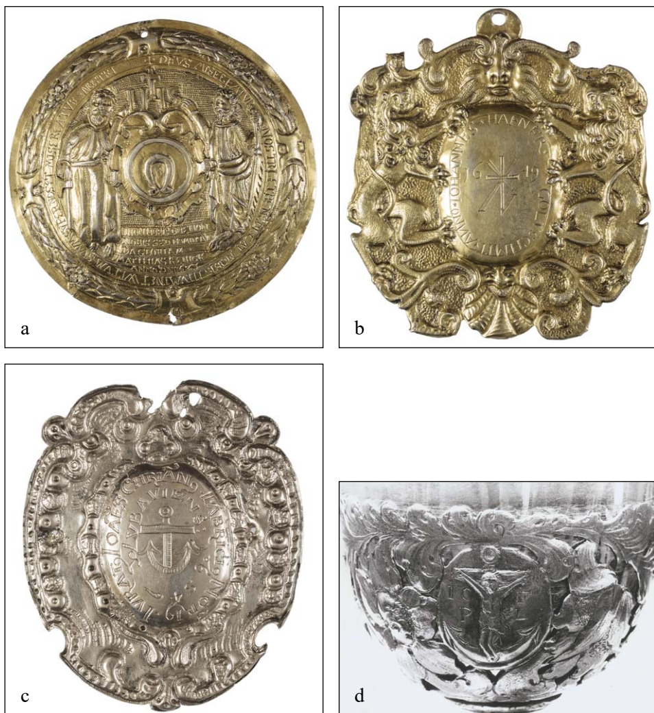
Ryc. 2a–d. a) Plakietka wotywna ufundowana przez Matthiasa Kenicka, 1623 (Lubawa, kościół pw. św. Anny), fot. D. Kwiecień; b) plakietka wotywna ufundowana przez Johannesha Hafnera, 1649 (Lubawa, kościół pw. św. Anny), fot. D. Kwiecień; c) plakietka wotywna ufundowana przez Johanna Christiana Fabriciusa, 1654 (Lubawa, kościół pw. św. Anny), fot. D. Kwiecień; d) koszynek czary zaginionego kielicha ufundowanego przez Johanna Christiana Fabriciusa, 1685 (Narodowy Instytut Dziedzictwa, Fototeka ODZ — złotnictwo, nr inw. 131503), fot. E. Marcjanik

Europy Środkowo-Wschodniej umieszczały w swoich godłach nie tylko wyroby piekarskie, lecz także uniwersalny znak. Kwestia ta wymaga dalszych badań.