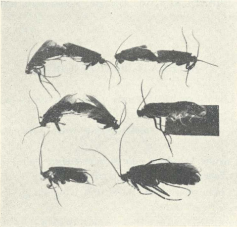
Abb. 4. Acrophylax vernalis Dziedz.

Selbst habe ich das Ausschlüpfen der Imagines von Acrophylax zerberus in der Tatra nicht beobachtet; doch stehen mir die Mitteilungen Dr. HRABÉ'S zur Verfügung, welcher am 6. VI. 1933 auf