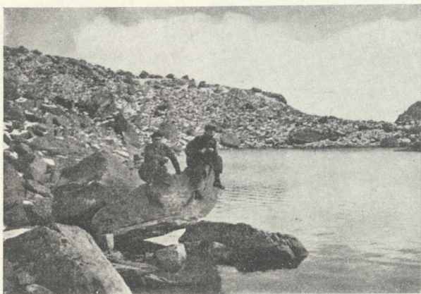
Abb. 2. Ob. Wahlenberg-See.

Nach der älteren Einteilung gehören diese Bäche zu den Bächen der Forellenzzone. In ihrem oberen Laufe fließt das Wasser