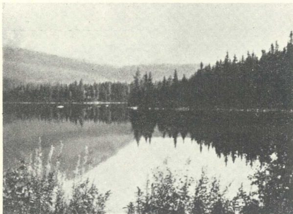
Abb. 1. Štrba-See.

Das Gebiet der Hohen Tatra gehört heute zweifellos zu den am besten durchgeforschten Teilen von Mitteleuropa. In den folgenden Zeilen, welche einige Ergänzungen zu meiner älteren Arbeit bringen, mache ich den Versuch, die Ergebnisse der Be-