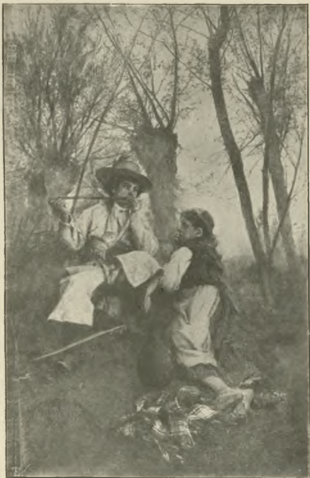
WITOLD PRUSZKOWSKI: SIELANKA. (Str. 49).