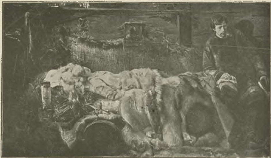
JACEK MALCZEWSKI: ŚMIERĆ ELENAI. (Str. 31 .