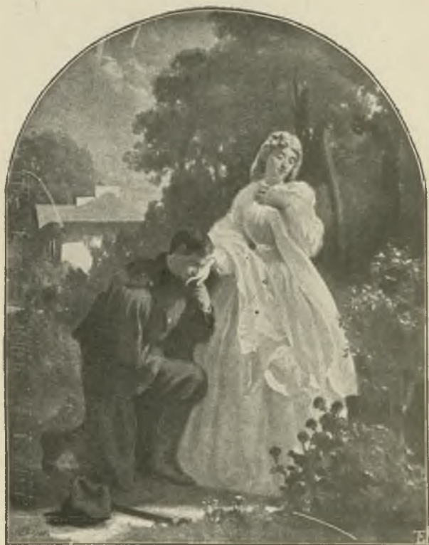
ARTUR GROTTER: POWITANIE. (Str. 18).