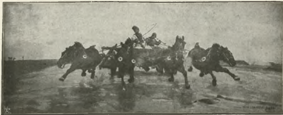
JÓZEF CHEŁMOŃSKI: CZWÓRKA. (Str. 9).