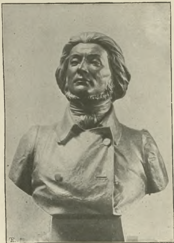
MARCELI GUYSKI: ADAM MICKIEWICZ. (St. 76).