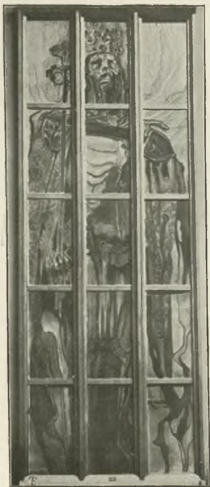
STANISŁ. WYSPIAŃSKI: KAZIMIERZ WIELKI. (Str 68)