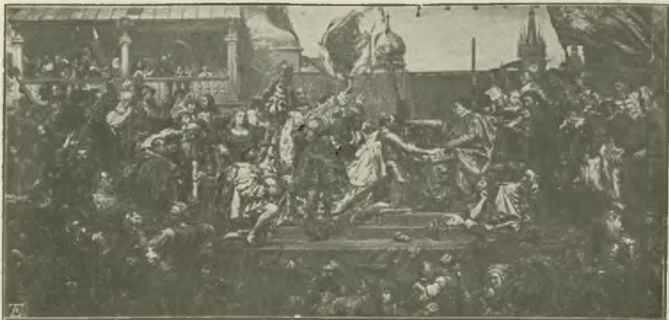
JAN MATEJKO: HOŁD PRUSKI. (Str. 35).