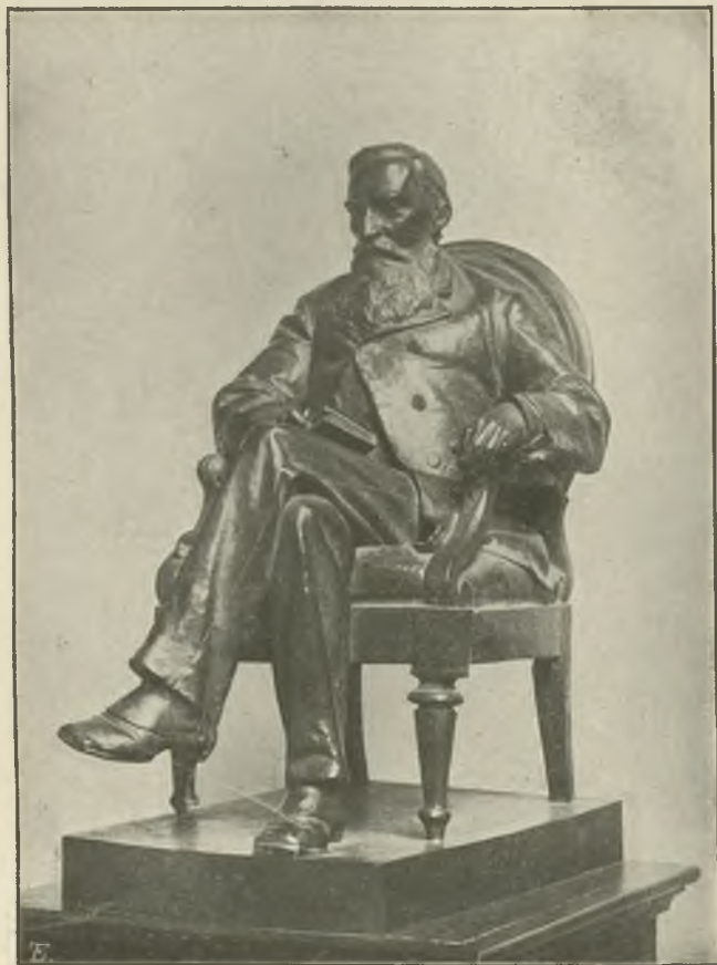
TEODOR RYGIEL: J. I. KRASZEWSKI. (Str. 80).