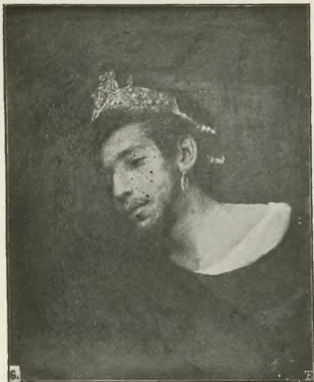
MAURCY GOTTLIEB: AHASVERUS. (Str. 16).