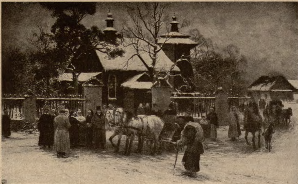
KOWALSKI WIERUSZ ALFRED