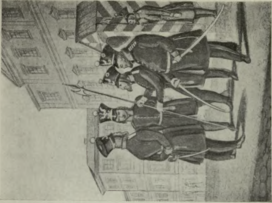
Gwardja Miejska Starozakonnych