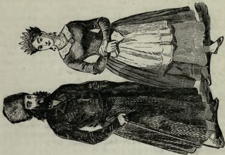
Misnagd-zachowawca z żoną