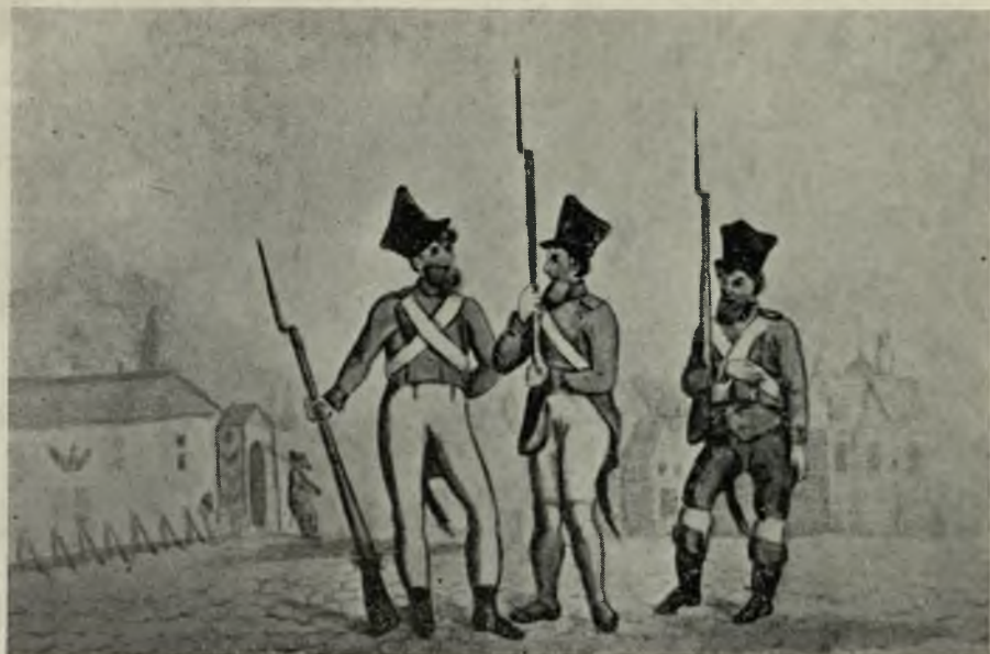
Żydzi — gwardziści miejscy

(według sztychu w zbiorach muzeum im. Bersohna).