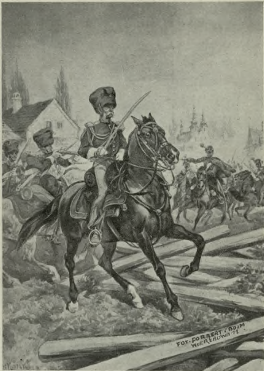
Berek Joselewicz (według akwareli Juliusza Kossaka w posiadaniu Zyd. Domu Akadem. w Warszawie).