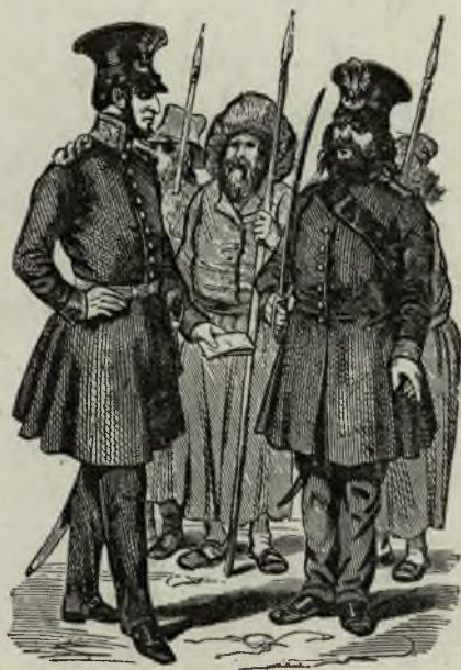
Typy z gwardji miejskiej starozakonnych.

(według sztychu w zbiorach muzeum im. Bersohna).