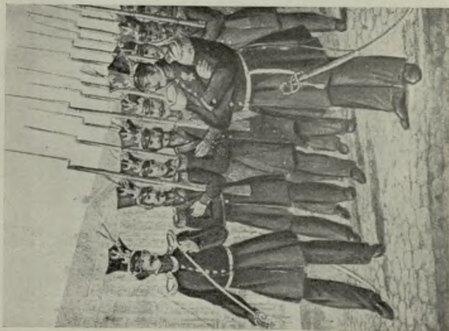
Żydzi w Warszawskiej Gwardji Narodowej