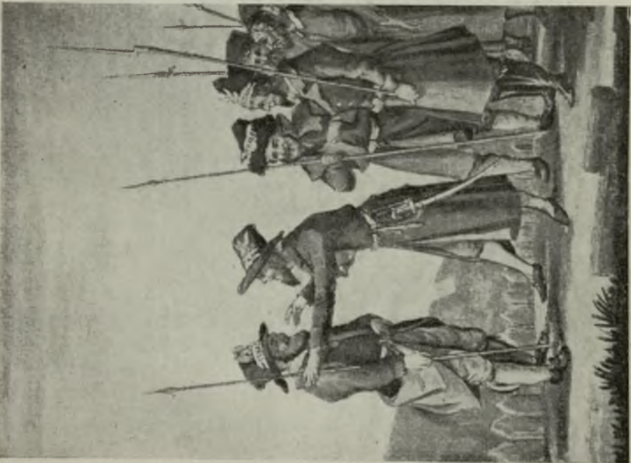
Żydowska Straż bezpieczeństwa