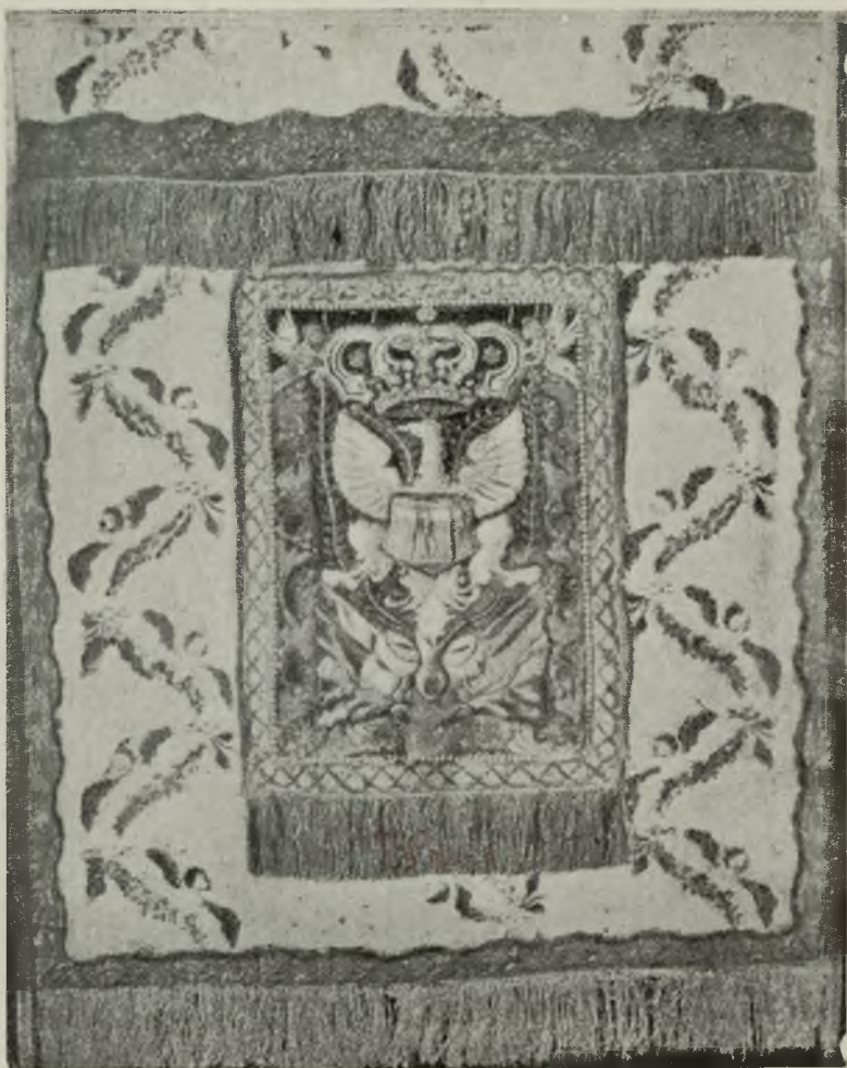
Chorągiew żydowskiej gwardji miejskiej w Warszawie z r. 1831.