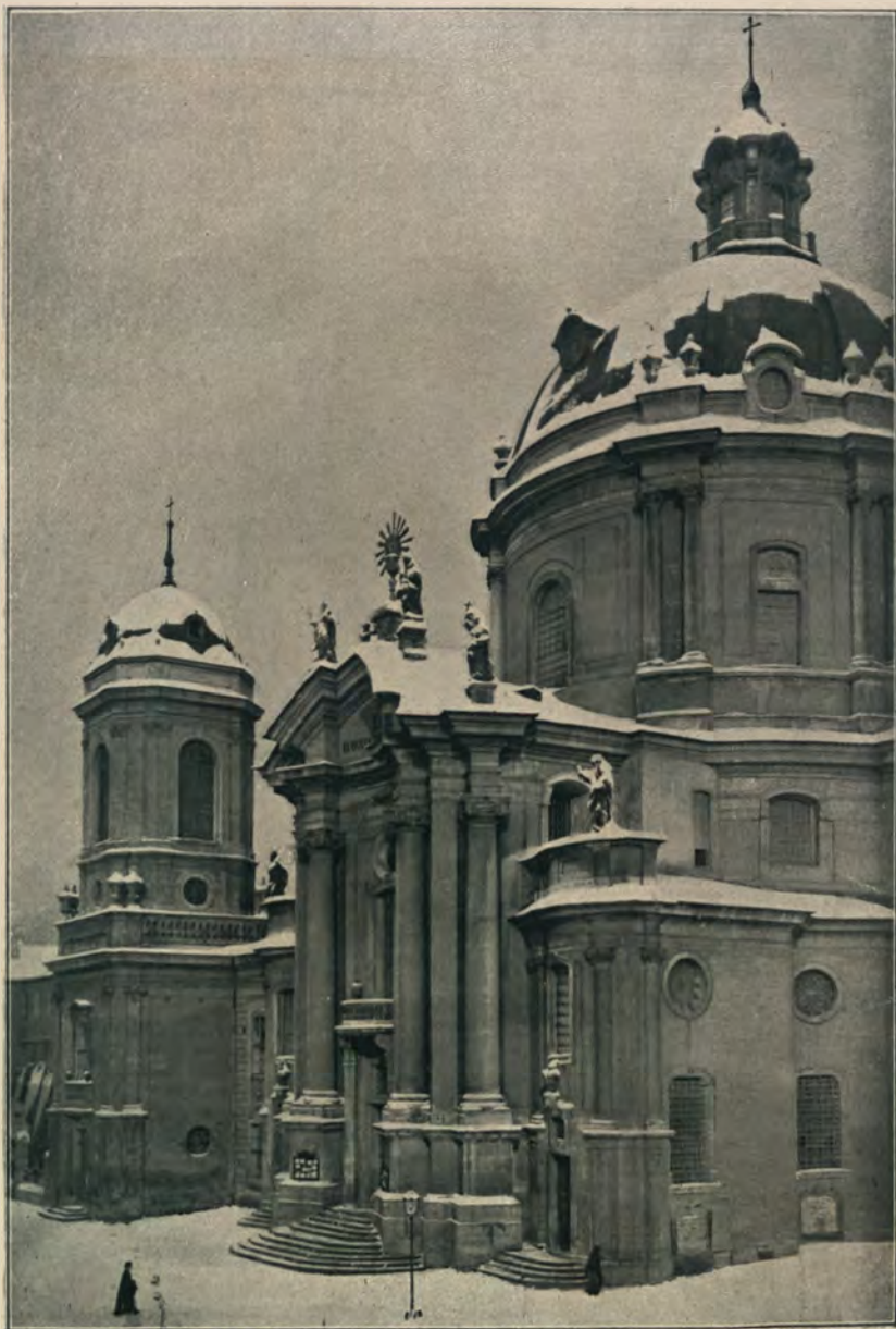
КОСТЕЛЪ ОО. ДОМИНИКАНОВЪ.