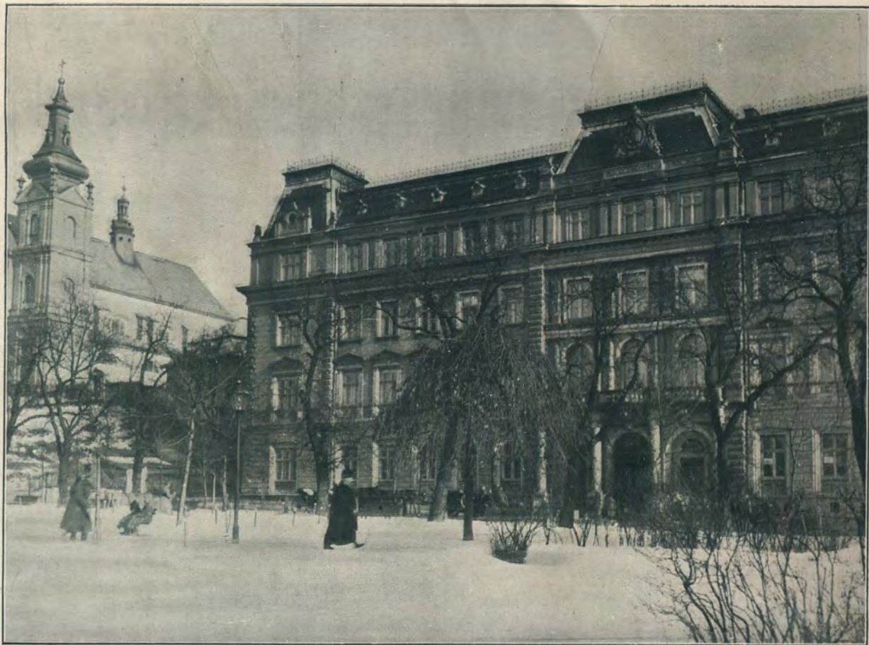
ДВОРЕЦЪ ГЕНЕРАЛЪ ГУБЕРНАТОРА.