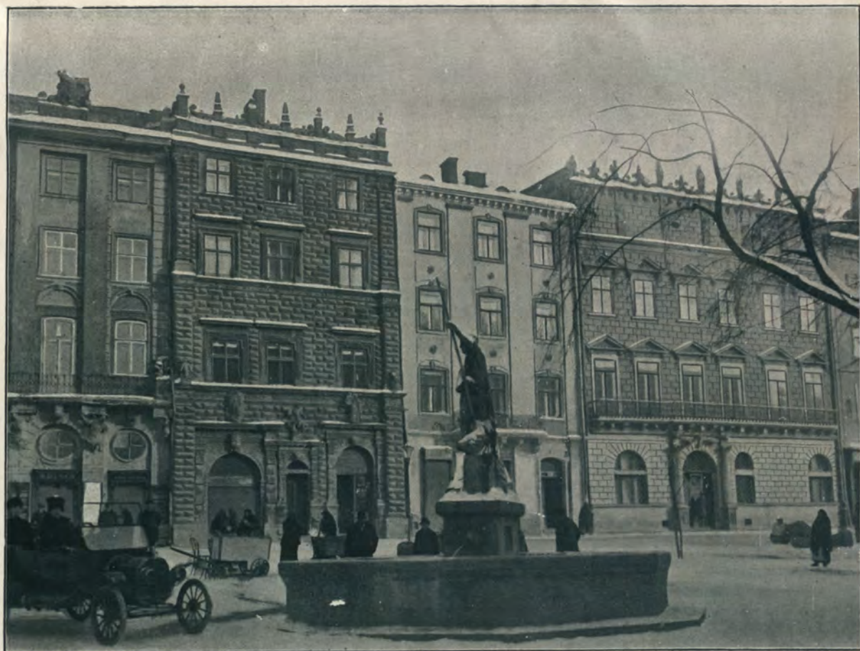
СТАРИННЫЕ ДОМА: „КОРОЛЕВСКИЙ И ЧЕРНЫЙ“.