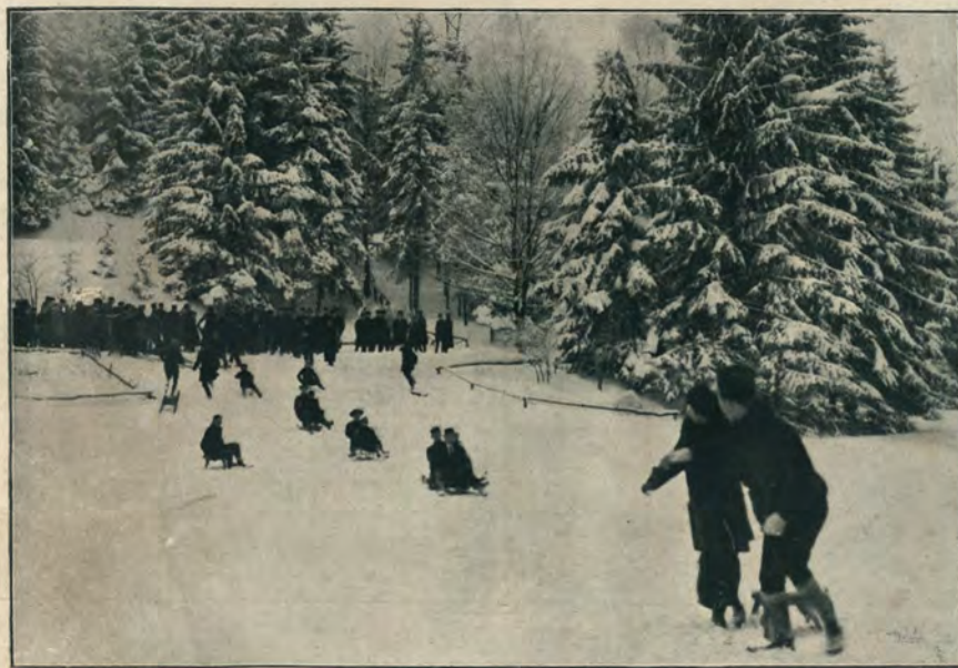
ЗИМНІЯ КАРТИНКИ ІЪ ПАРКЪ КИЛИНСКАГО.