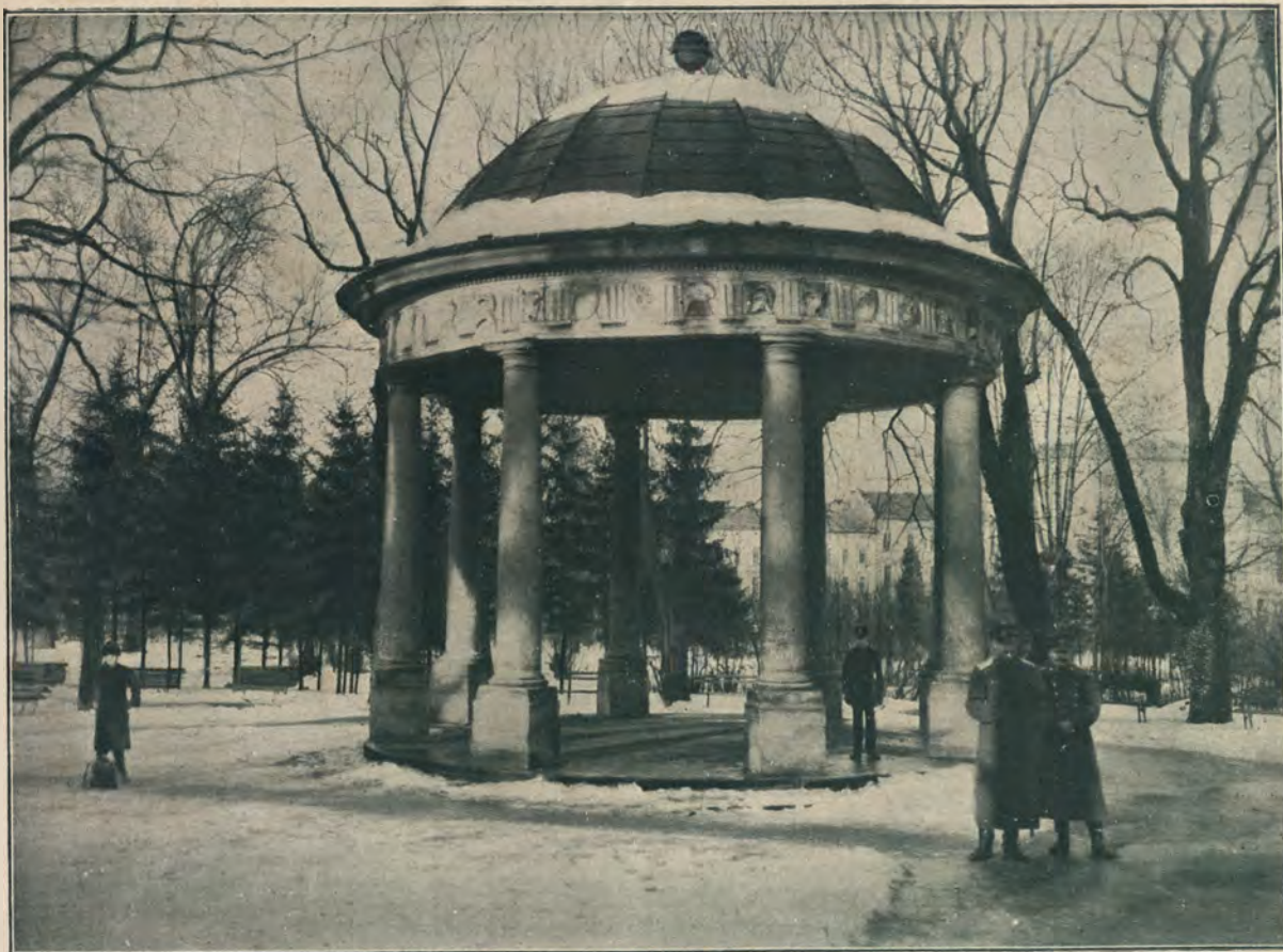
РОТОНДА ВЪ ГОРОДСКОМЪ САДУ.