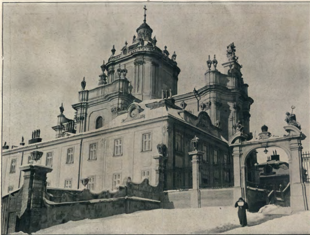
СОВОРЪ СВ. ЮРА.