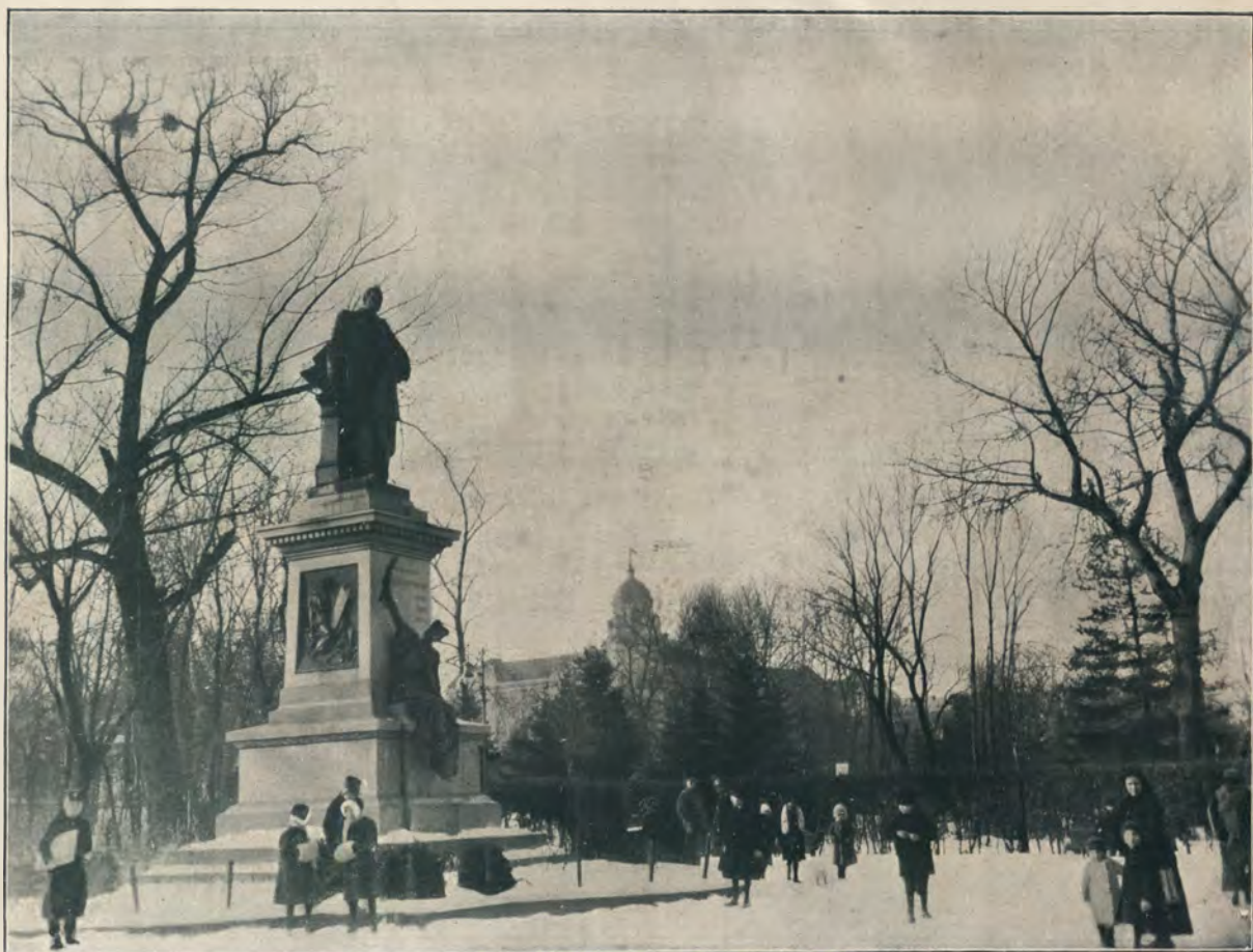
ПАМЯТНИКЪ ГР. ГОЛУХОВСКАГО.