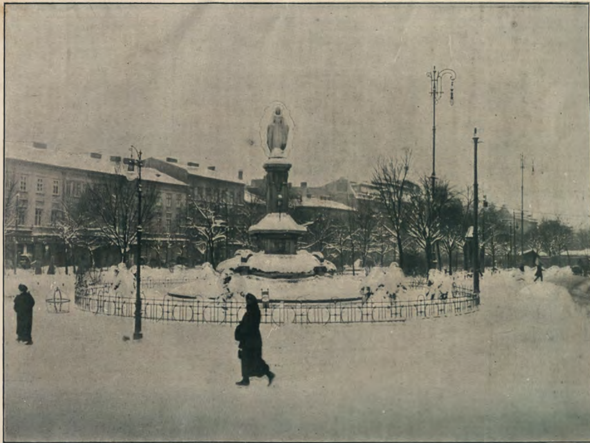
КОЛОДЕЗЬ СО СТАТУЕЙ БОГОМАТЕРИ НА МАРИНСКОЙ ПЛОЩАДИ.