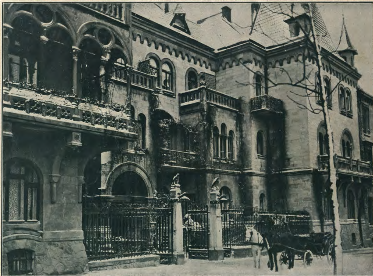
ДОМЪ N. 50 НА УЛ. ГР. А. ПОТОЦКАГО.