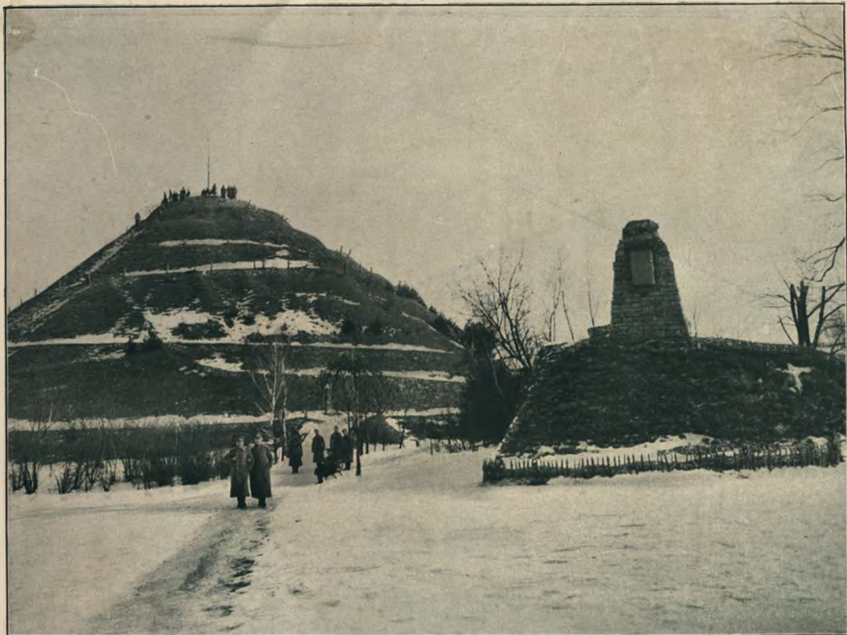
КУРГАНЪ ЛЮБЛИНСКОЙ УНИИ.