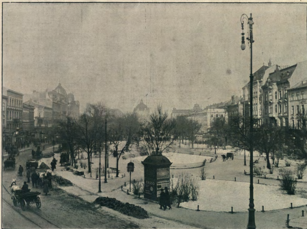
УЛ. КАРЛА ЛЮДОВИКА СЪ „ГЕТМАНСКИМИ ВАЛАМИ“.