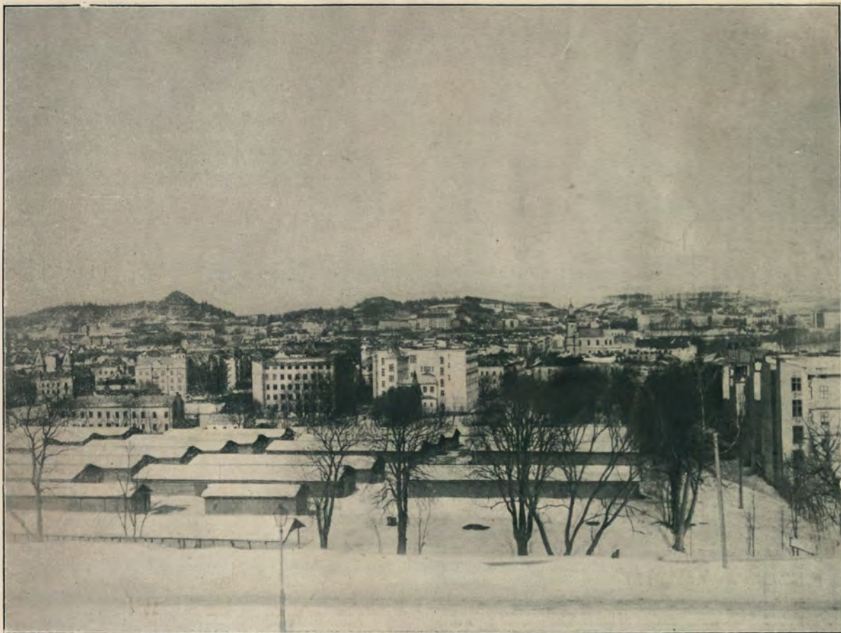
ПАНОРАМА Г. ЛЬВОВА.