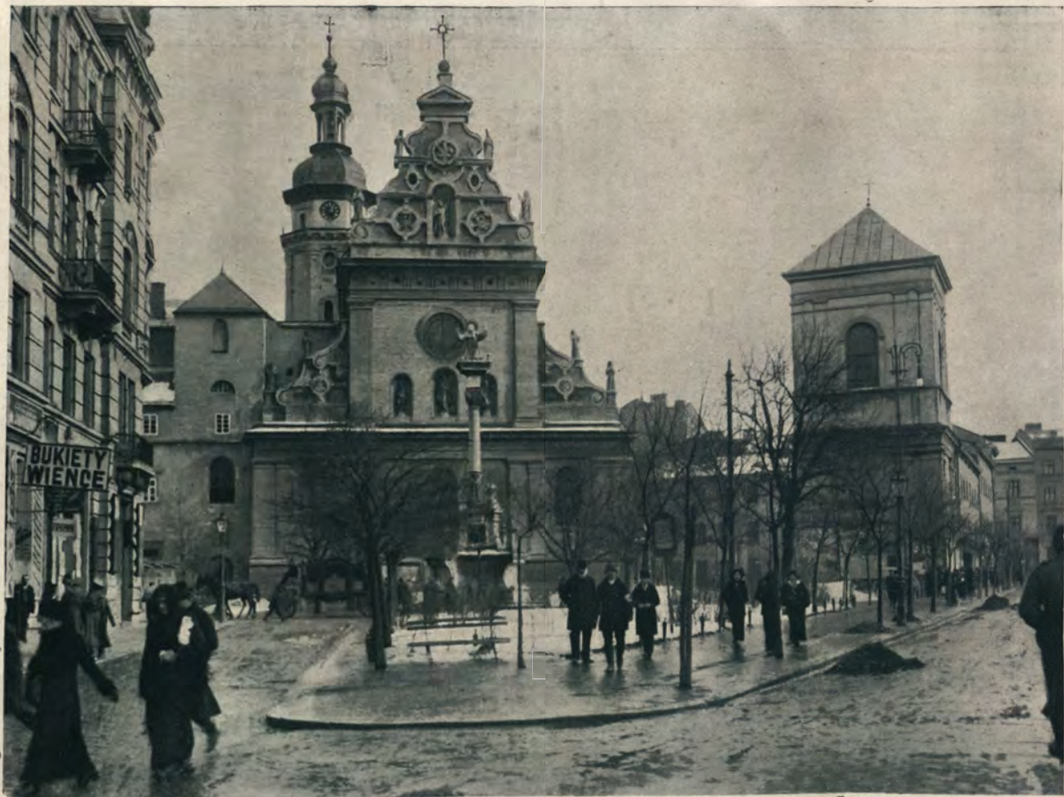
КОСТЕЛЪ ОО. БЕРНАРДИНОВЪ.