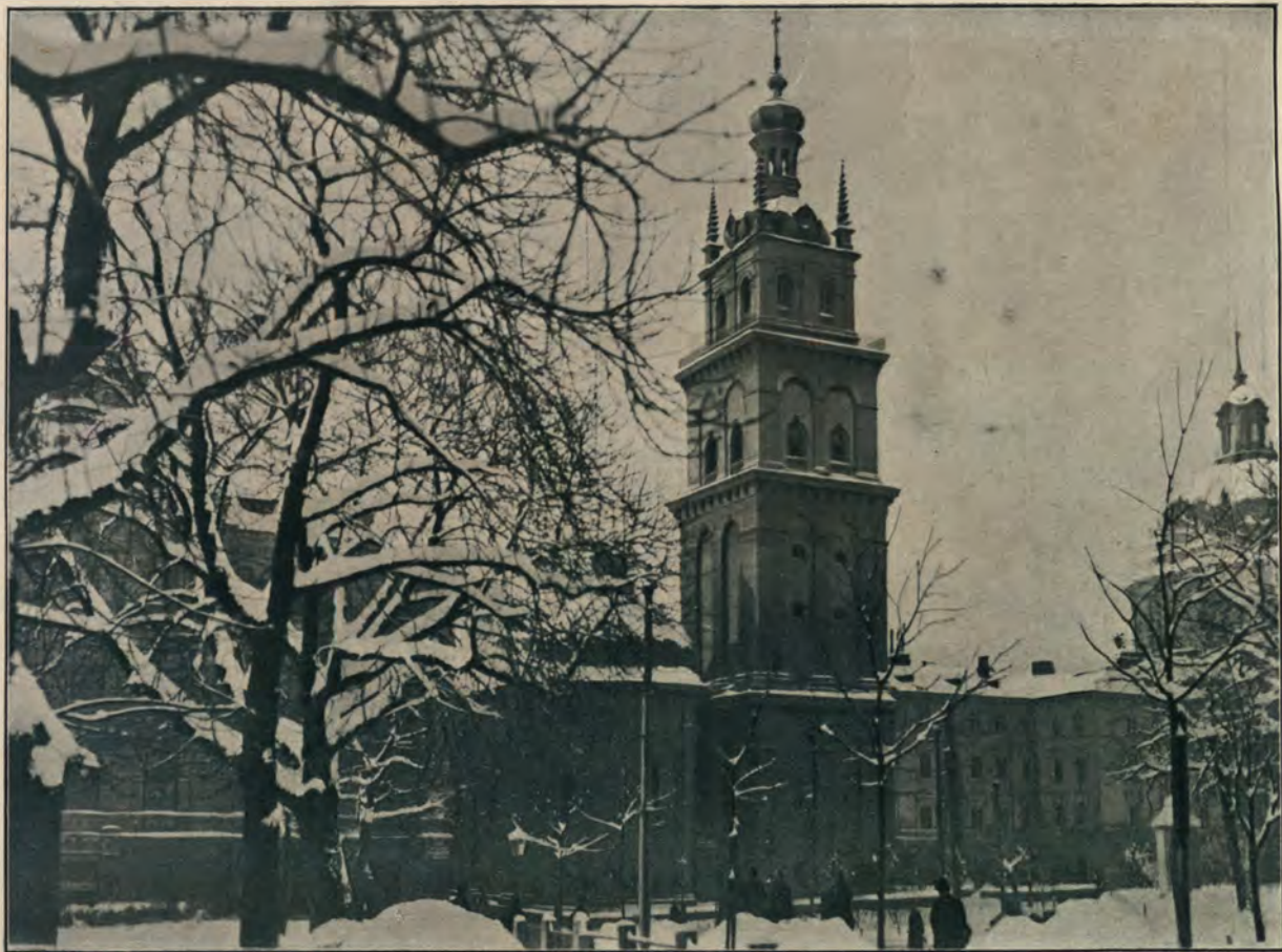
УСПЕНСКАЯ (ВОЛОСКАЯ) ЦЕРКОВЬ. }