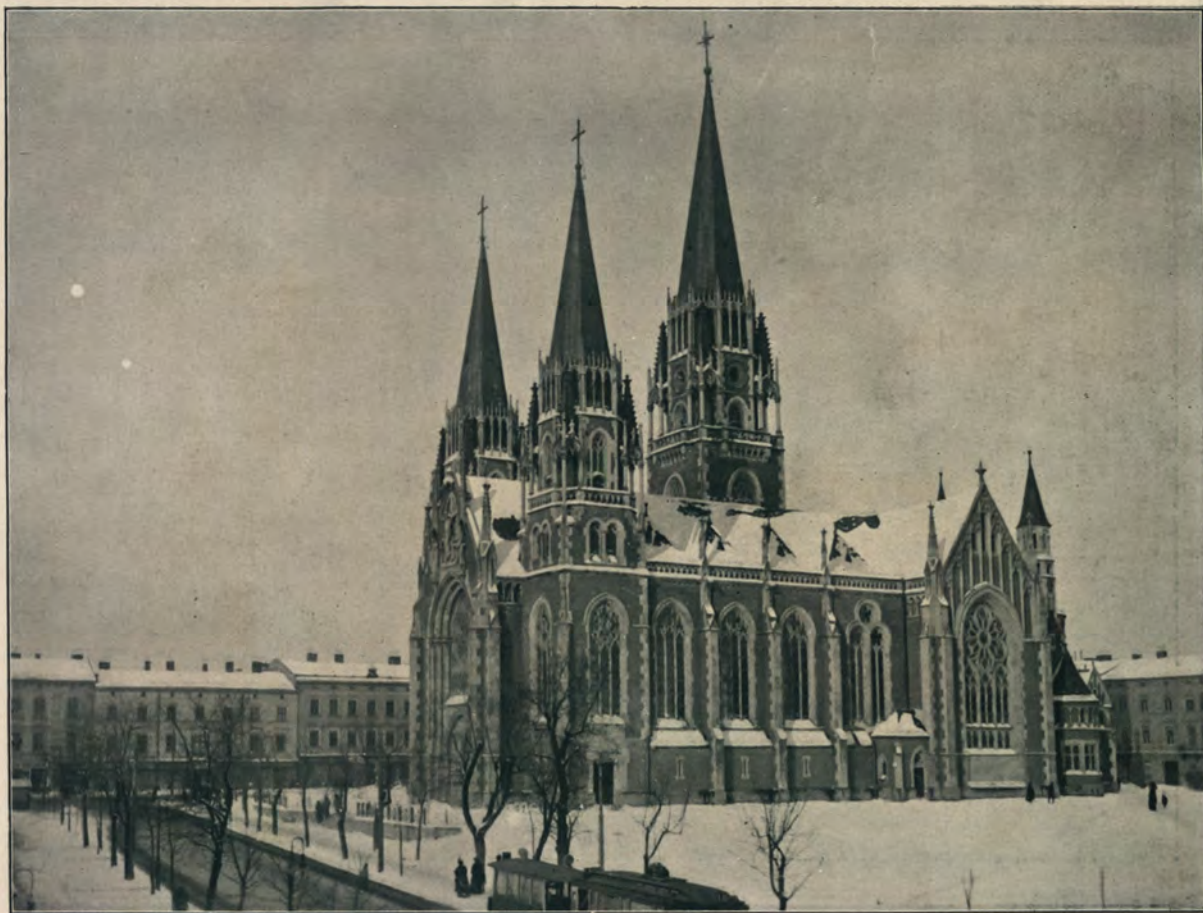
КОСТЕЛЪ СВ. ЕЛИСАВЕТЫ.