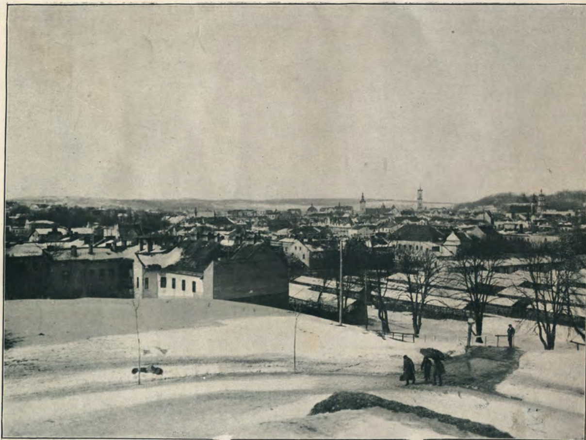
ПАНОРАМА Г. ЛЬВОВА.