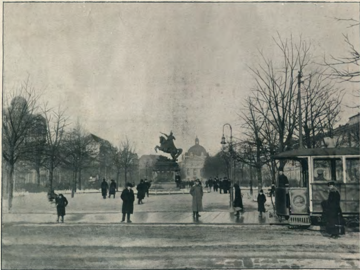
ПАМЯТНИКЪ ЯНА СОБЪССКАГО.