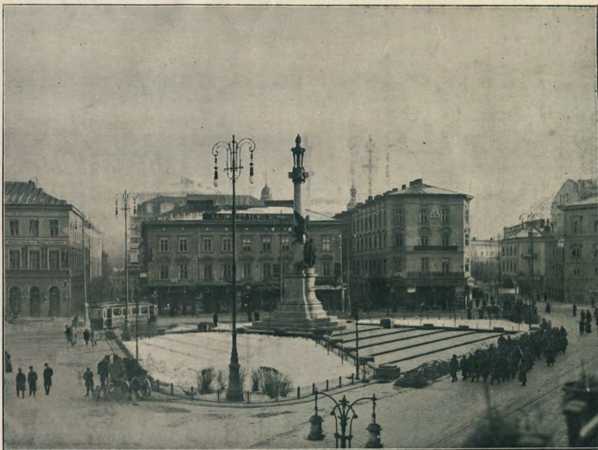
ПАМЯТНИКЪ АДАМА МИЦКЕВИЧА.