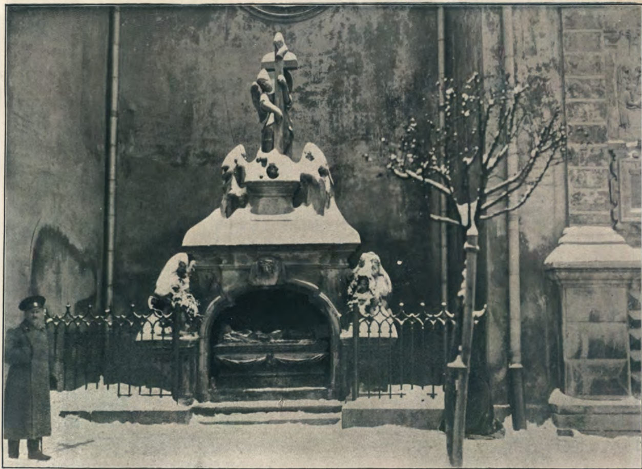
ЧАСТЬ КАТОЛИЧЕСКАГО СОБОРА.