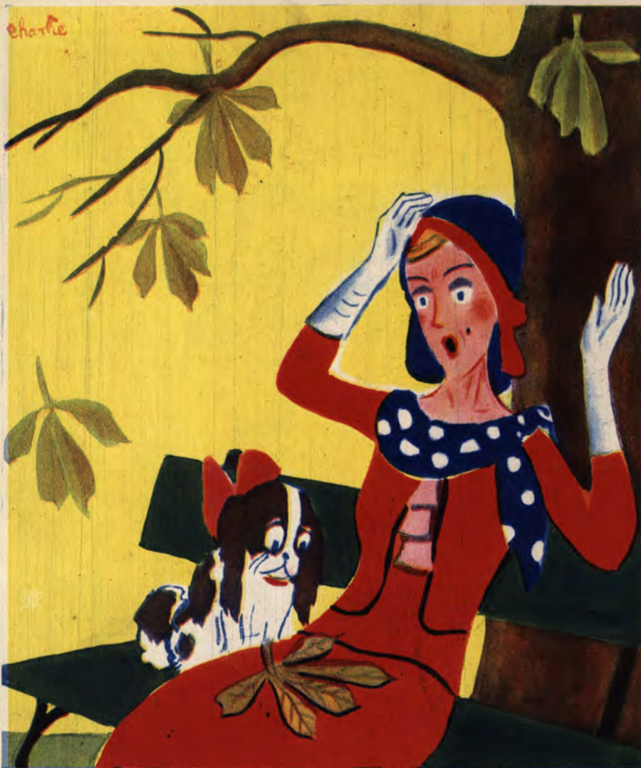
Więc lato moje już minęło?...