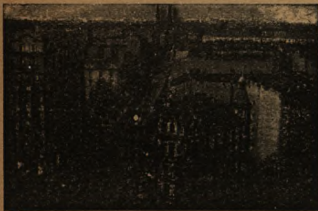
lub zostając w mieście

kupione lub zamówione za zaliczeniem pocztowym od