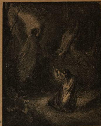
G. Doré: Chrystus w Ogrójcu .