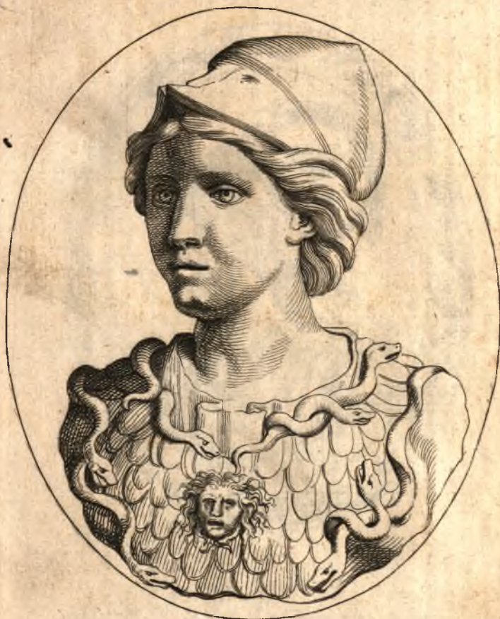
Statua in Agata