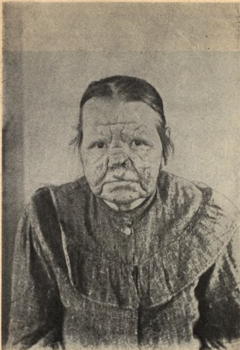
Фиг. 11. Прокаженная въ Крутыхъ Ручьяхъ. Смѣшанная форма проказы.

При нервной (гладкой) проказѣ появляются сначала красноватая пятна на кожѣ, которыя потомъ, съ наступленіемъ лихорадки, исчезаютъ, а въ конечностяхъ возникаютъ боли, напоминающія ревматическія, и выступаетъ повышенная чув-