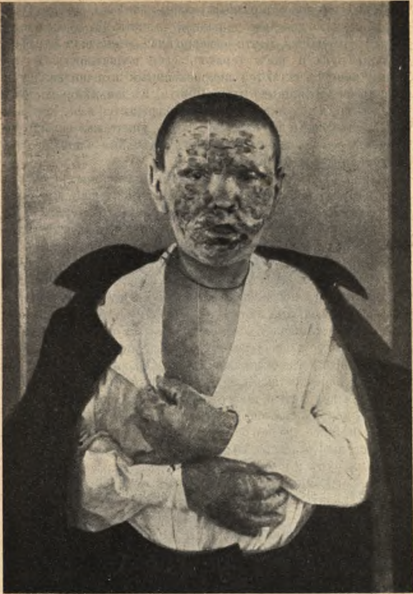
Фиг. 15. Прокаженный въ Крутыхъ Ручьяхъ. Смѣшанная форма проказы.

бенѣлый видъ, на немъ появляется какая-то постоянная, никогда не измѣняющаяся трупная мертвота. Вѣки глазъ съ трудомъ опускаются, а иногда совсѣмъ не закрываются, вслѣд-