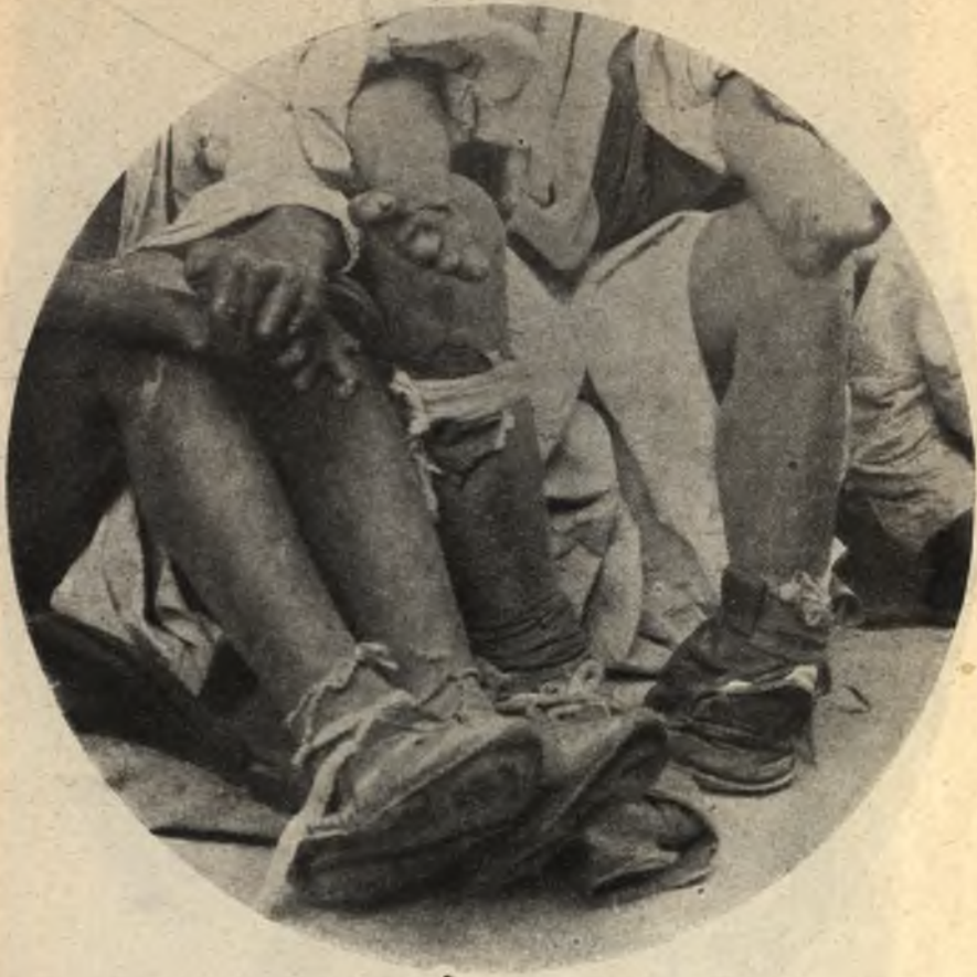
Фиг. 9. Конечности прокаженныхъ.

зѣва, глотки и гортани, причѣмъ голосъ исчезаетъ совершенно. На языкѣ тоже образуются пузыри; языкъ утолщается и покрывается глубокими бороздами. Иногда разбухаютъ десны и становятся легко кровоточивыми, какъ при цынгѣ. Зубы часто,