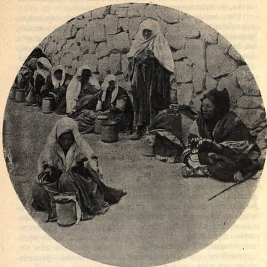
Фиг. 22. Группа прокаженныхъ въ Иерусалимѣ.

женныхъ, субсидируемые правительствомъ, въ Рамле, Наблюсь и Силуанѣ, гдѣ пользуются полною свободою, объединяются въ организованное общество и избираютъ старшину, т. е. шейха. Каждый изъ ходатайствующихъ о принятіи