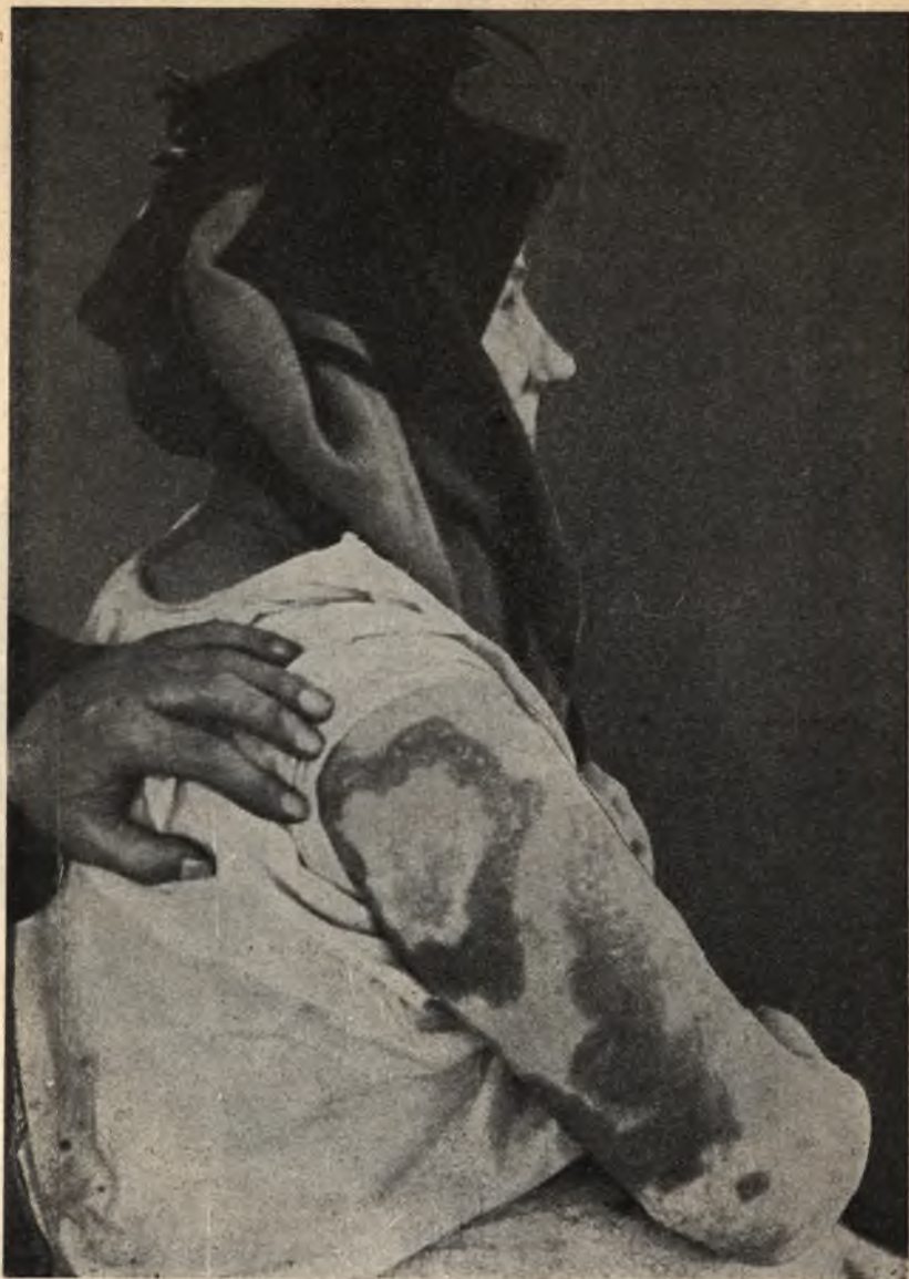
Фиг. 8. Прокаженная въ Крутыхъ Ручьяхъ.

у прокаженныхъ. Иногда вслѣдствіе лопанія пузырей язвы расширяются до такой степени, что занимаютъ всю полость