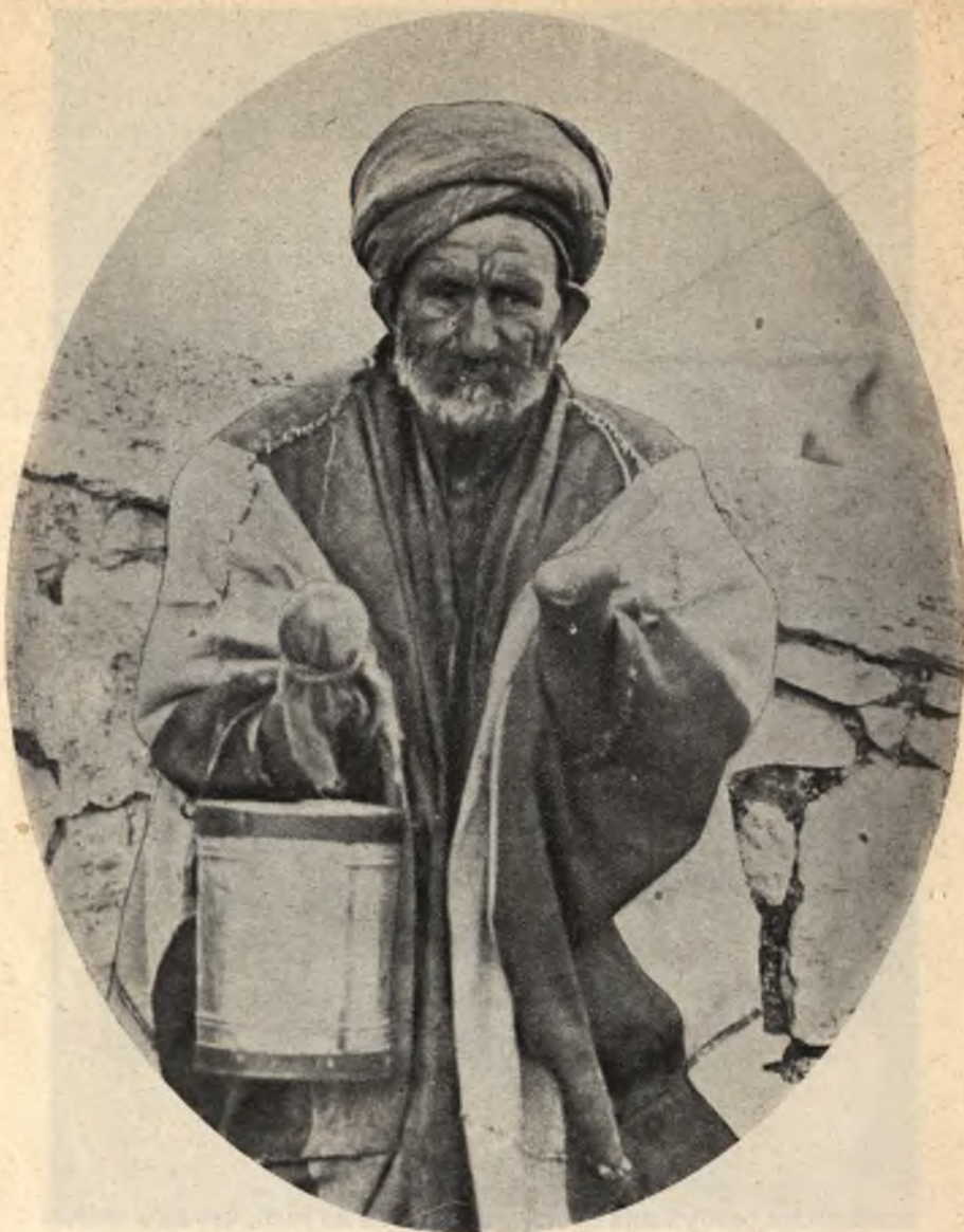
Фиг. 10. Прокаженный въ Иерусалимѣ съ отпавшими кистями рукъ.

Lyder-Borthen-Lie, Die Lepra des Auges, 1899;