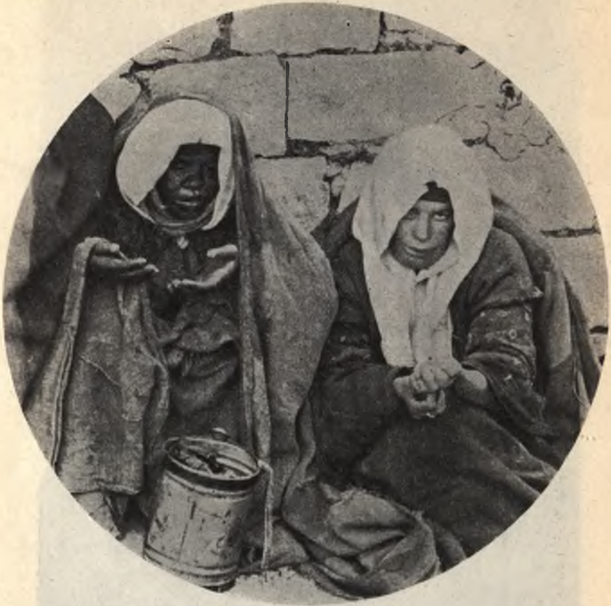
Фиг. 19. Прокаженные въ Иерусалимѣ.

опасною и заразною. Во врачебномъ мѣрѣ, среди специалистовъ въ значительной мѣрѣ господствуетъ убѣжденіе, что проказа распространяется заразнымъ путемъ чрезъ микроорганизмы. Въ 1897 г. въ Берлинѣ состоялась особая конференція врачей, созванная для рѣшенія этого вопроса.