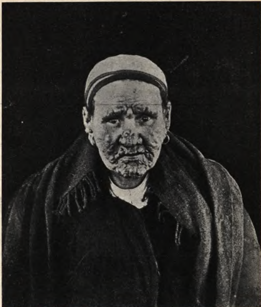
Фиг. 2. Бугристая проказа. Прокаженная въ Крутыхъ Ручьяхъ.

наружной сторонѣ рукъ, предплечій и ногъ. (Фиг. 4). Ее можно наблюдать также на слизистыхъ оболочкахъ рта, носа и глазъ. Въ началѣ кожа дѣлается блестящею и сухою; потомъ появля-