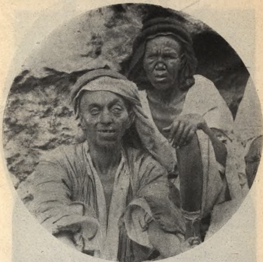
Фиг. 6. Прокаженные въ Иерусалимѣ.

смерть. У больныхъ нервной проказой въ Палестинѣ смерть наступаетъ въ теченіе 9\frac{1}{2} лѣтъ, на сѣверѣ Россіи 12 лѣтъ. У больныхъ узловатой проказой смерть наступаетъ гораздо позднѣе: у живущихъ въ Палестинѣ 18\frac{1}{2} , въ Россіи 22 года, въ Индіи до 30 лѣтъ.