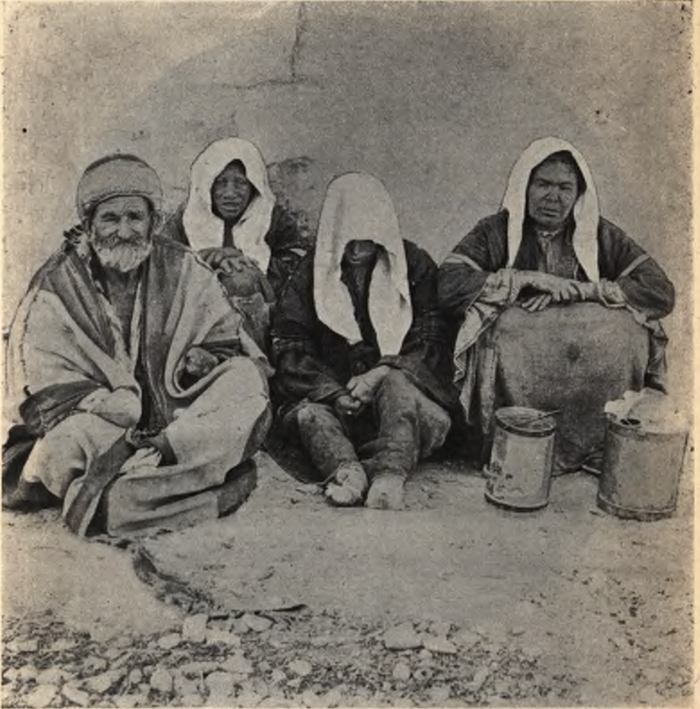
Фиг. 21. Группа прокаженныхъ въ Іерусалимѣ.

Дѣти природы—арабы цѣнятъ выше всего свободу, а потому предпочитаютъ скорѣе просить милостыни и жить въ бѣдности, но на волѣ, чѣмъ быть обезпеченными всѣмъ, но