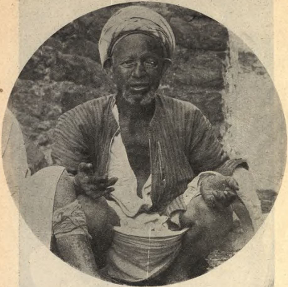
Фиг. 7. Прокаженный въ Іерусалимѣ.

Пузыри, образующіеся на слизистыхъ оболочкахъ, обыкновенно блѣднѣе, чѣмъ имѣющіеся на остальныхъ частяхъ кожи.