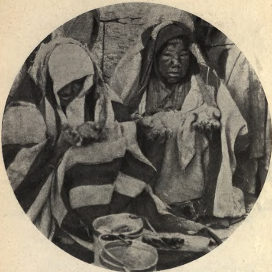
Фиг. 20. Прокаженныя въ Іерусалимѣ.

Какъ Д-ръ Эинслеръ , такъ и другіе приверженцы теоріи наследственности проказы, указываютъ какъ единственное