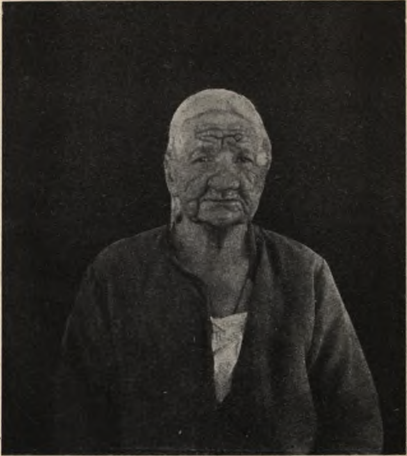
Фиг. 12. Прокаженная въ Крутыхъ Ручьяхъ. Первая проказа.

ствительность кожи. Въ дальнѣйшей стадіи развитія болѣзни кожа не обнаруживаетъ никакихъ измѣненій и иногда только кое-гдѣ значительно притупляется чувствительность; но затѣмъ она теряется все больше и больше и, наконецъ, исче-